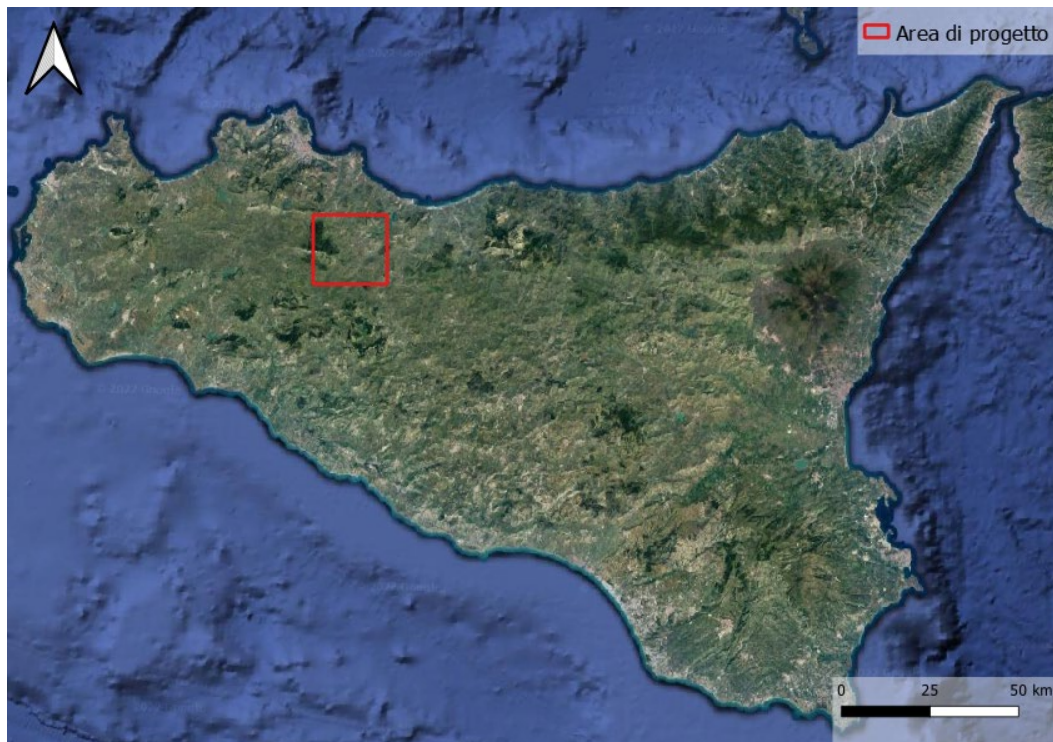
Figura 2-1: Inquadramento territoriale dell'impianto VRG Wind 040

L'impianto VRG-040 è localizzato a circa 30 km a Sud dal capoluogo, a 2 km in direzione Sud-Est rispetto al centro urbano del Comune di Villafrati ed a 0,8 km in direzione Sud/Sud-Ovest rispetto al centro storico di Campofelice di Fitalia.