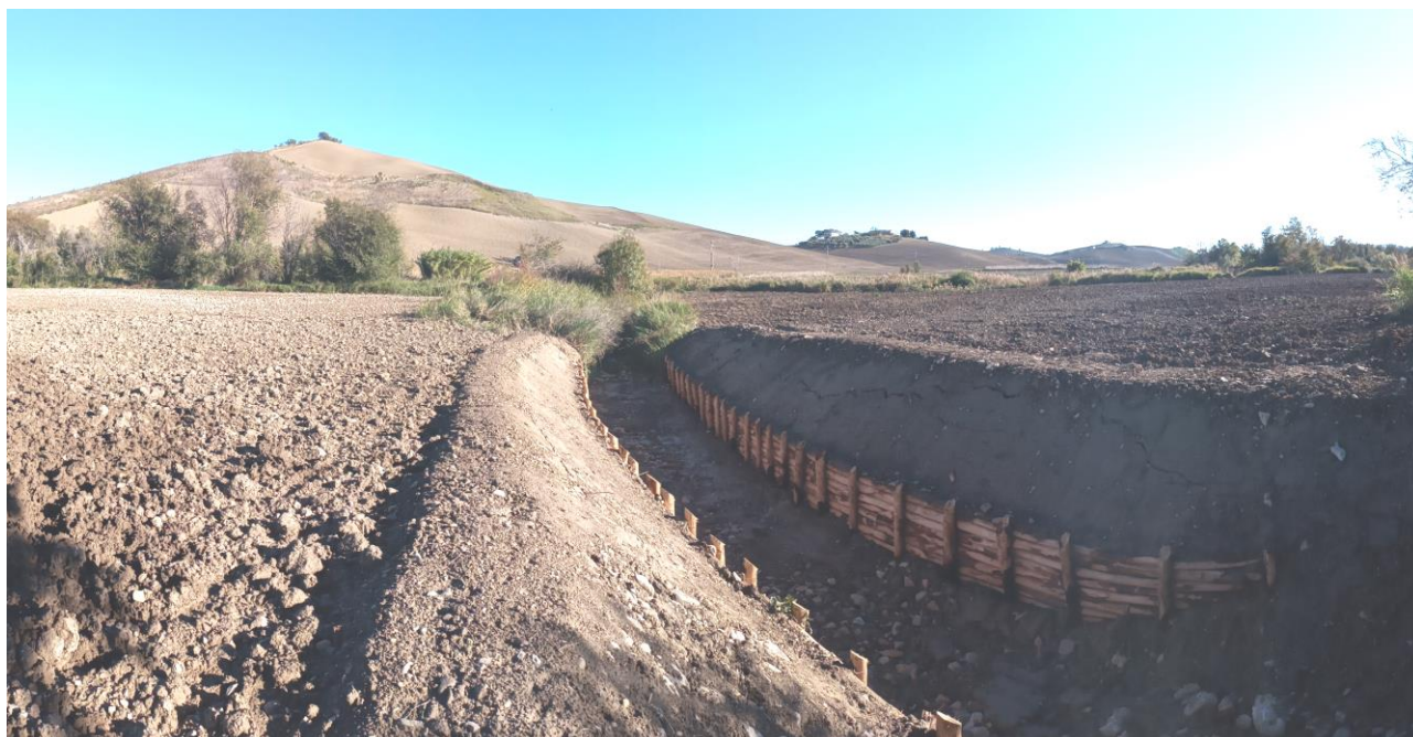
Fig. 1 – Ripristino canale irriguo con palizzate

È stata pertanto assicurata idonea copertura degli impianti di irrigazione interrati ed è stata eseguita la riprofilatura dei fossi di drenaggio e canali irrigui al fine di riportare la morfologia dei corpi idrici allo stato originario.