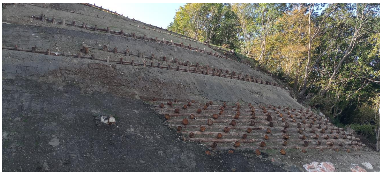
Fig. 3 – Opera di contenimento scarpate

In allegato 1 si riportano le dichiarazioni degli Appaltatori.