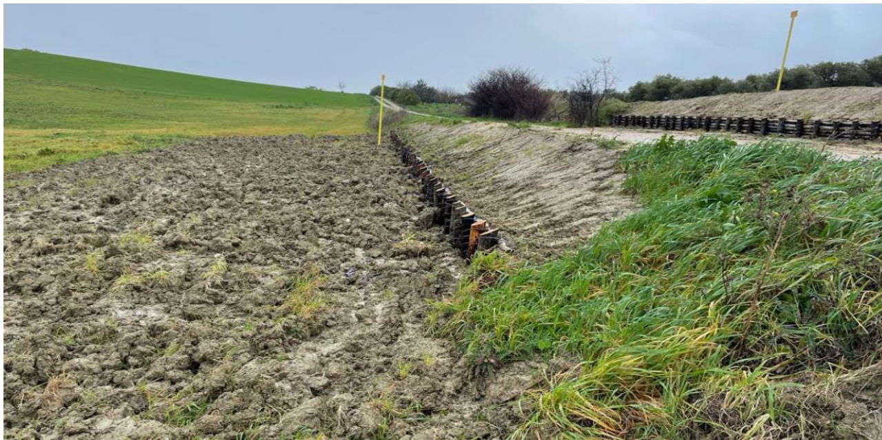
Fig. 2 – Realizzazione di palizzate in legno di contenimento scarpate