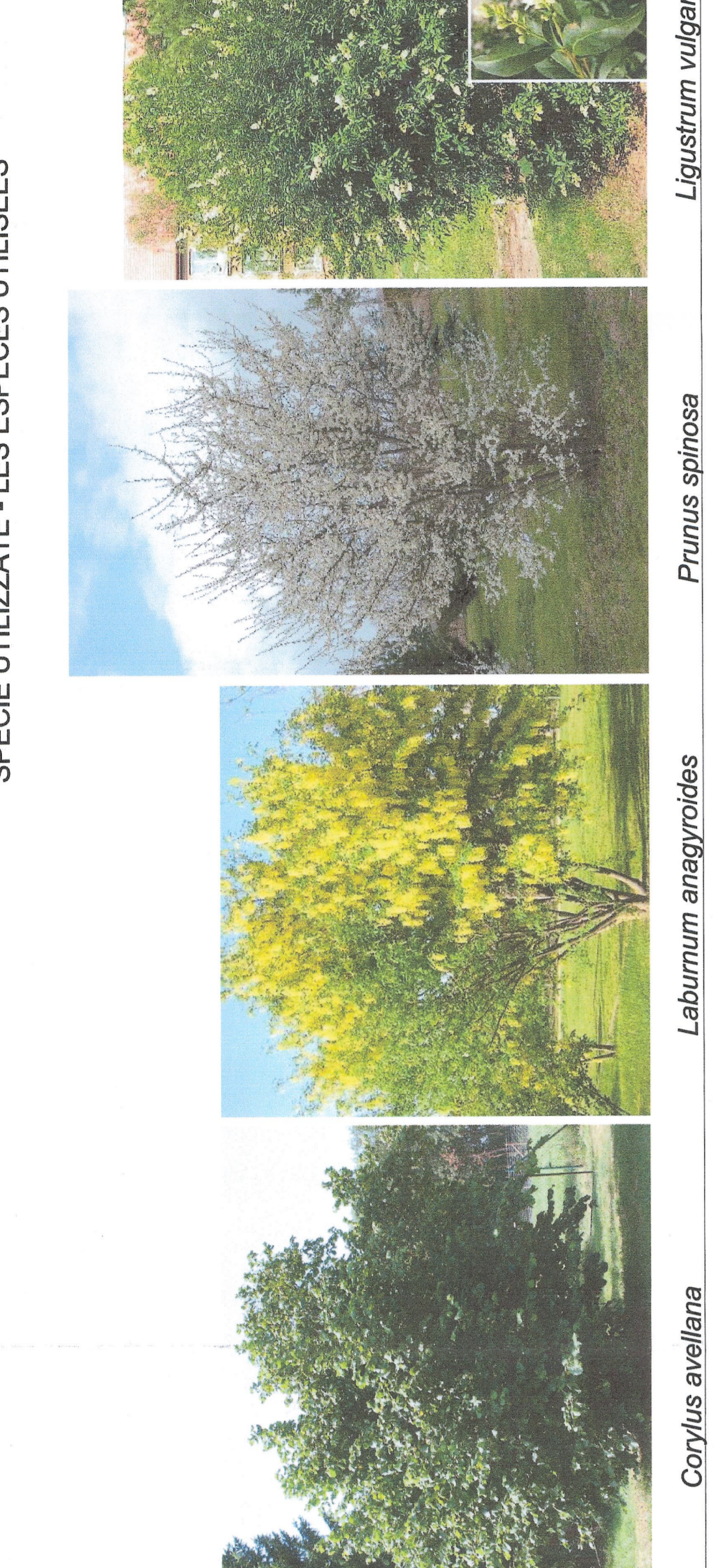
Corylus avellana, Laburnum anagyroides, Prunus spinosa, Ligustrum vulgare, Cornus sanguinea