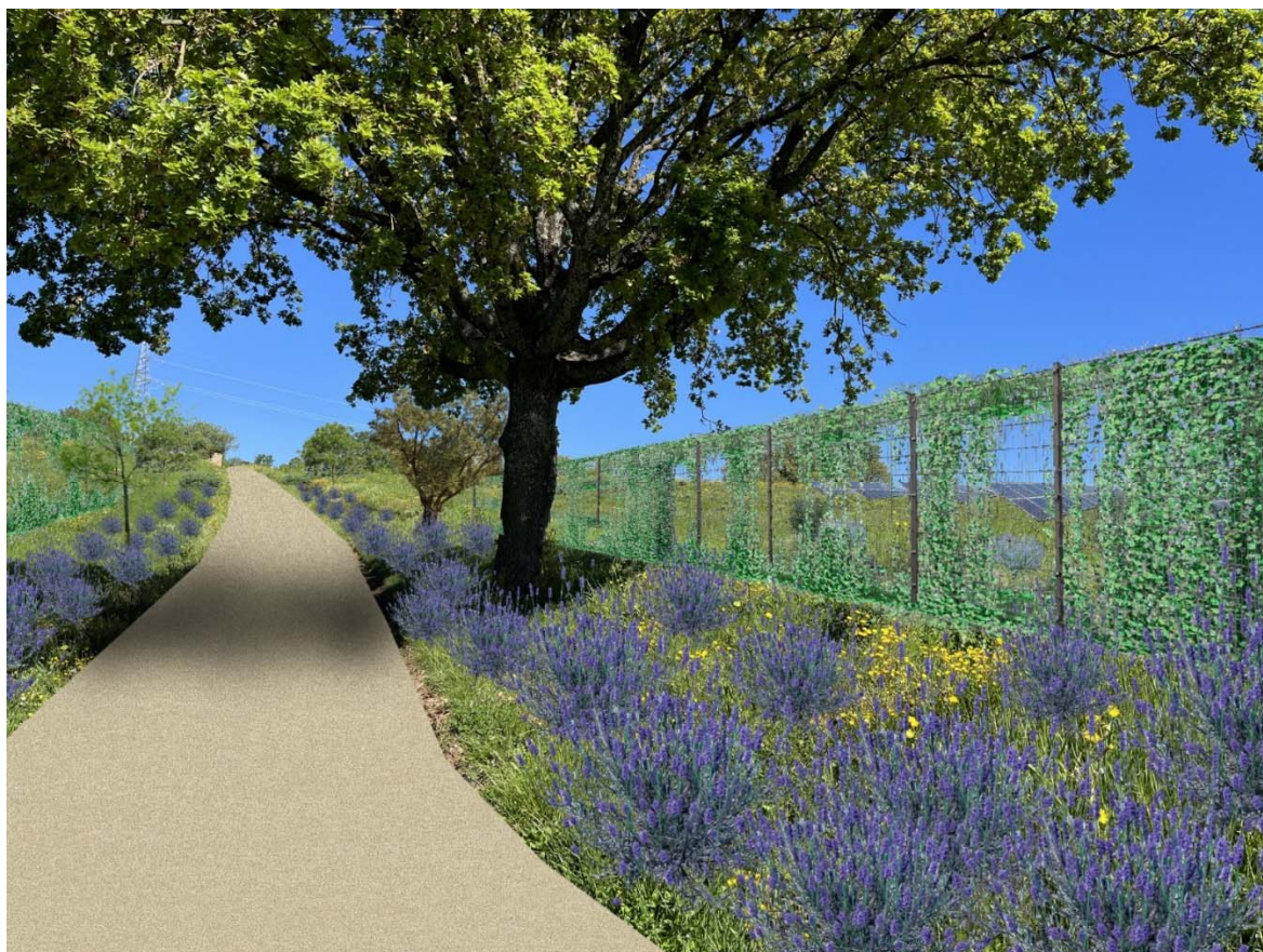
Foto 1 – individuazione sulla strada centrale che divide il campo “A” e “B”