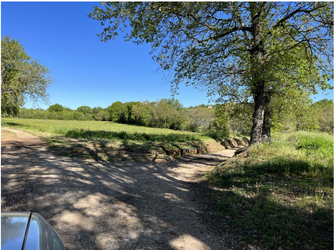
Foto 6 – individuazione dalla Strada Calvenzana verso i campi “A” e “B” di Colle Pastore