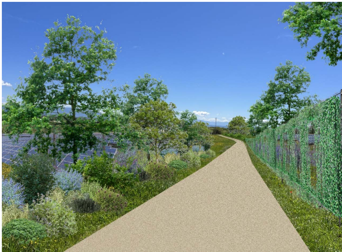
Foto 4 – individuazione sulla strada centrale che divide il campo “E” e “F”