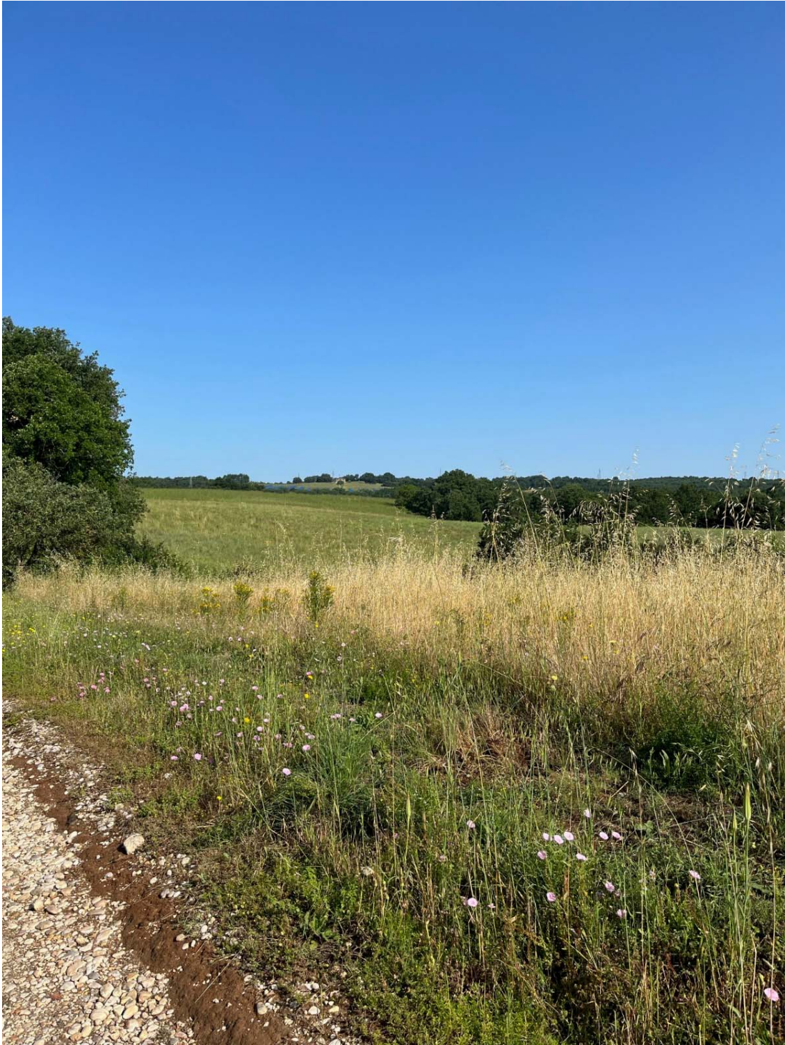
Foto 7 – individuazione dalla Strada Comunale Calvenzana verso i campi “A” e “B”