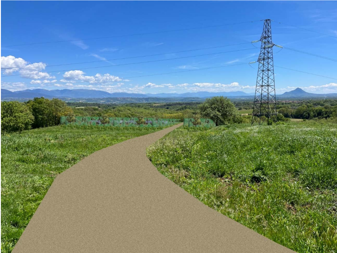
Foto 5 – individuazione da sotto il casale di Colle Pastore verso i campi “A” e “B”