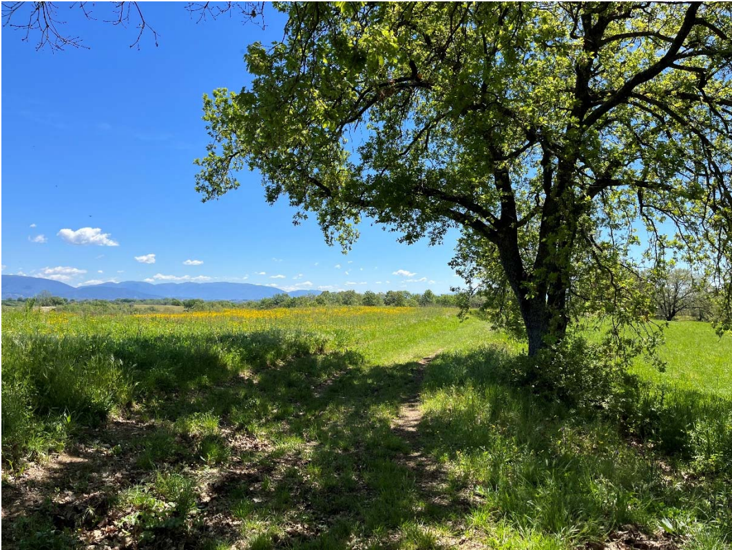
Cono Visivo 40