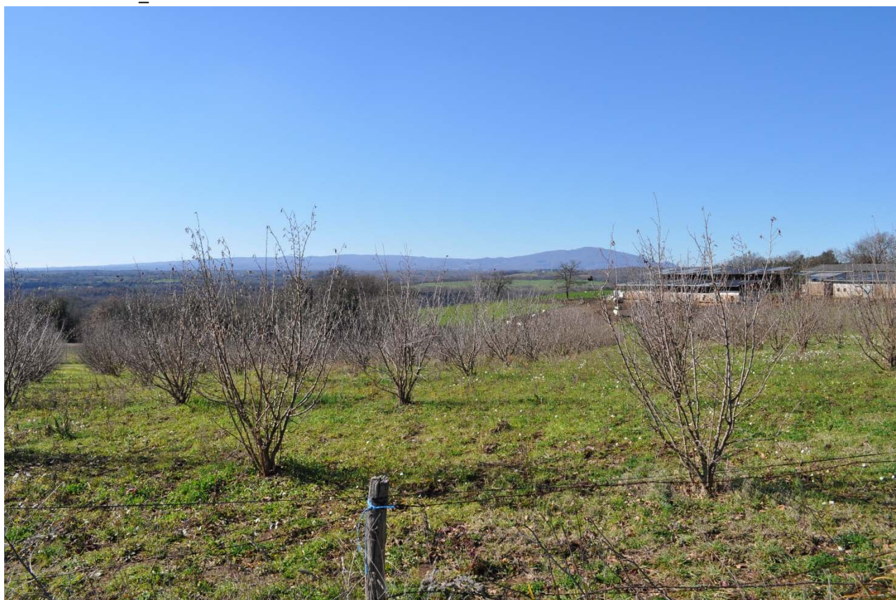
Cono Visivo DSC_0106