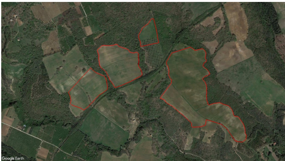
Figura 1. Inquadramento impianto su ortofoto