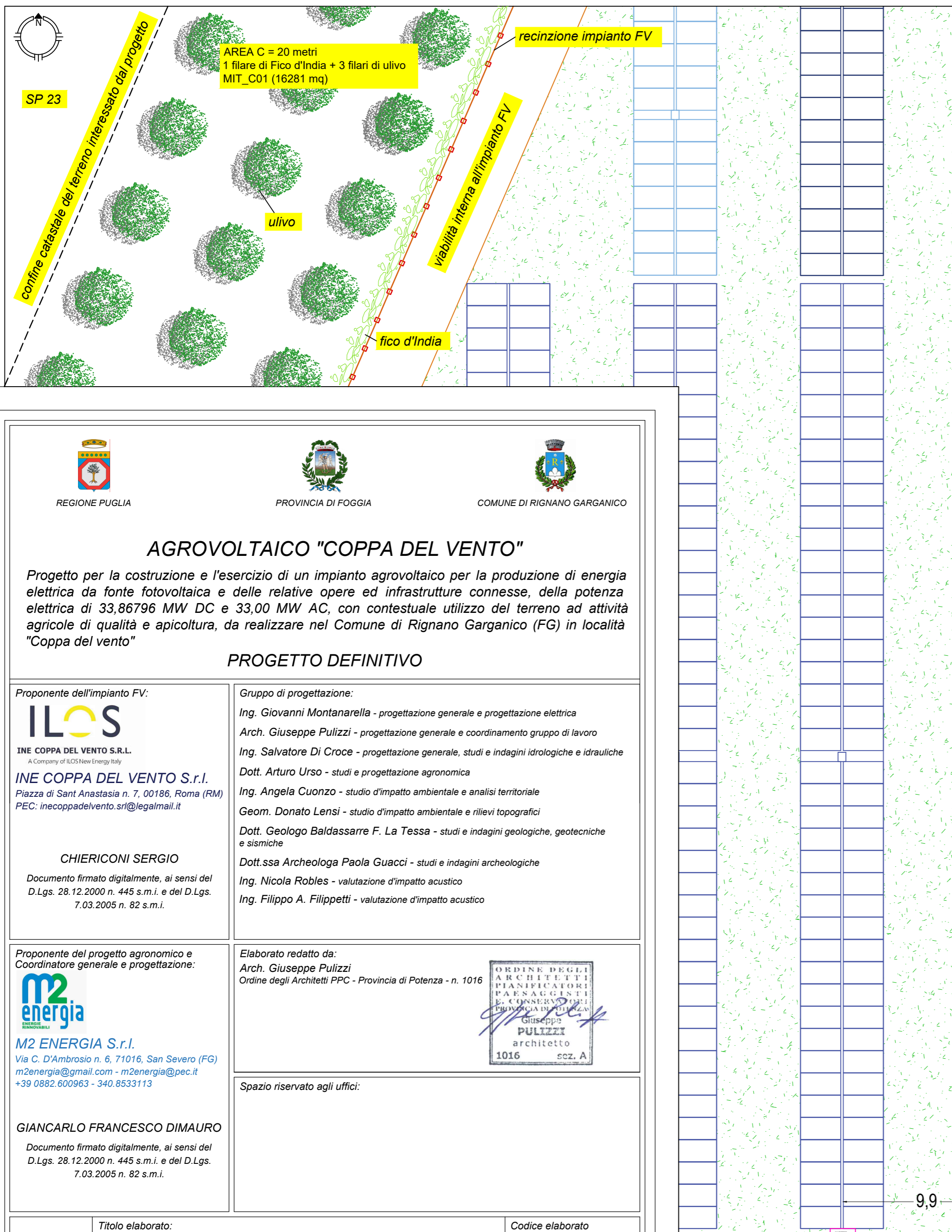
STRALCIO PLANIMETRICO DELL'IMPIANTO AGROVOLTAICO AREA DI MITIGAZIONE TIPO C