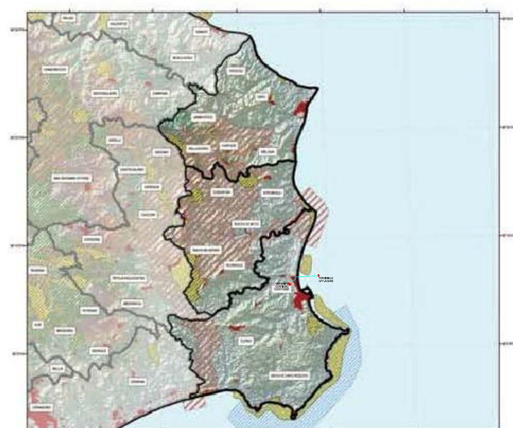
AREE PROTETTE E RETE NATURA Tav.4 Unità Area Urbanizzata SIR SIC ZPS Parchi Nazionali Parchi/Riserve Regionali Parchi/Riserve marine Riserve Naturali Statali