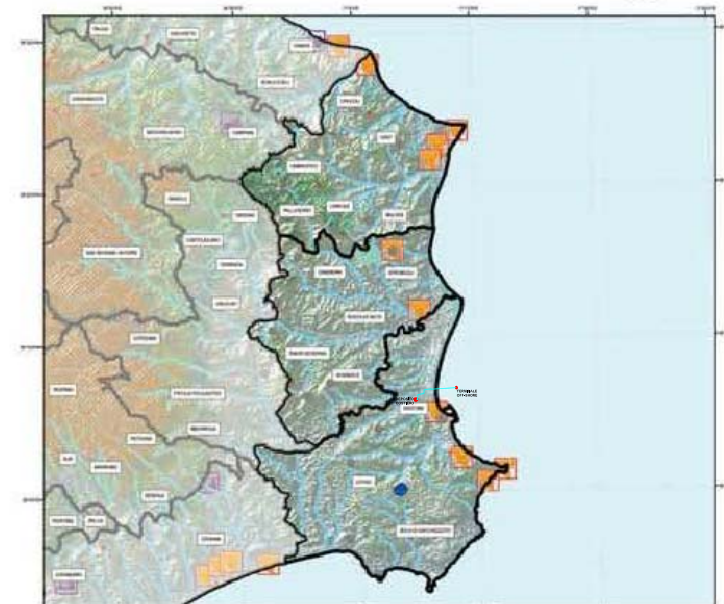
BENI CULTURALI e PAESAGGISTICI D.L. n°42/04 art. 134/136/142/143 Tav.5 Unità Centri storici Bellezze Panoramiche Singularità Geologiche Archaeologici Ambiti costieri Area Montane Foreste e Boschi Sponde dei Laghi Parchi e Riserve Zona Umida Monumenti Bizantini Fortificazioni Aree agricole barazzate