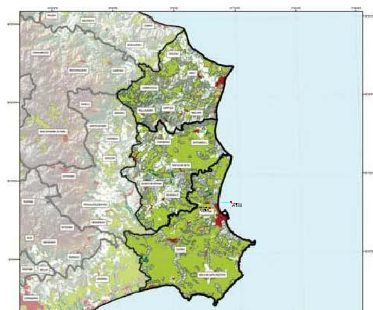
USO SUOLO Tav.2.2 Unità Area Urbanizzata Casali Aree artigianali Aree industriali o commerciali Aree portuali Dissacrifiche Frutti e Frutti minori Prati stabili Seminati Spiagge, dune, sabbie Oliveti Vigneti