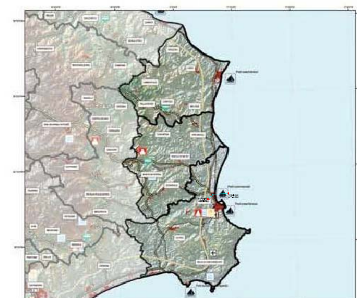
INFRASTRUTTURE E CULTURA Tav.3 Unità A3 Raccordi Di progetto SS18 Tarantina Percorso Strada Comunale Strada Provinciale Super Strada Parchi Iscritti Anfiteatri Musei valenza regionale Musei valenza locale Terme Università Ospedali