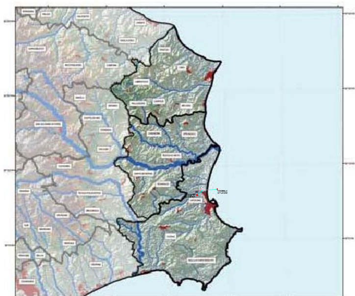
MORFOLOGIA Tav.2.1 Unità Area Urbanizzata