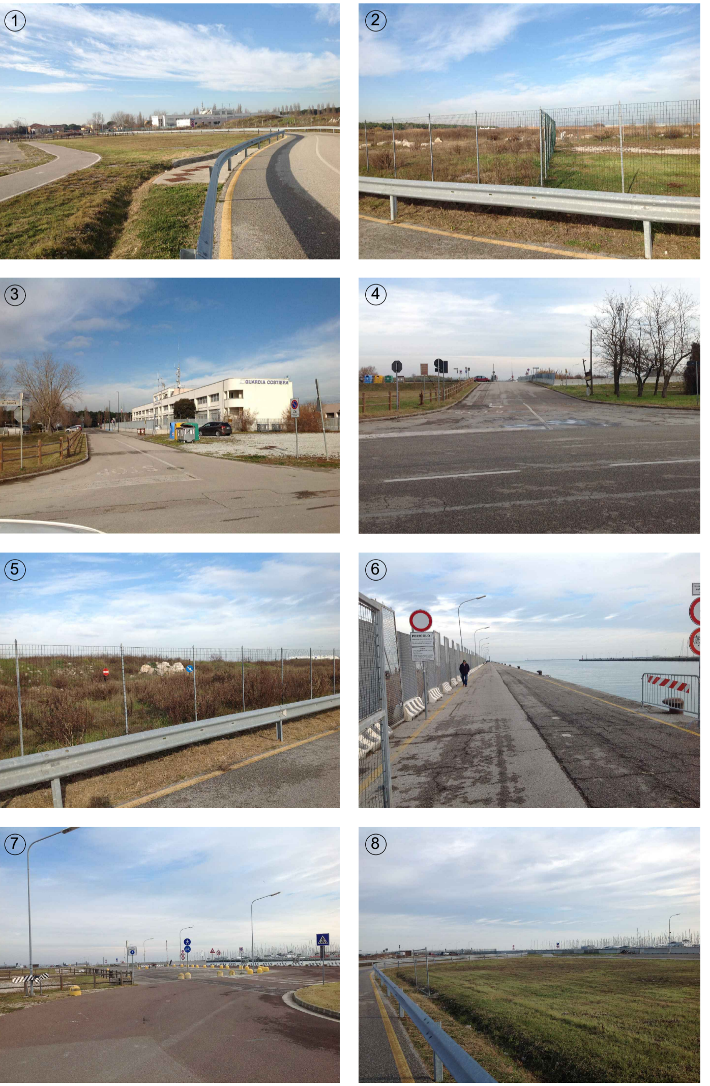
Foto stato di fatto