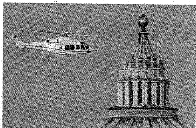
Alle 17 di ieri l'elicottero con il Papa ha lasciato il Vaticano