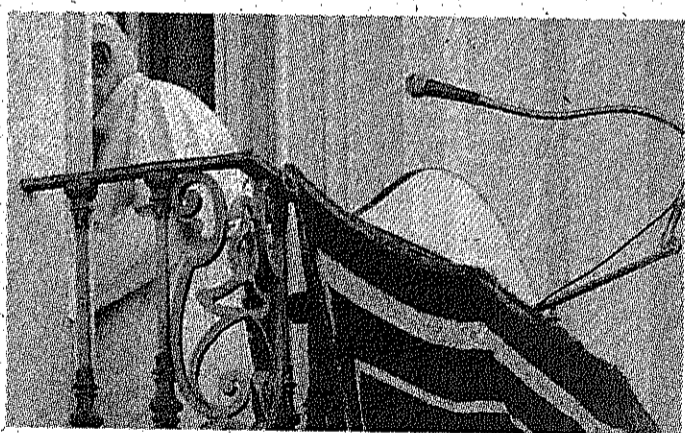
Benedetto XVI dopo il discorso dal balcone di Castel Gandolfo