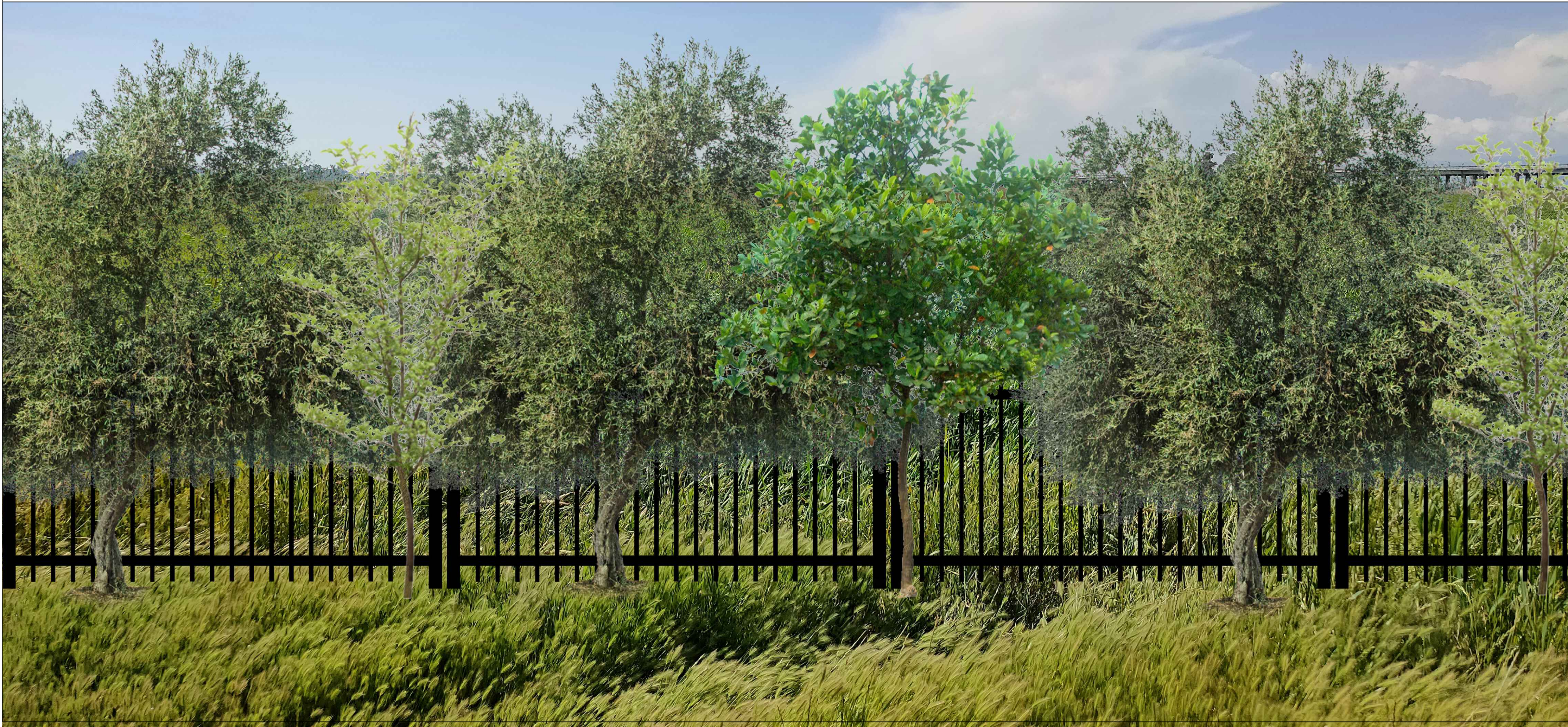
Fotoinserimento da interno campo - POST OPERAM