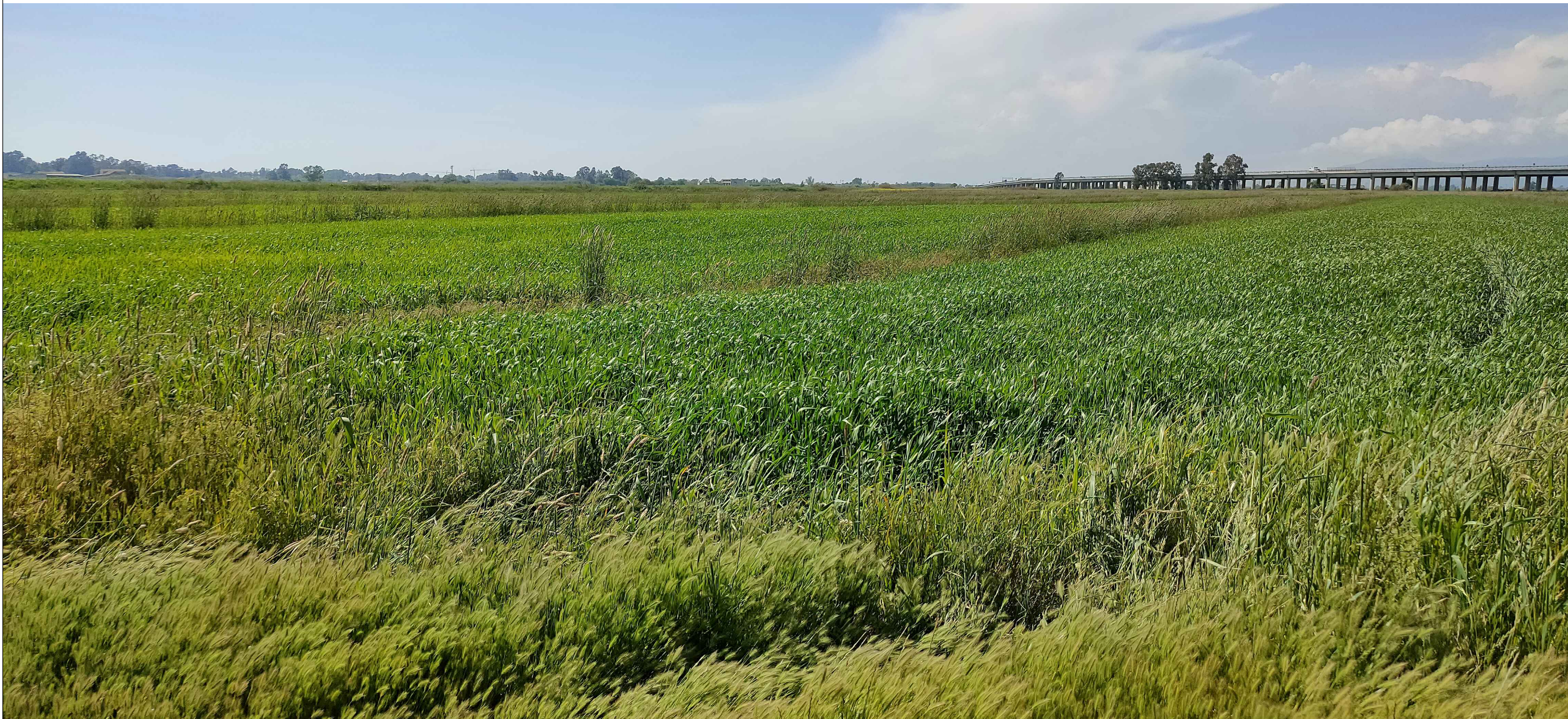
Fotoinserimento da interno campo - POST OPERAM