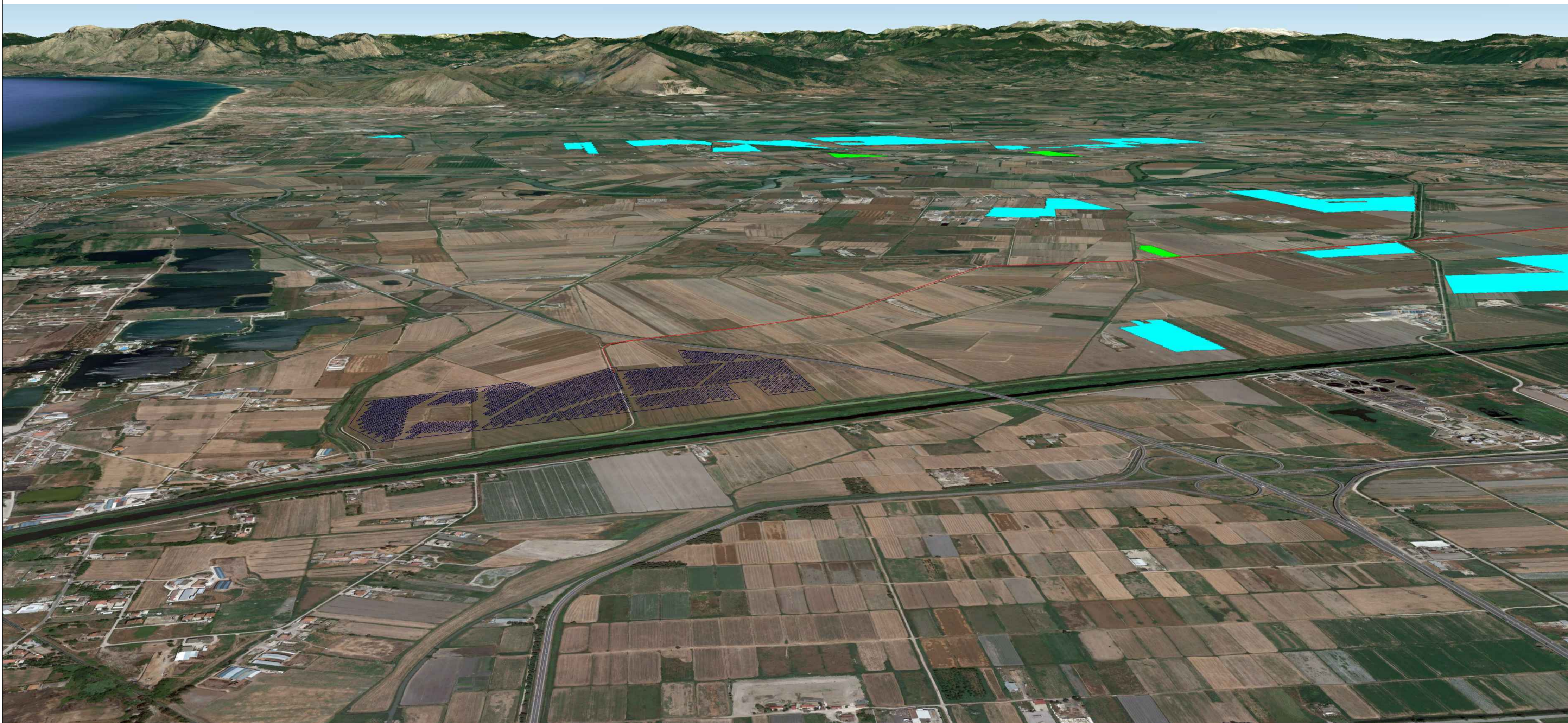
Vista verso Nord - di dettaglio