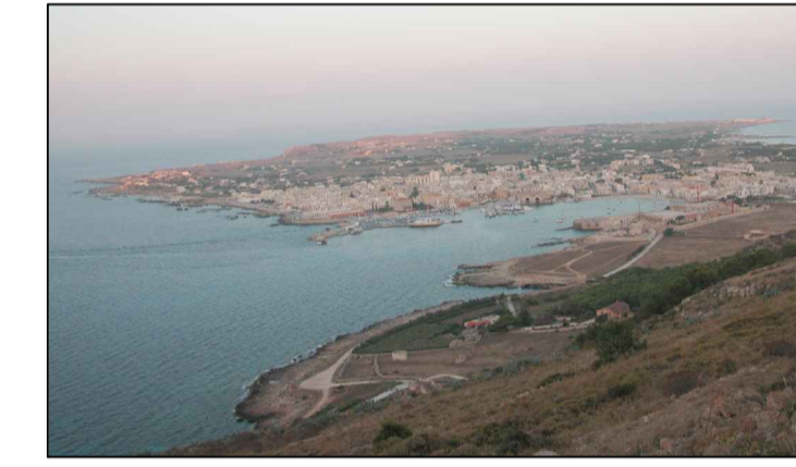
VISTA DALLA CROCE