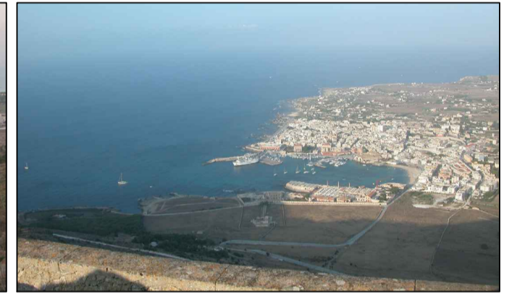
VISTA DAL FORTE S. CATERINA