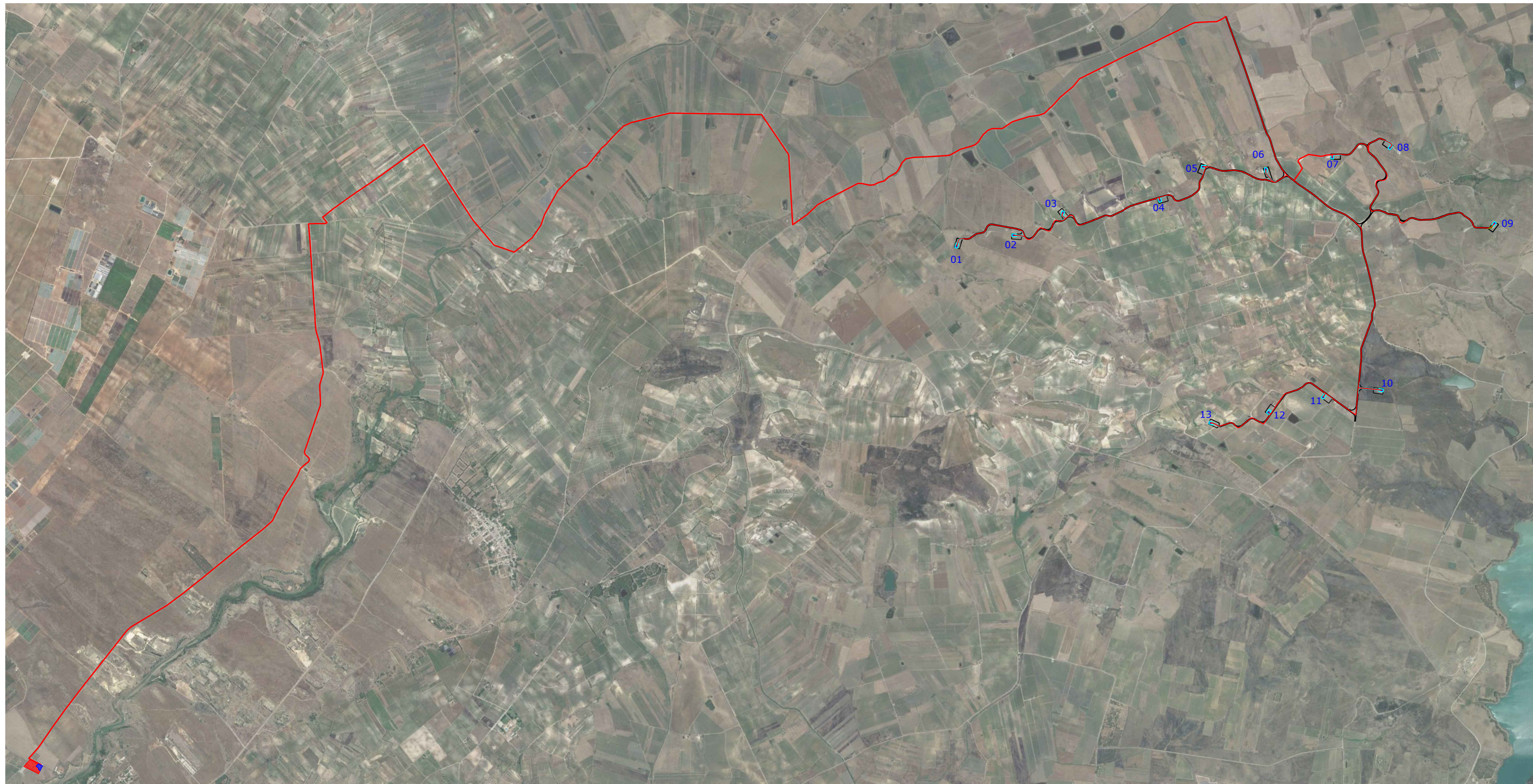
Planimetria Generale - scala 1:25.000