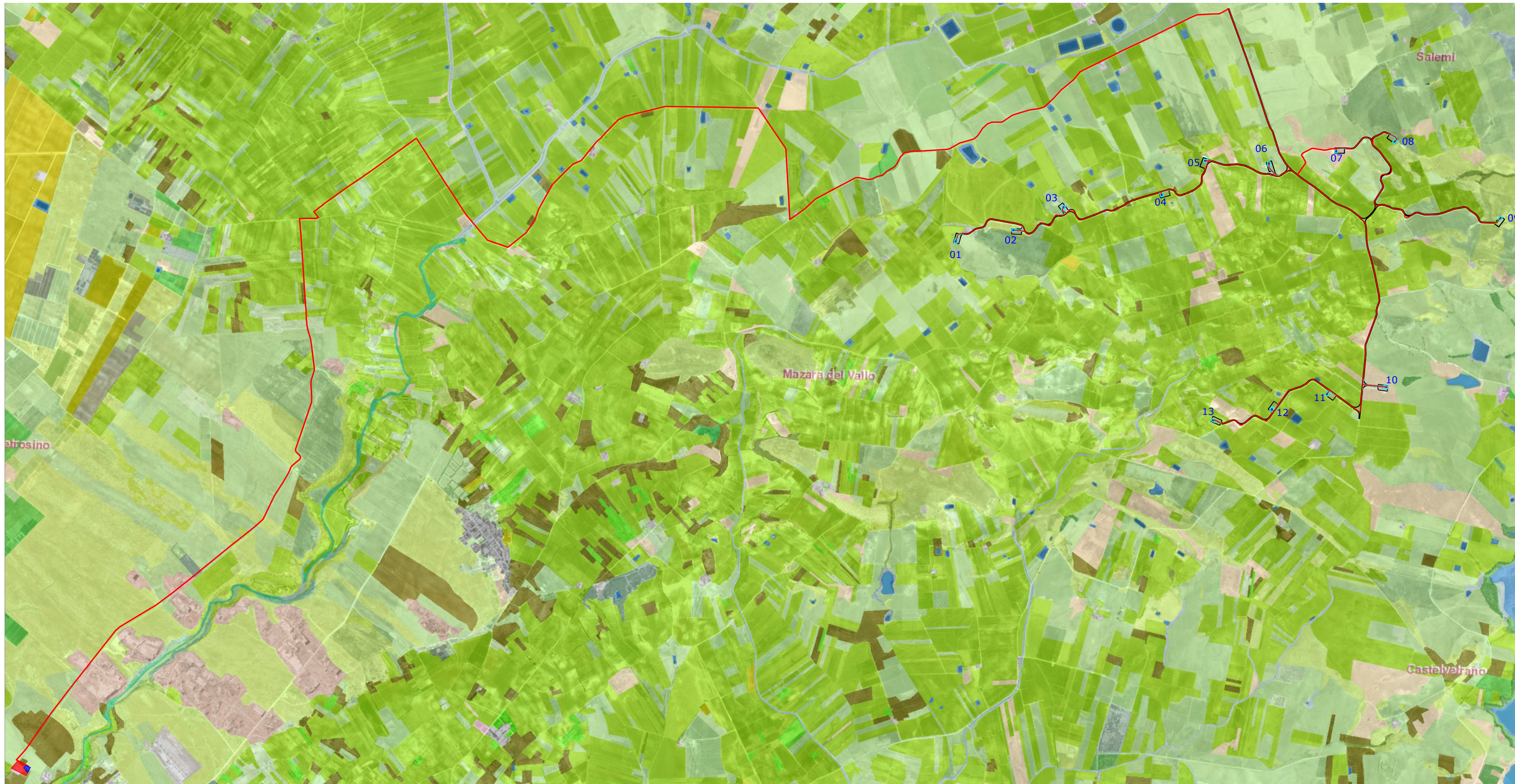
Planimetria Generale - scala 1:25.000