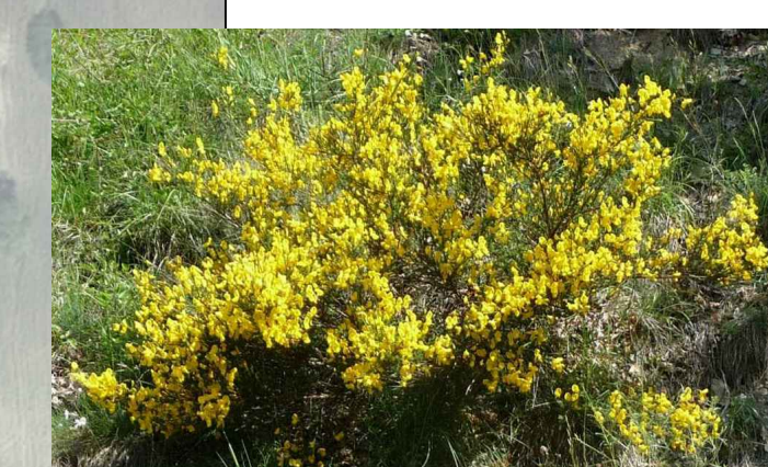
Cytisus scoparius - Ginestra dei Carbonai