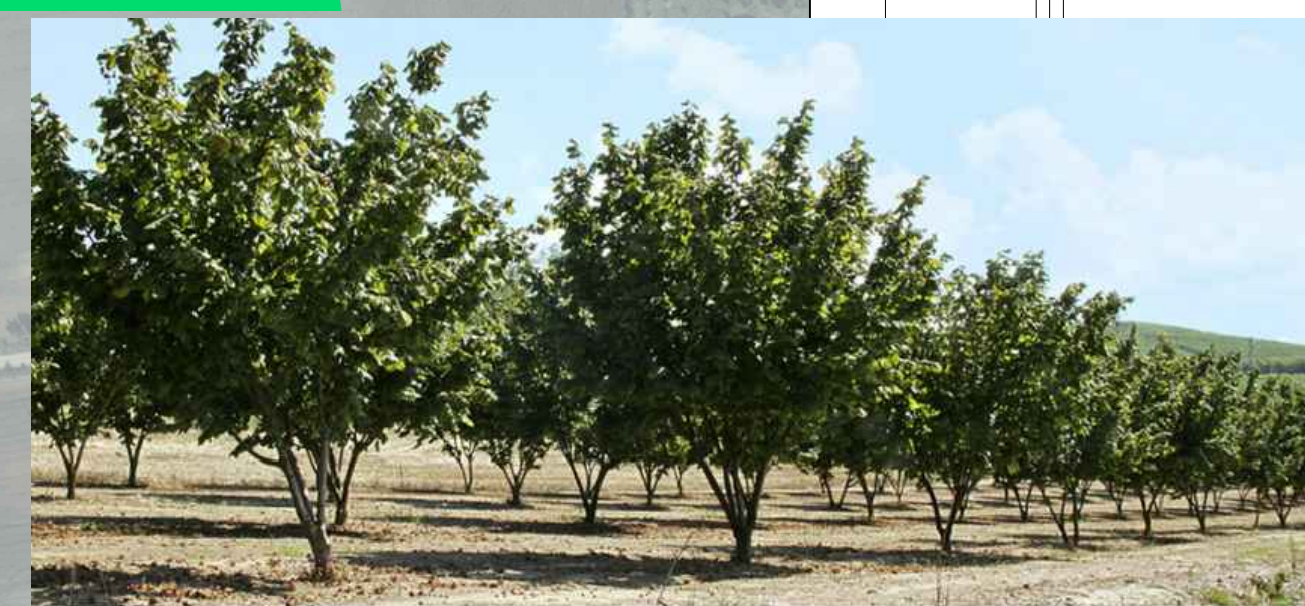
Corylus avellana - Nocciolo

Esempi di Piante - Arbusti - individuate per la realizzazione di interventi di Mitigazione/Compensazione Naturalistica