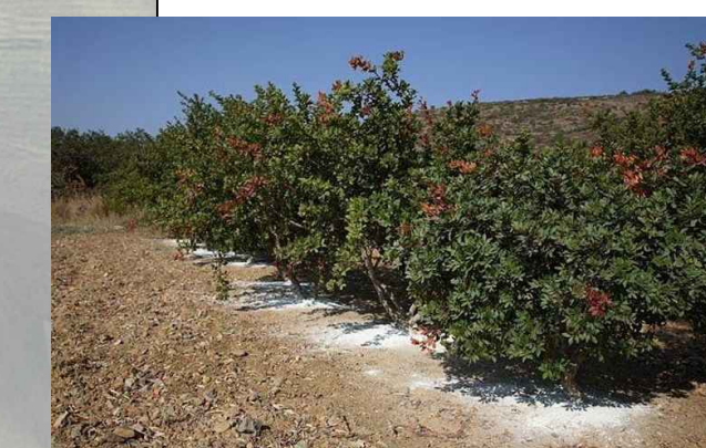
Pistacia lentiscus L. - Lentisco