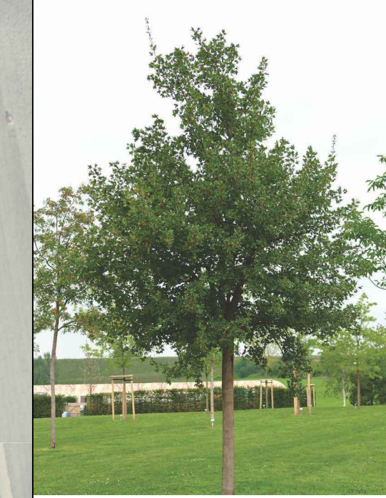
Acer monspessulanum L. - Acero minore