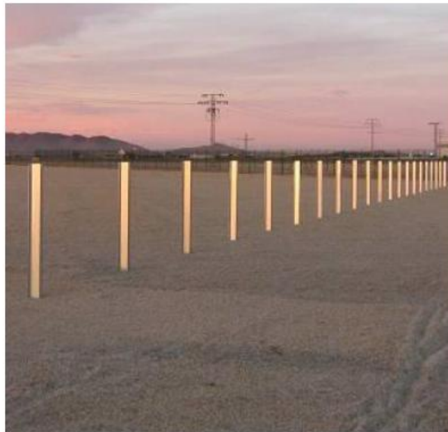
Fig.3 I pali di fondazione vengono infissi nel terreno e saranno estratti con estrema facilità e rapidità grazie all'utilizzo di mezzi appositamente progettati.