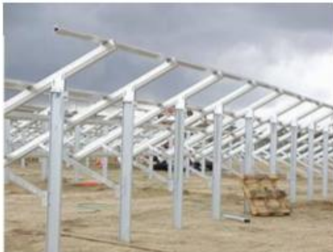
Fig. 2 Strutture di sostegno moduli completamente riciclabile e facilmente estraibili dal suolo in fase di dismissione.