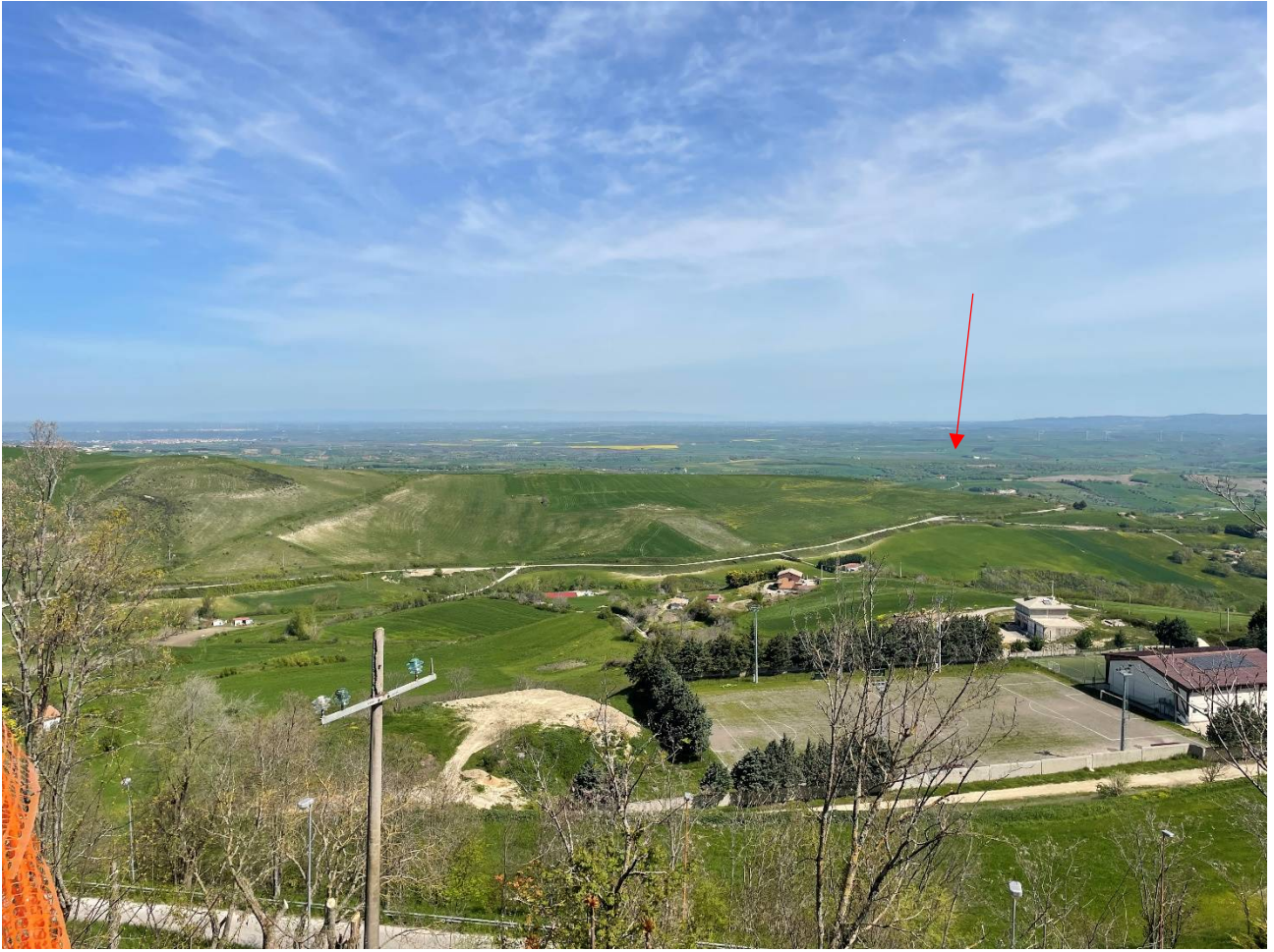
Foto 1. Foto da centro abitato di Forenza. Stato di fatto