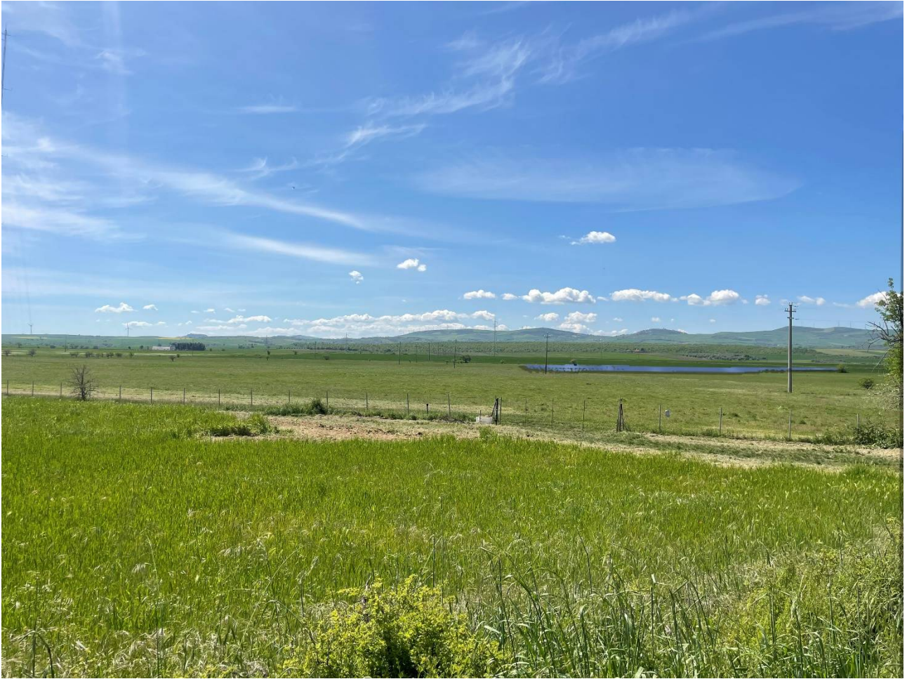
Foto 3. Foto dalla S. P. n. 55 Cerentina e dell'Accio in prossimità di Loggia Dimello. Stato di progetto. Impianto visibile in parte.