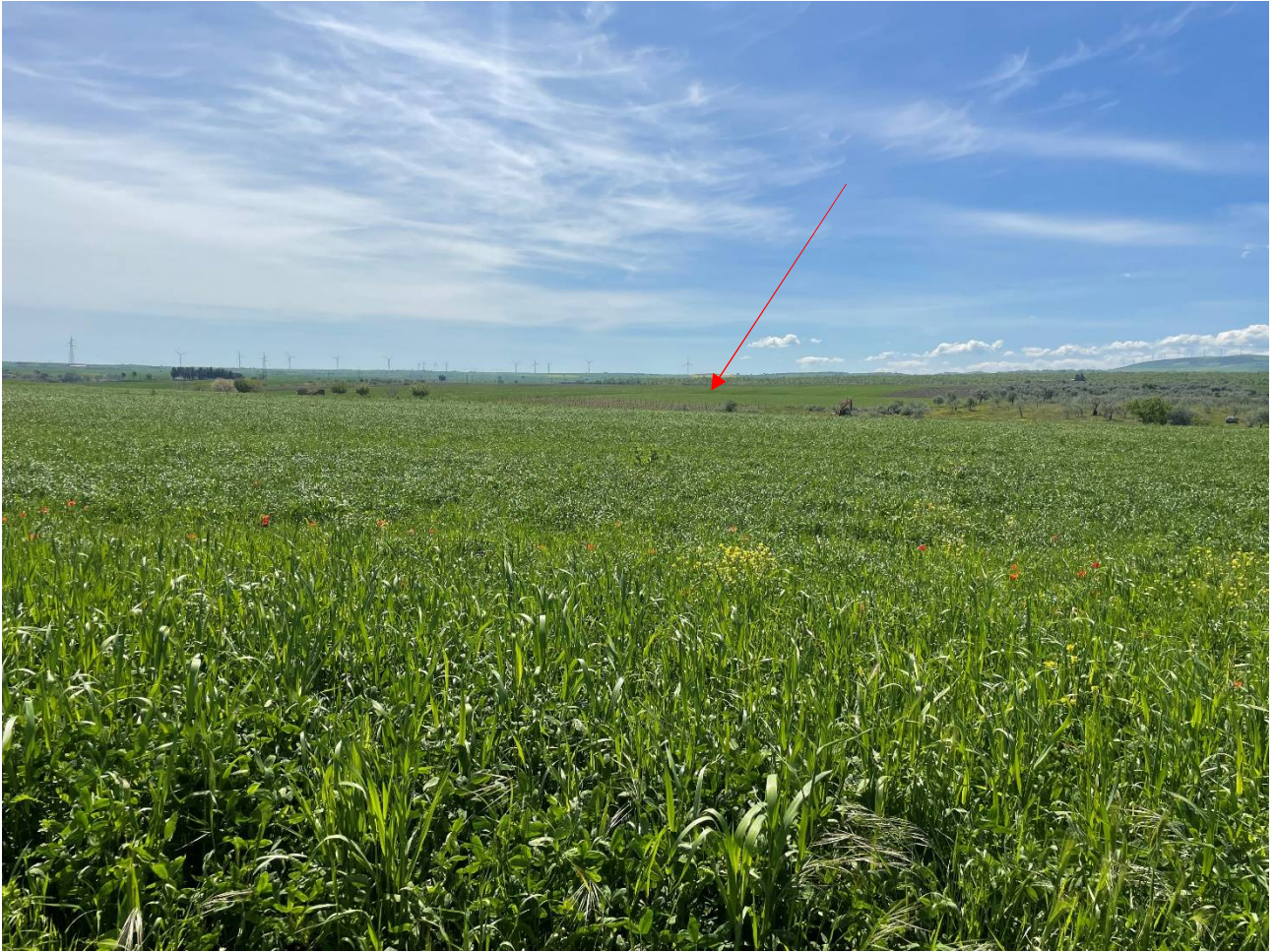
Foto 4. Foto da Da S. P. n. 55 Cerentina e dell'Accio in prossimità della Mass.a F. Grieco. Stato di fatto