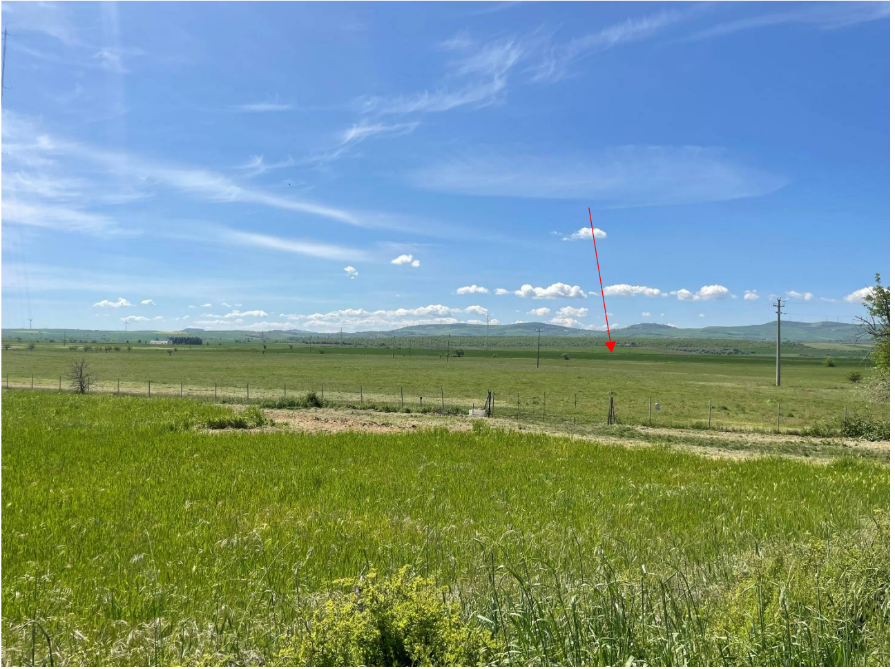
Foto 3. Foto dalla S. P. n. 55 Cerentina e dell'Accio in prossimità di Loggia Dimello. Stato di fatto