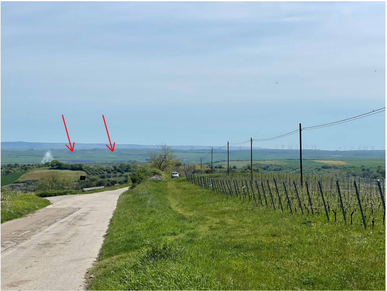
Foto 2. Foto dalla prossimità del centro abitato di Maschito. Stato di progetto. Impianto appena visibile