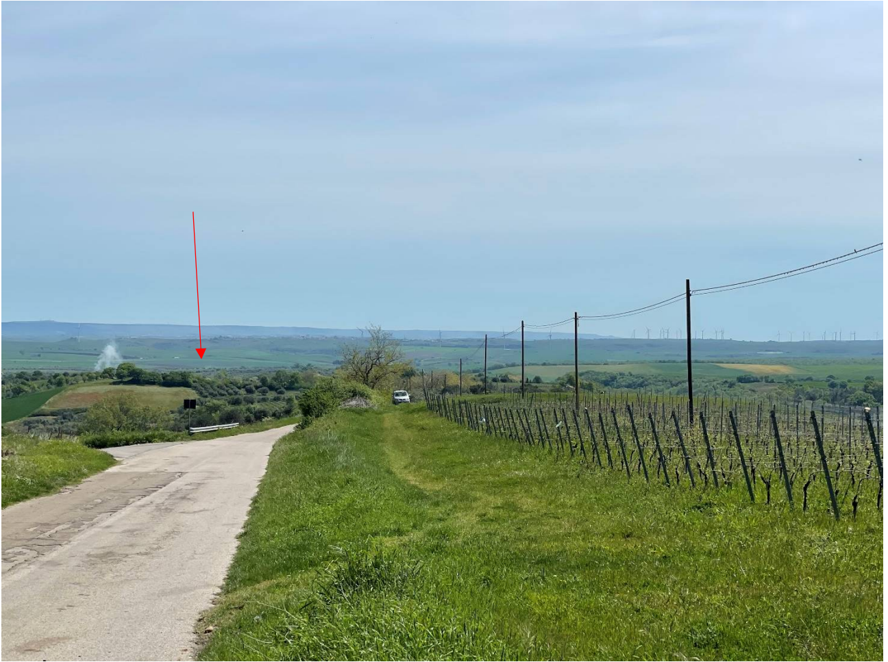
Foto 2. Foto dalla prossimità del centro abitato di Maschito. Stato di fatto