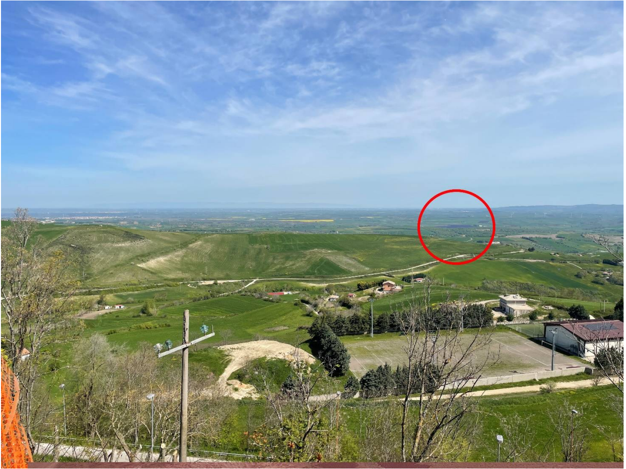
Foto 1. Foto da centro abitato di Forenza. Stato di progetto. Impianto appena visibile