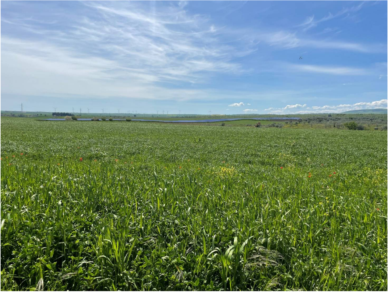
Foto 4. Foto da Da S. P. n. 55 Cerentina e dell'Accio in prossimità della Mass.a F. Grieco. Stato di progetto. Impianto visibile.