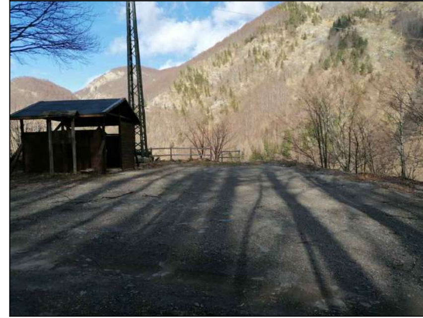
Punto di scatto 2 - Area di cantiere