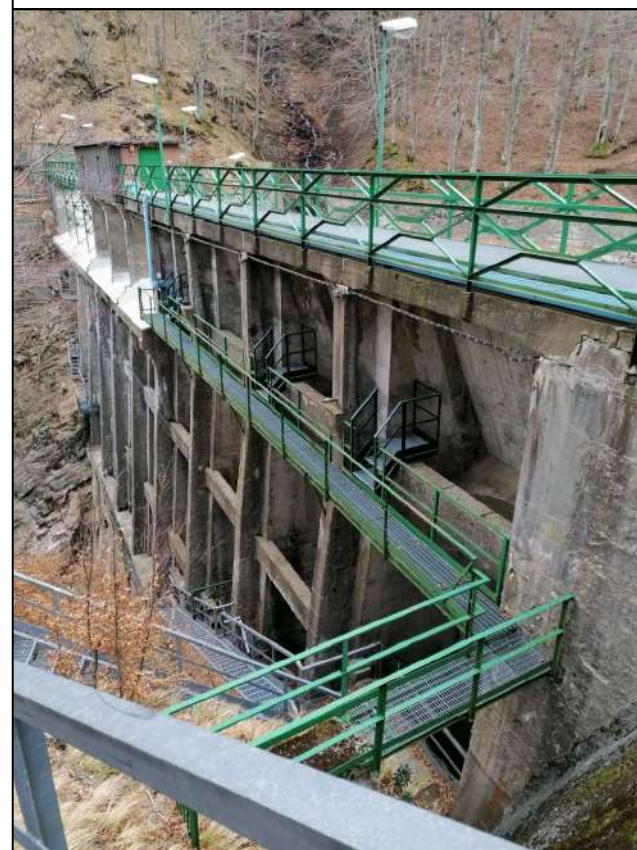
Punto di scatto 5 - Paramento di valle della diga