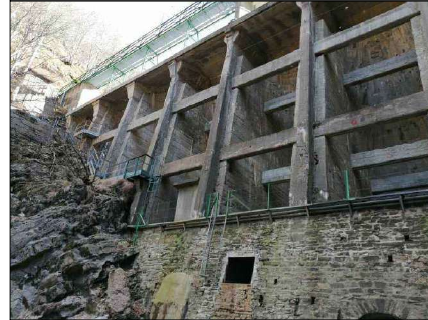
Punto di scatto 6 - Diga vista da valle (sponda dx)