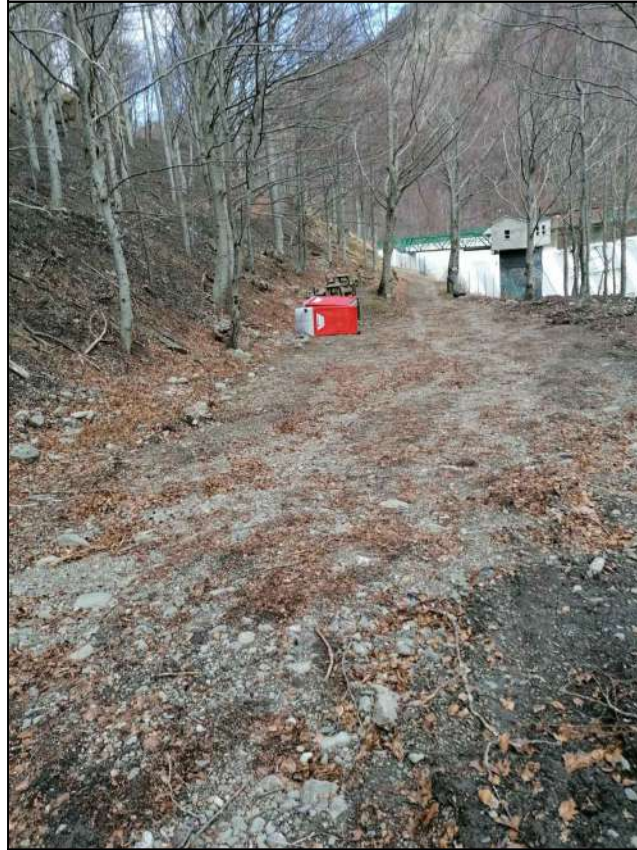
Punto di scatto 1 - Pista di accesso alla diga