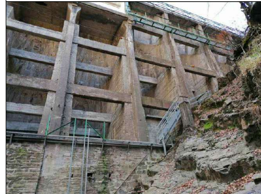
Punto di scatto 7 - Diga vista da valle (sponda sx)