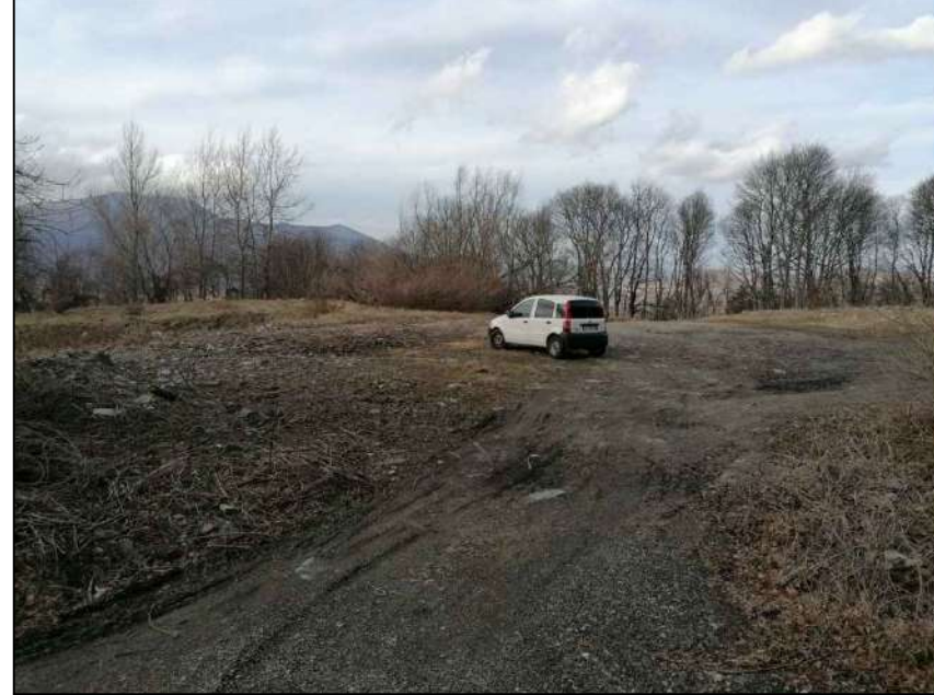
Area di cantiere loc. Il Groppo (in prossimità dell'abitato di Ligonchio)