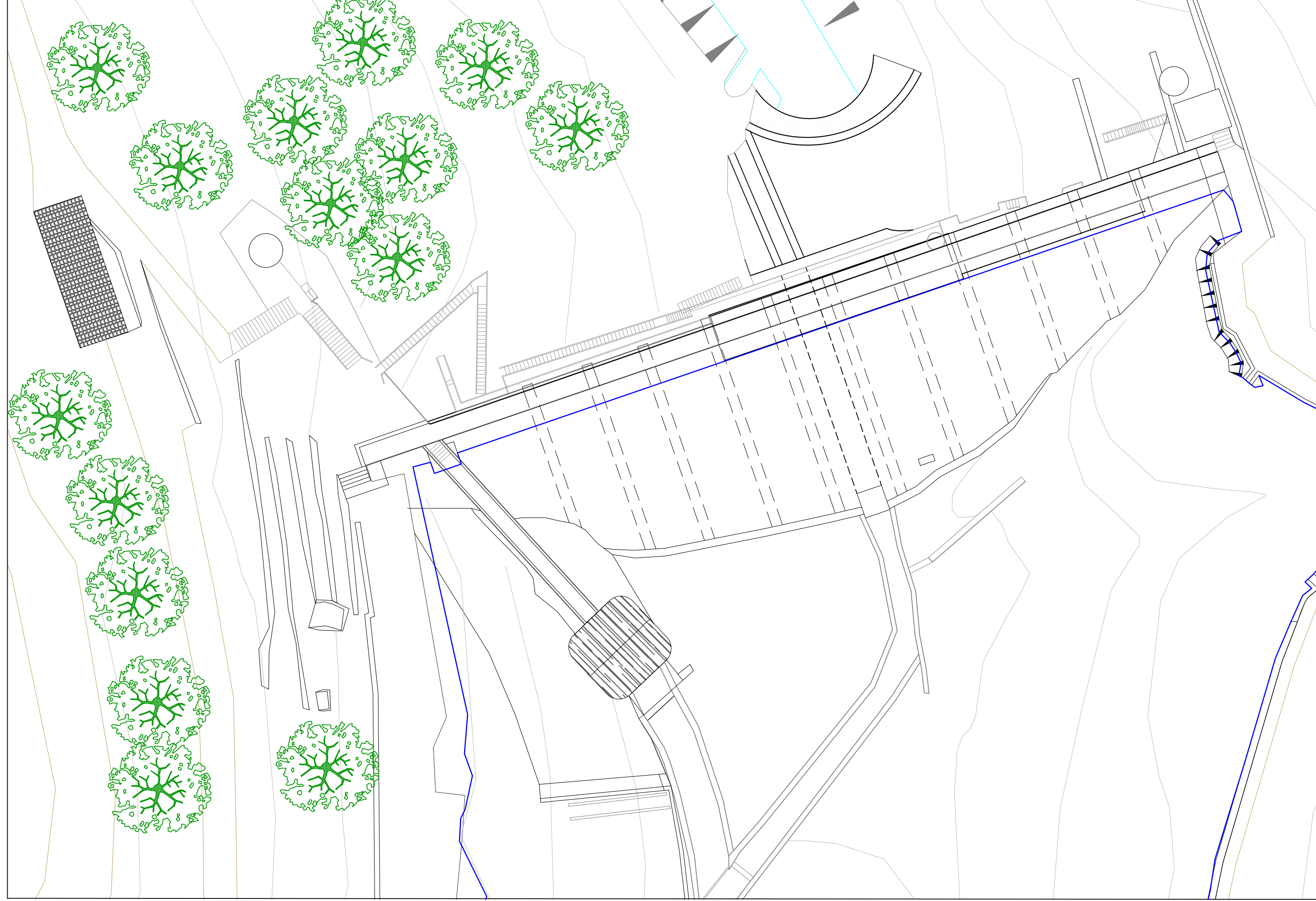
PLANIMETRIA STATO DI FATTO