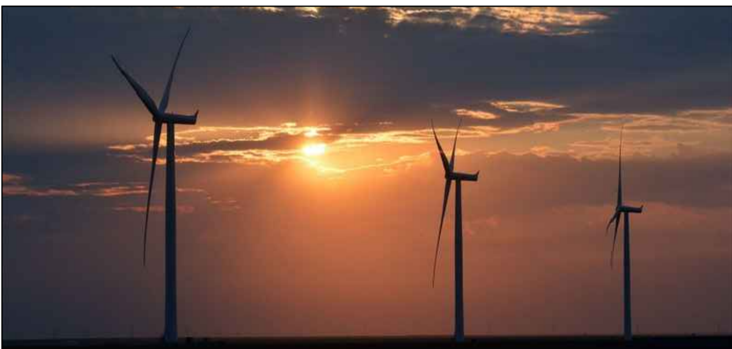
REGIONE BASILICATA - PROVINCIA DI POTENZA - COMUNE DI GARAGUSO E SAN MAURO FORTE

TITOLO DEL PROGETTO PROGETTO DI COSTRUZIONE ED ESERCIZIO DI UN IMPIANTO EOLICO DELLA POTENZA DI 137,20 MWp DA REALIZZARSI NEL COMUNE DI GARAGUSO (MT) E SAN MAURO FORTE (MT), CON LE RELATIVE OPERE DI CONNESSIONE ELETTRICHE DENOMINATO "GARAGUSO"