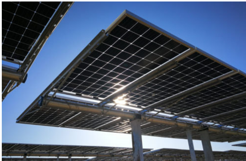
Figura 2.2: Esempio di struttura a tracker monoassiale.

Le struttura utilizzate per il sostegno della fila di moduli in configurazione "portrait" consiste in un sistema ad inseguimento con asse orizzontale, del tipo mostrato in foto.