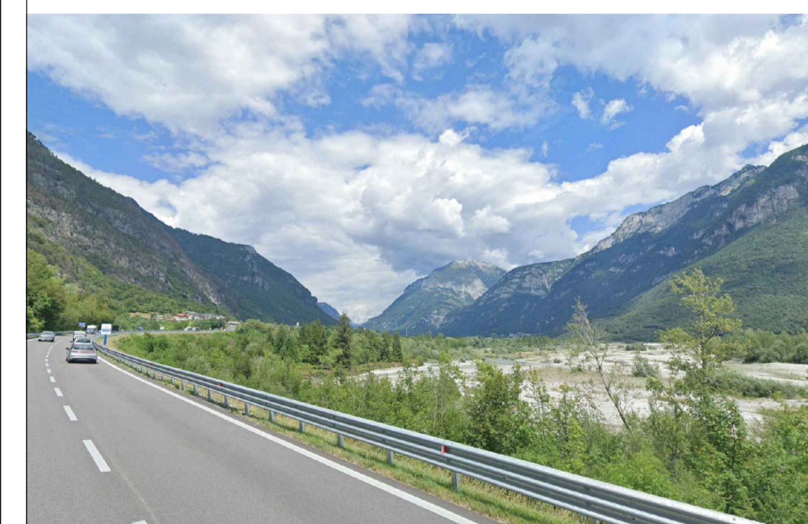
Strada Statale 51 verso Fortogna direzione nord