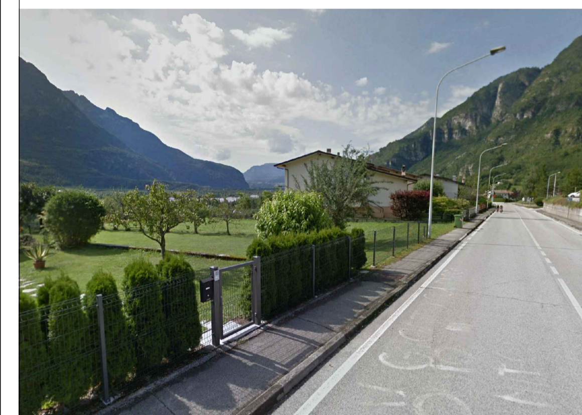
Strada Statale 51 nei pressi del centro abitato di Fortogna, direzione sud