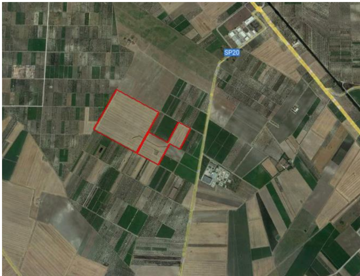
Figura 2.1: Localizzazione dell'area d'intervento. In rosso le sottoaree di progetto.

L'area di progetto presenta un'estensione complessiva catastale pari a circa 30,78 ettari ed un'area recintata pari a 27,69 ettari.