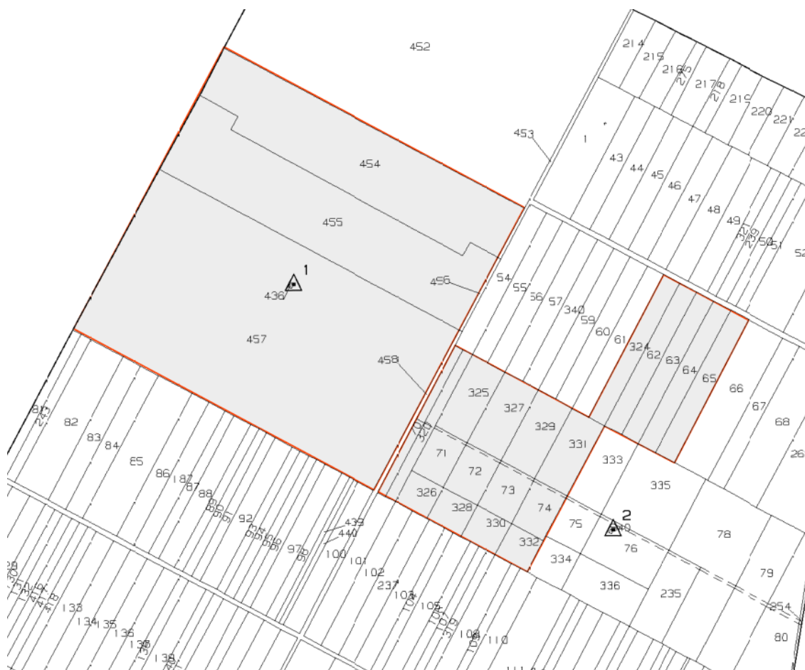
Figura 2.2: Inquadramento catastale area impianto

Si riporta di seguito uno stralcio dell'inquadramento catastale Rif. "2748_5286_SSPAL_PD_T07_Rev0_Inquadramento Catastale Impianto".