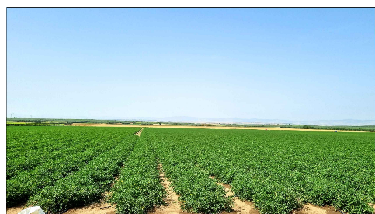
FOTOINSERIMENTO 1 - STATO DI FATTO