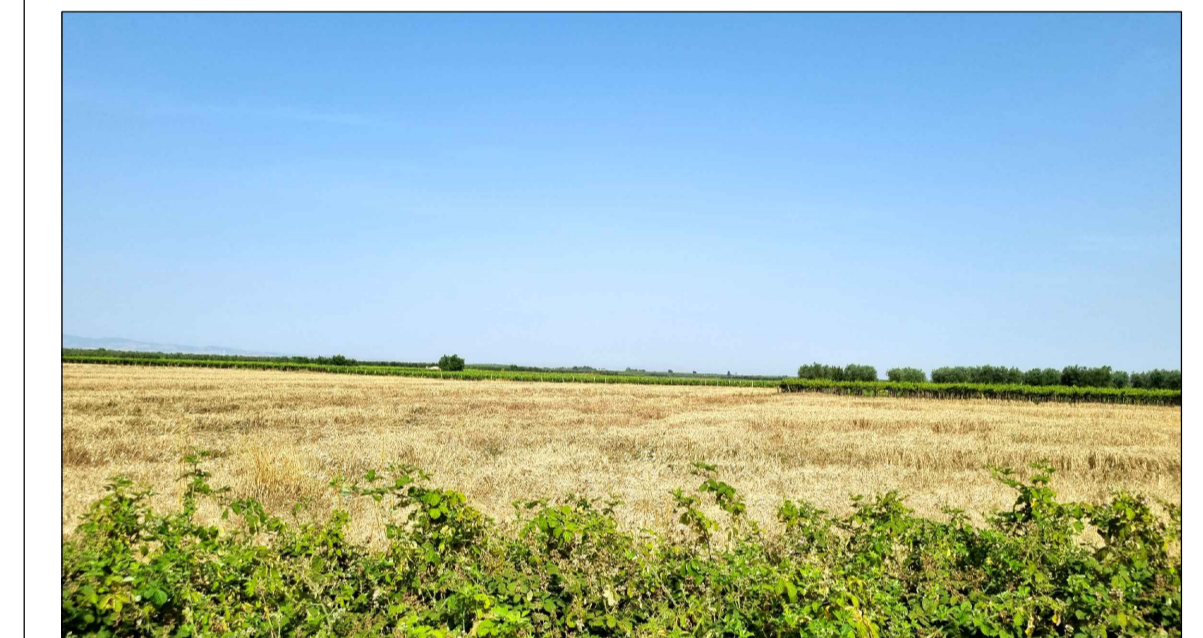
FOTOINSERIMENTO 2 - STATO DI FATTO