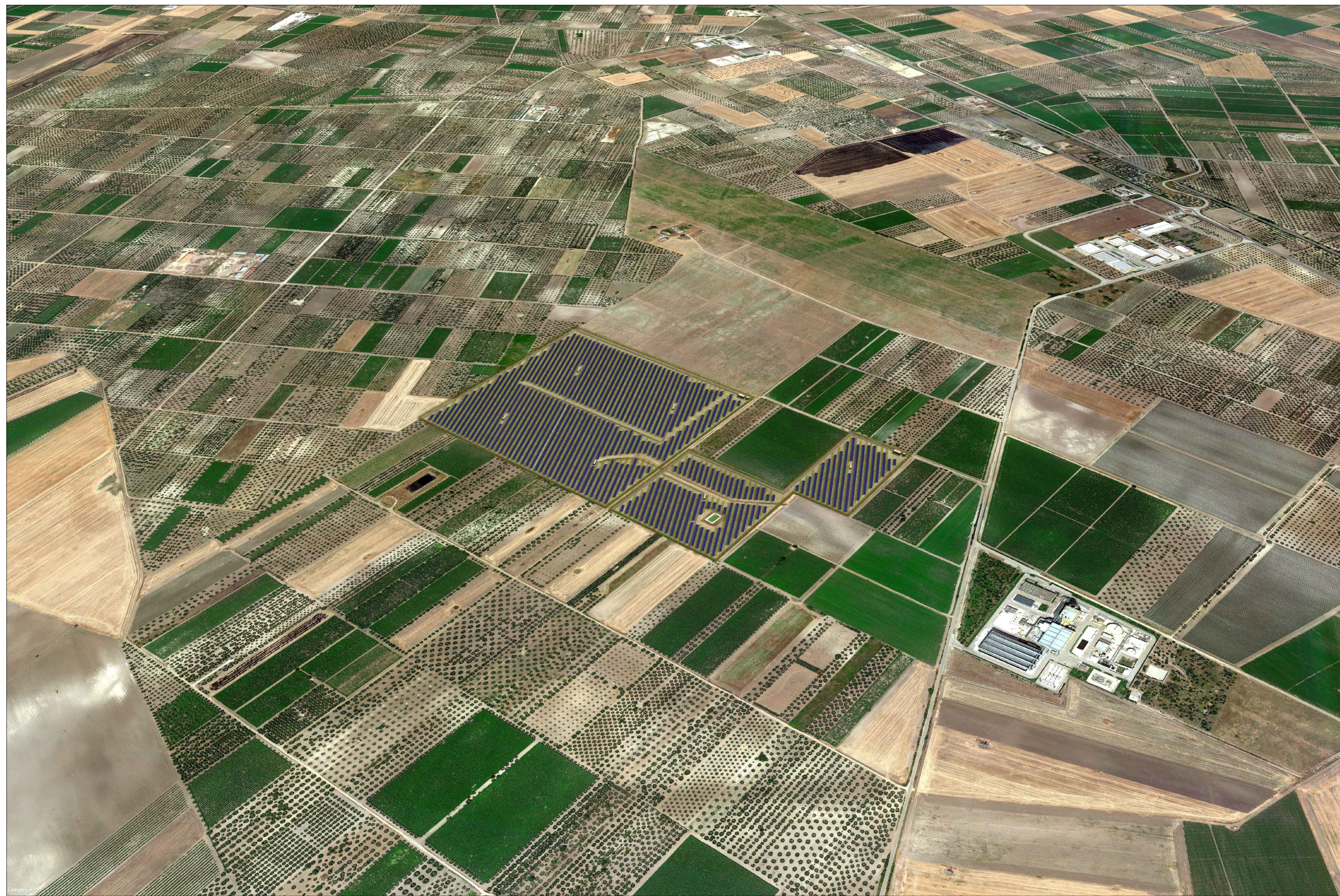
VISTA AEREA - STATO DI PROGETTO