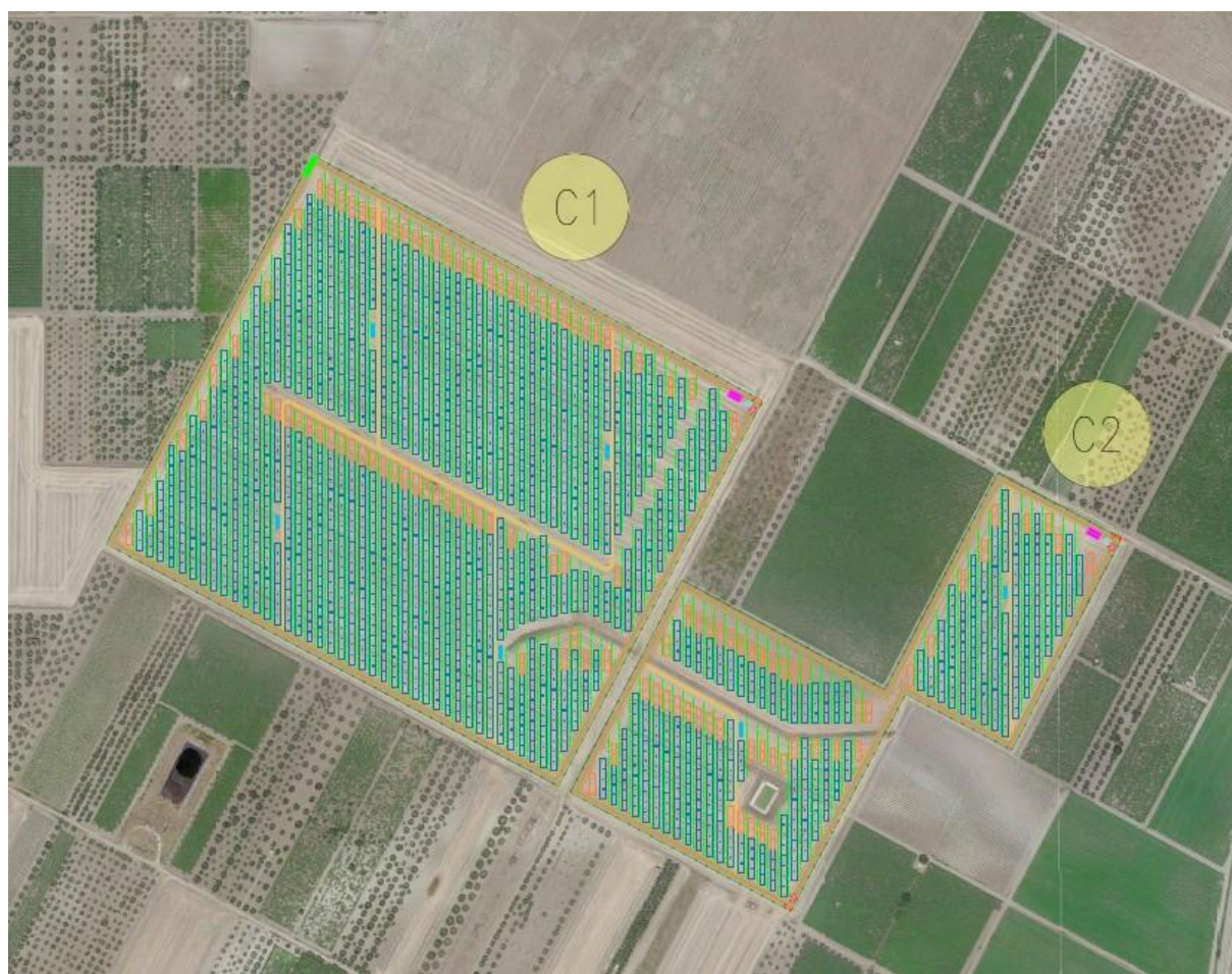
Figura 2.2: Layout di progetto.