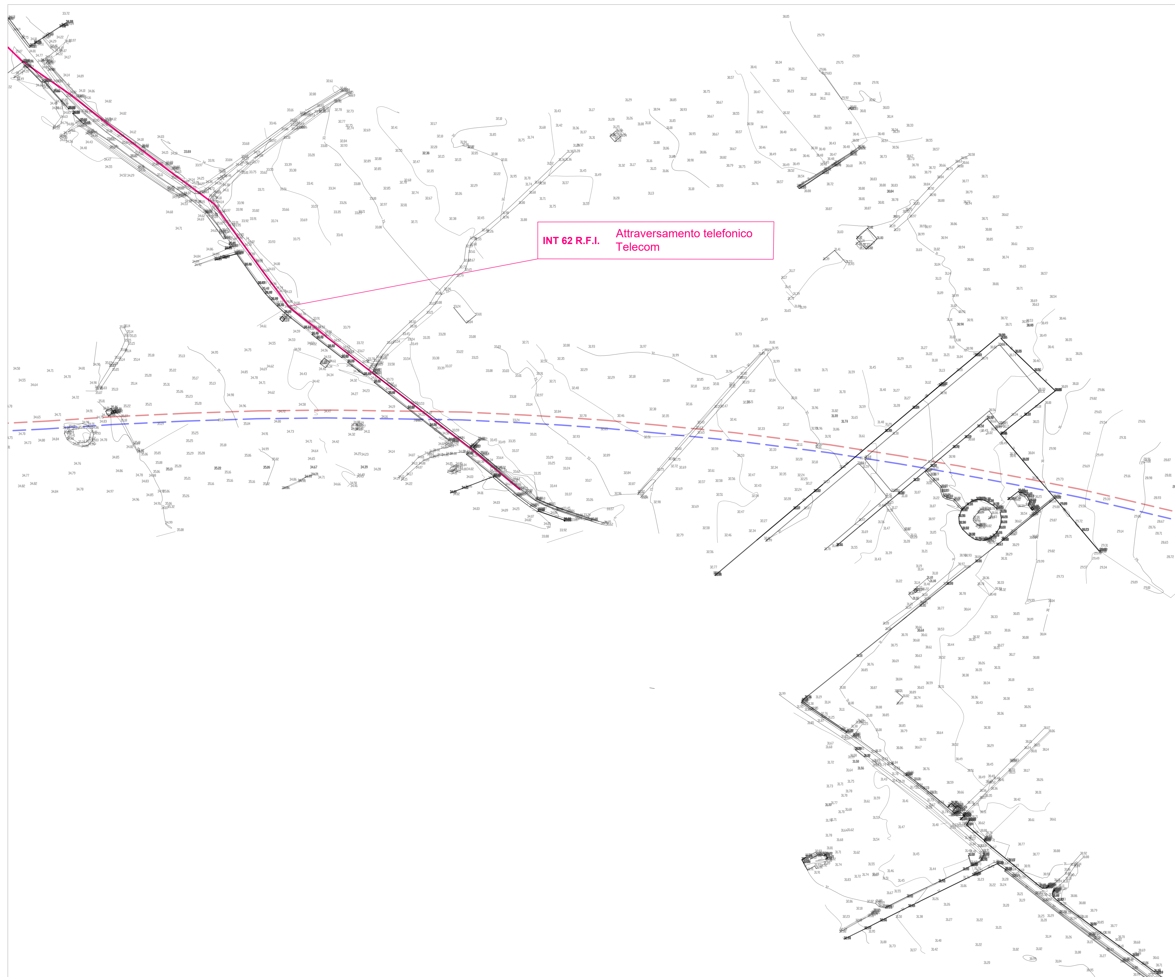
Planimetria d'inquadramento su rilievo celerimetrico scala 1:1000