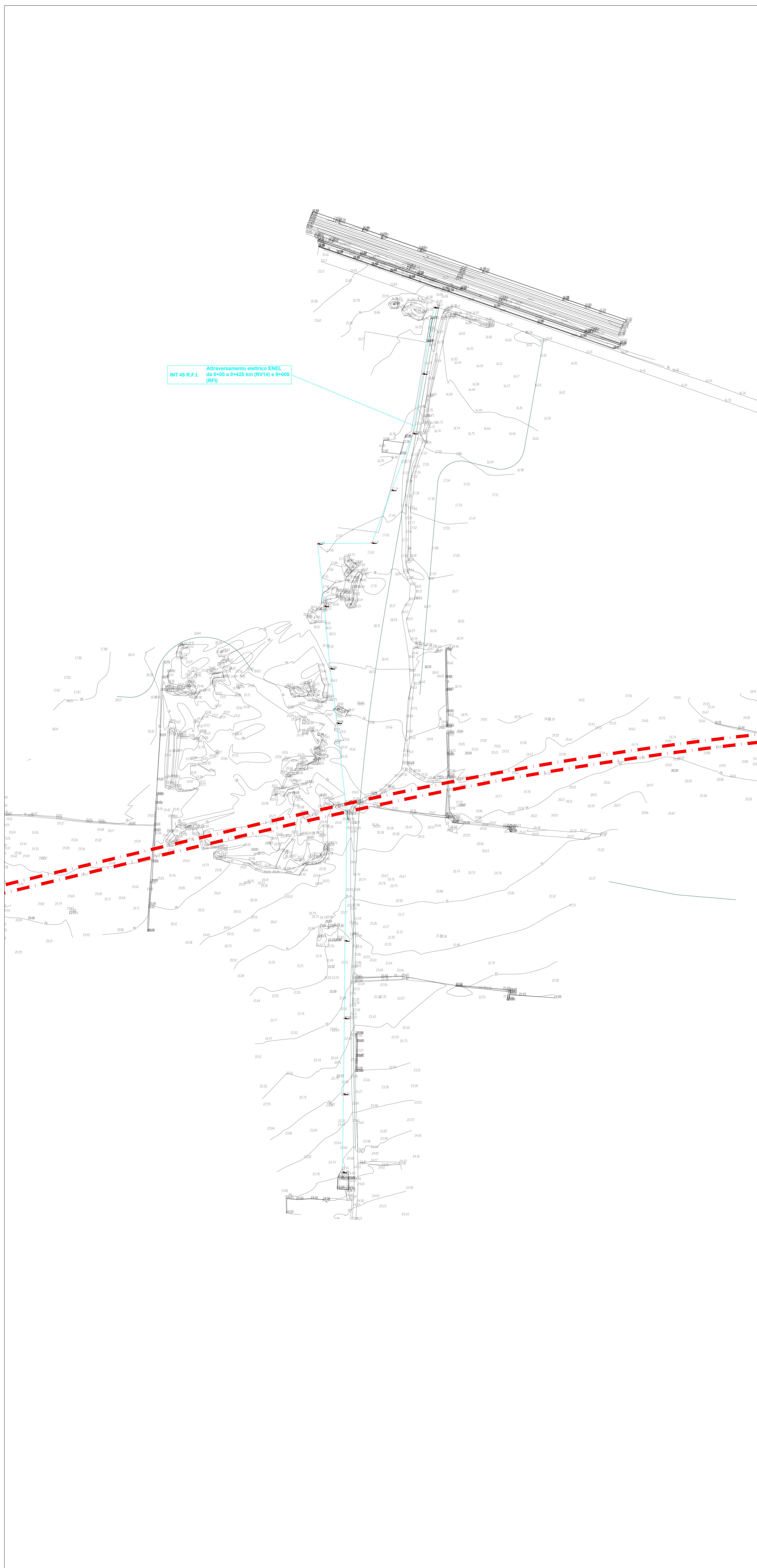
Planimetria d'inquadramento su rilievo celerimetrico in scala 1:1000