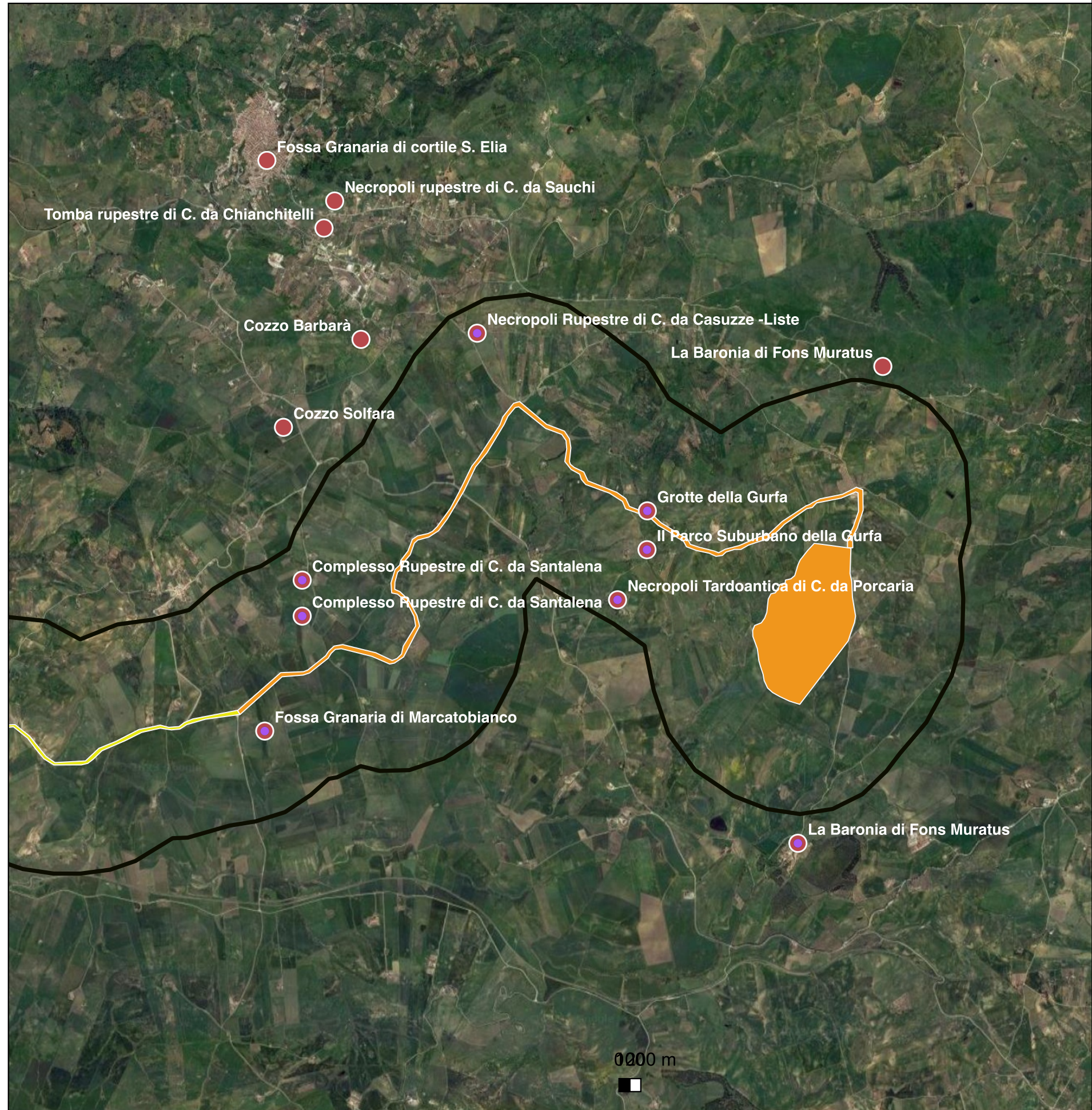
TABELLA 1 - POTENZIALE ARCHEOLOGICO

Il contesto si presenta ricchissimo di siti di interesse storico-archeologico. Il potenziale dell'area, pertanto, è elevato. Prevale su tutto lo sfruttamento del banco geopedologico sia in epoca preistorica che in età tardoantica