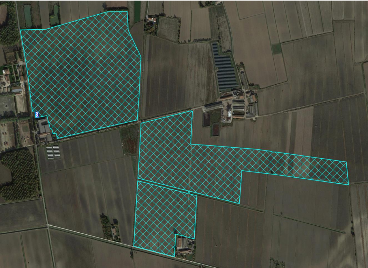
Ortofoto con individuazione area impianto agrifotovoltaico