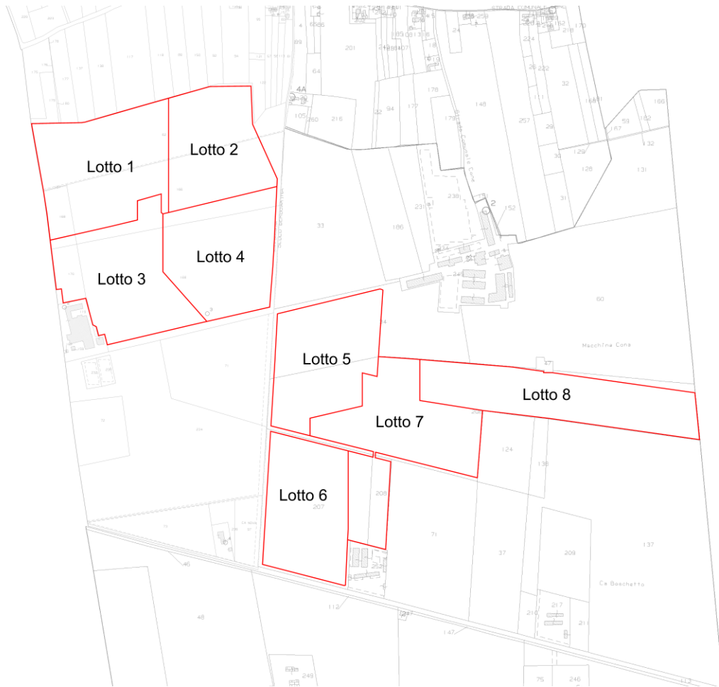
Estratto mappa catastale con individuazione area