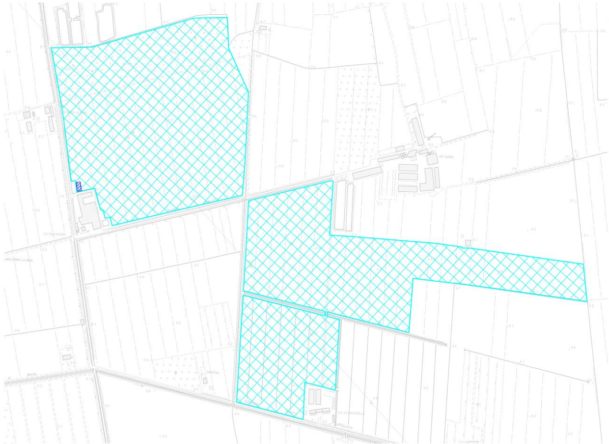
Estratto CTR con individuazione area