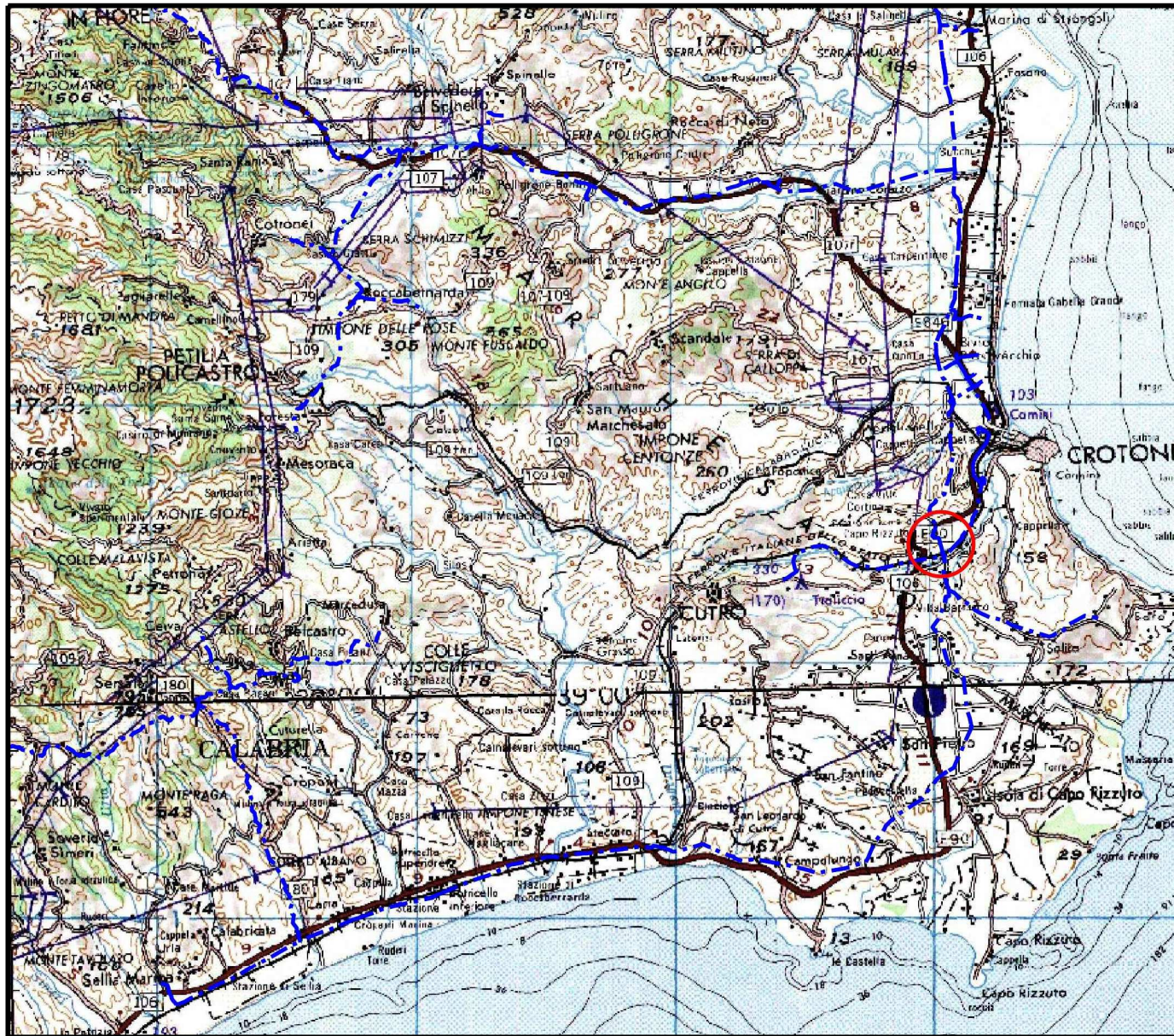
COROGRAFIA Scala 1:250.000

Il presente disegno e' di proprieta' aziendale - La Societa' tutelera' i propri diritti a termine di legge.