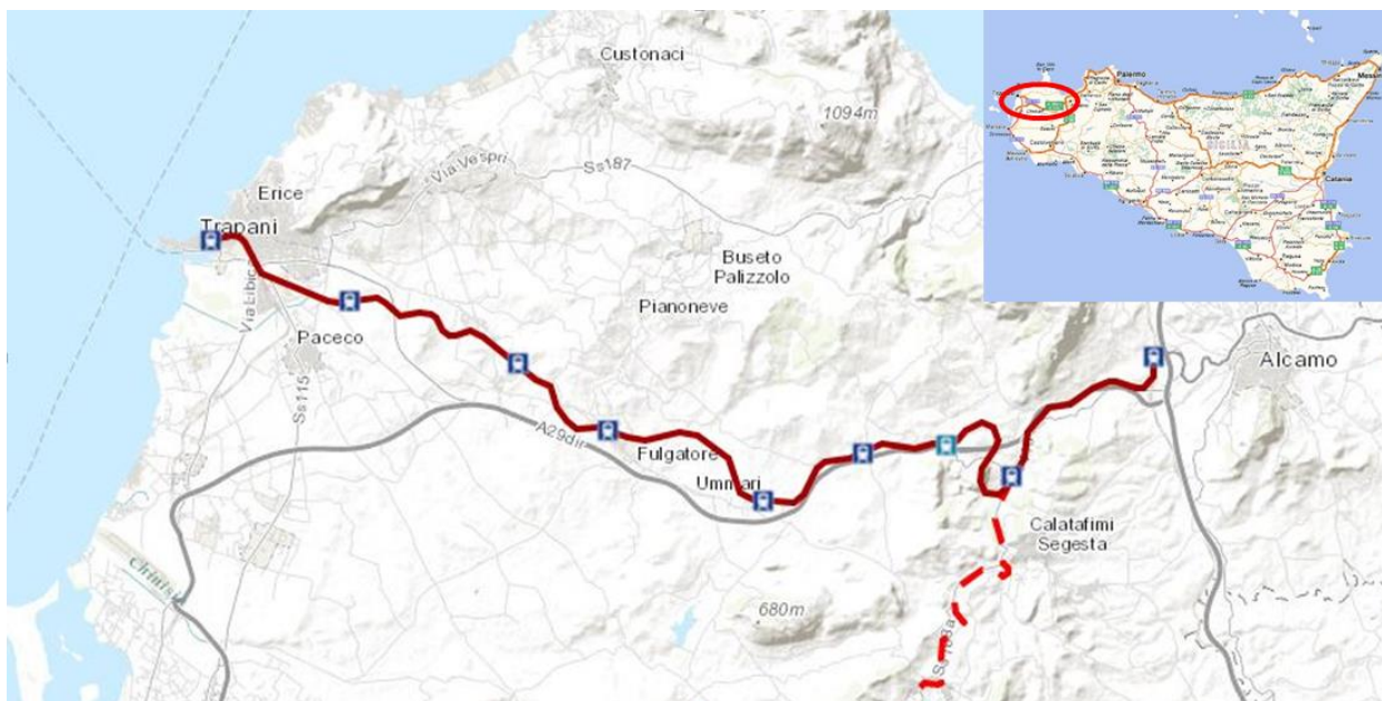
Inquadramento territoriale della linea oggetto d'intervento