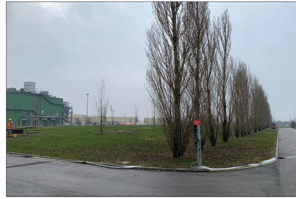
8-VISTA AREA DI INSTALLAZIONE CABINATO ELCO