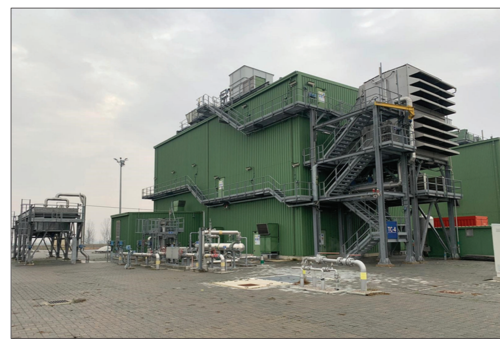
5-VISTA DEL TC-4