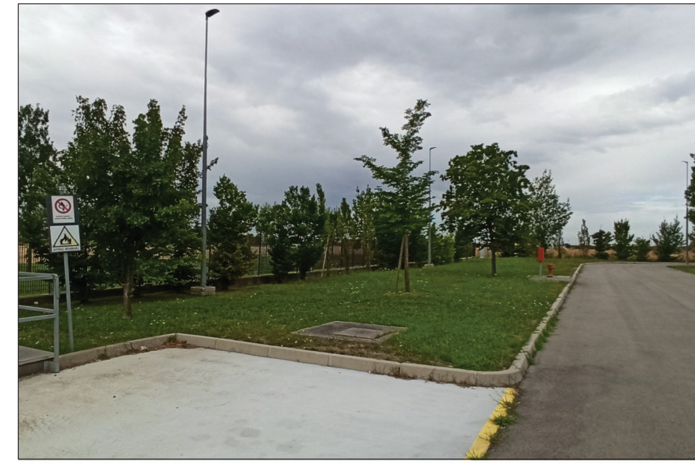
6-VISTA AREA DI INSTALLAZIONE FABBRICATO MEDIA TENSIONE