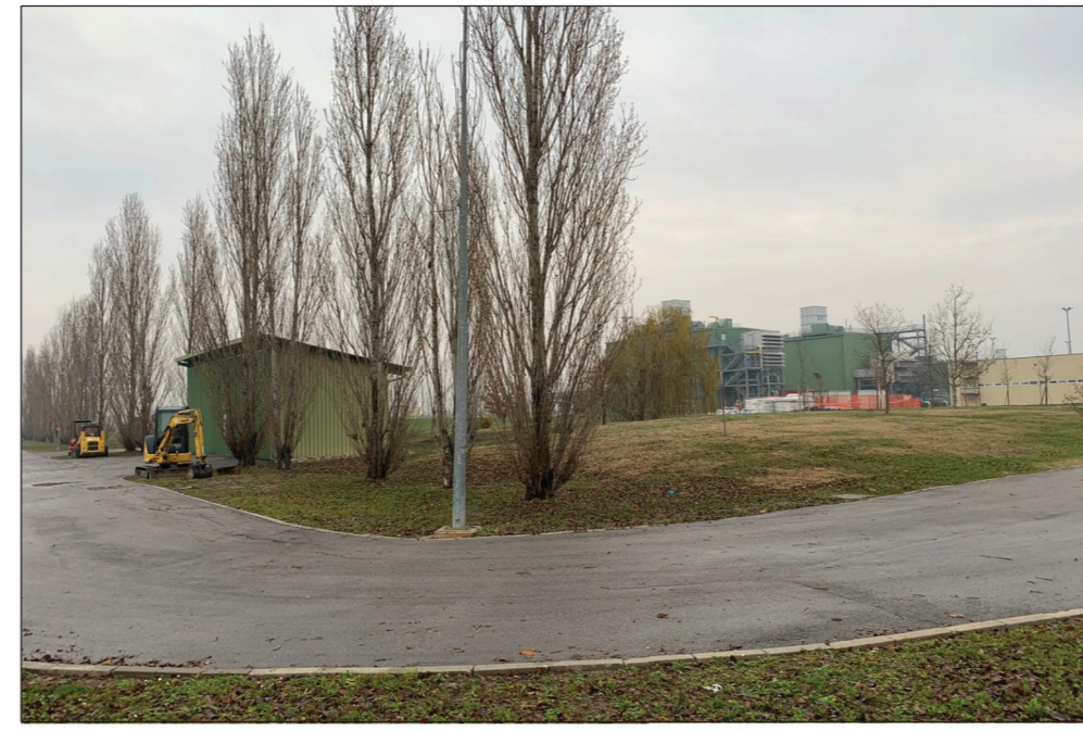
9-VISTA AREA DI INSTALLAZIONE FABBR. SOTTOSTAZIONE ELCO