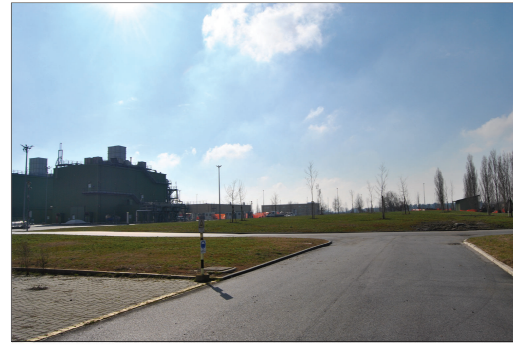
9-VISTA AREA DI INSTALLAZIONE CABINATO ELCO