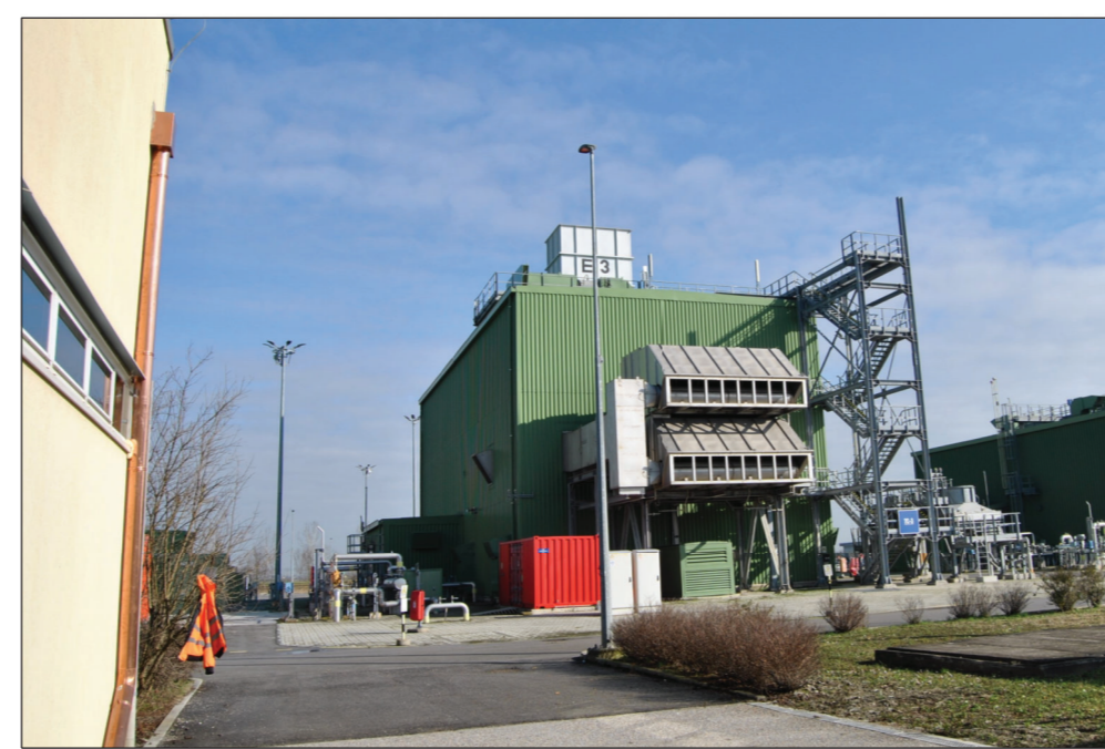
4-VISTA DEL TC-3