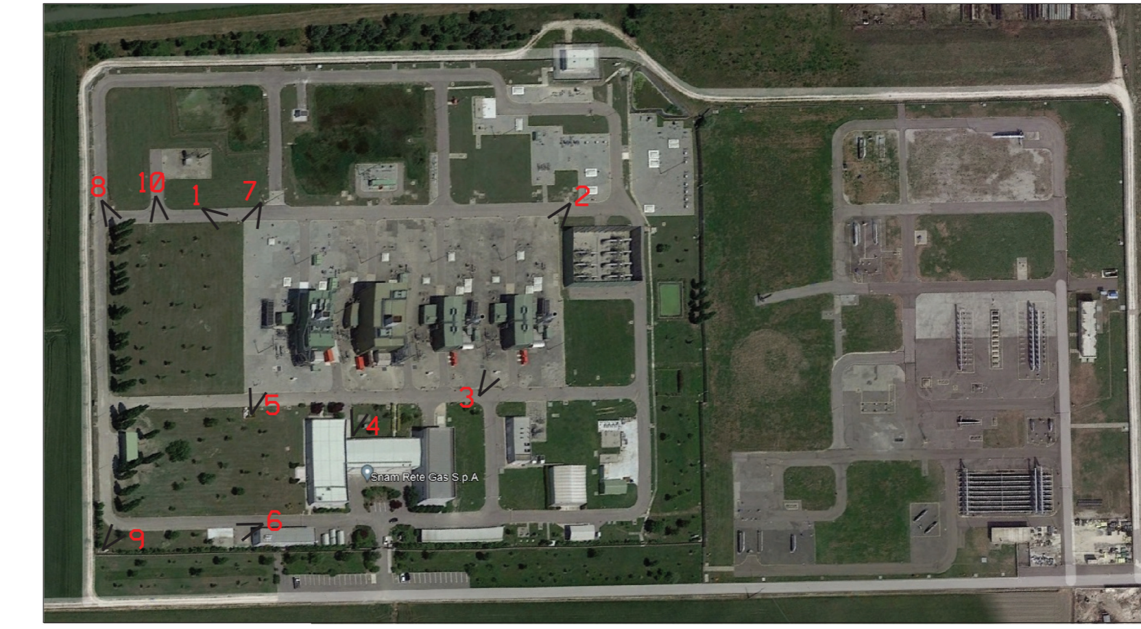
VISTA AEREA STATO DI FATTO