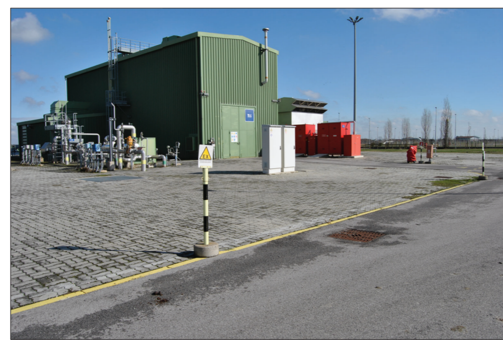
3-VISTA DEL TC-1