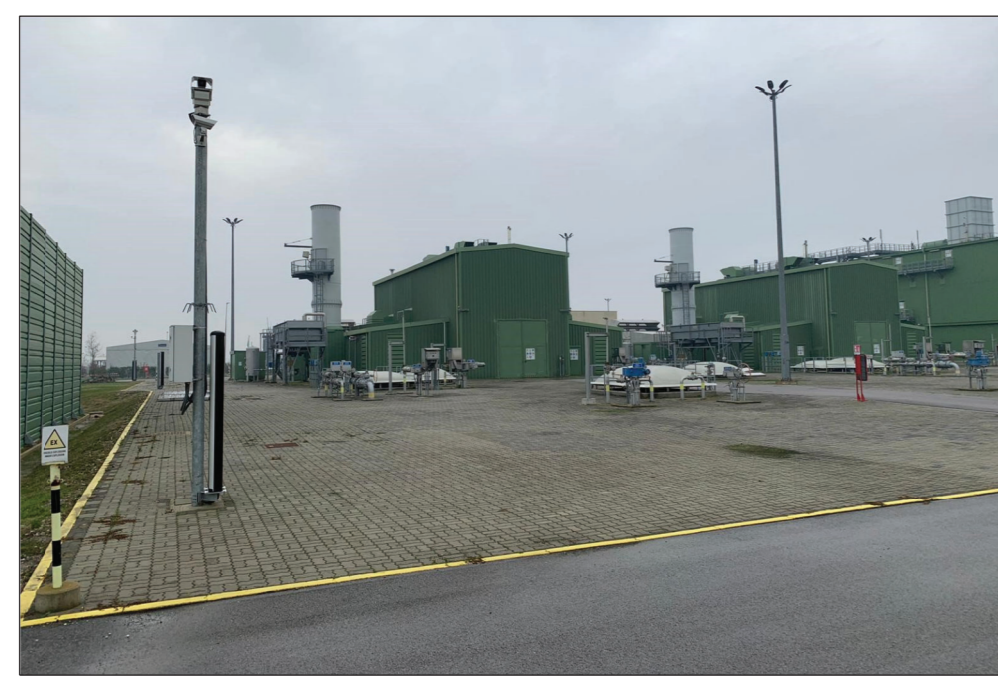
2-VISTA DEL TC-1 E DEL TC-2