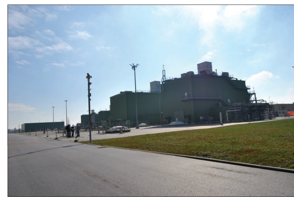
1-VISTA DI INSIEME DEI TURBOCOMPRESSORI ESISTENTI