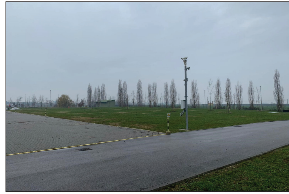
7-VISTA AREA DI INSTALLAZIONE CABINATO ELCO