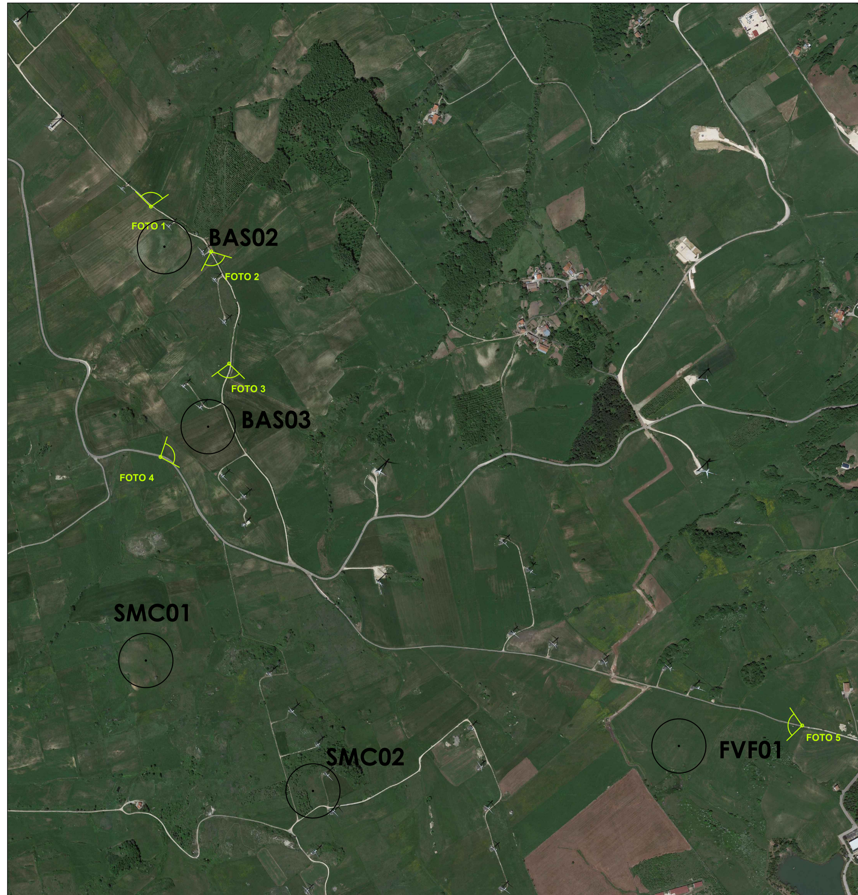
PLANIMETRIA DELL'AREA PRIMA DELL' INTERVENTO CON INDICAZIONE DEI PUNTI DI SCATTO