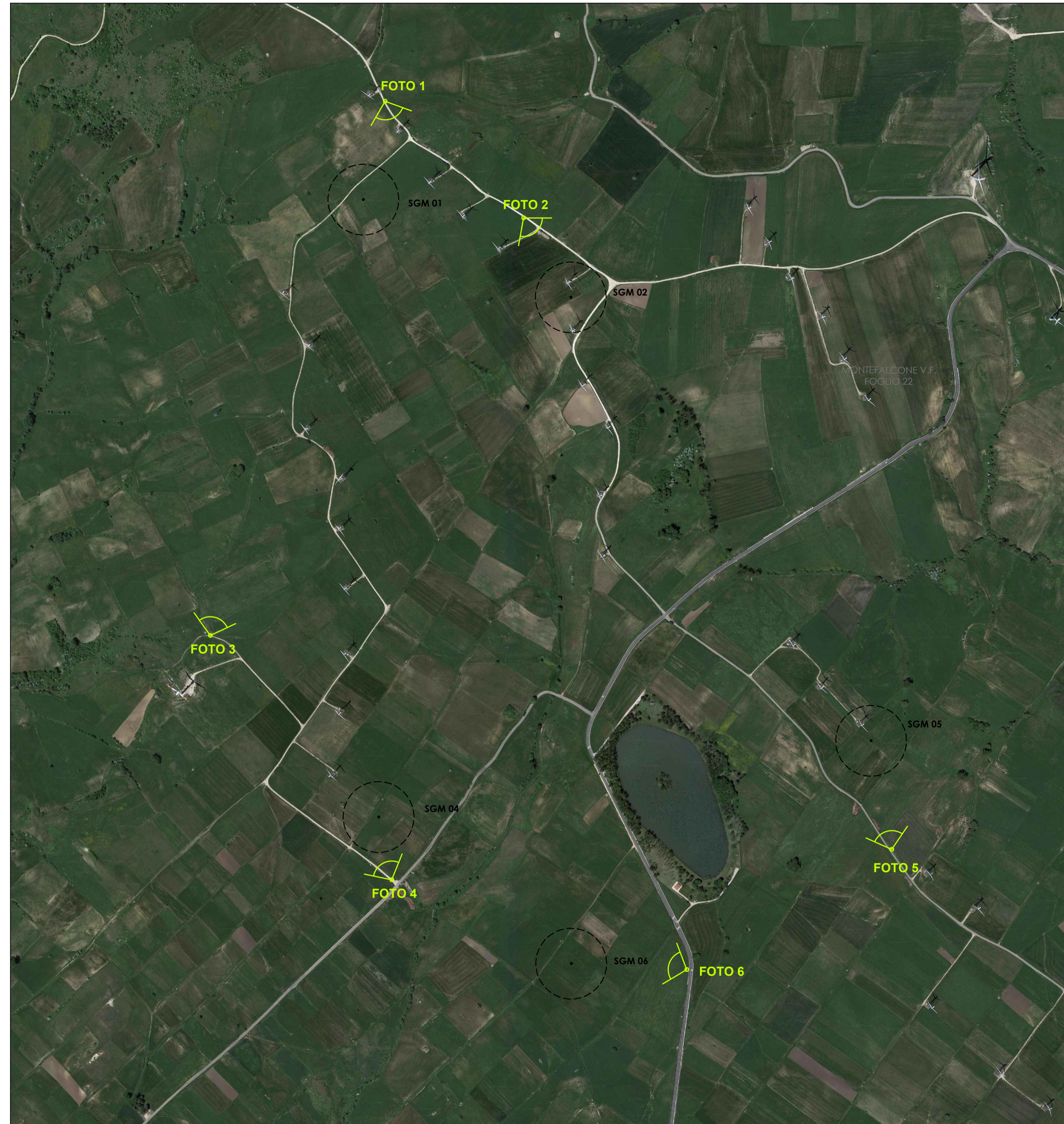
PLANIMETRIA DELL'AREA PRIMA DELL' INTERVENTO CON INDICAZIONE DEI PUNTI DI SCATTO