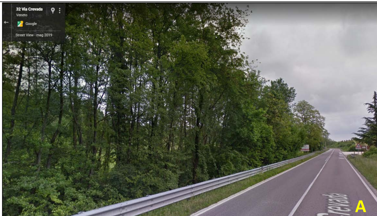
Dopo dell'intervento di disboscamento della sponda dx