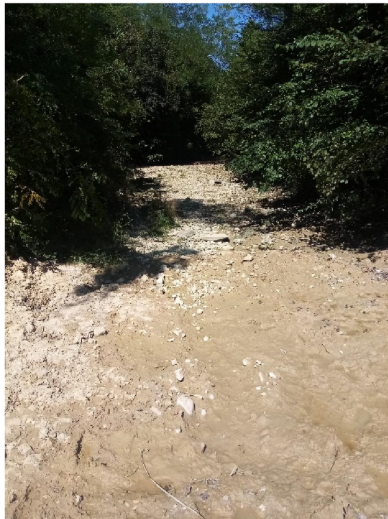
Torrente Lierza a monte dell'attraversamento