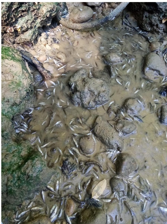
Foto a valle dell'attraversamento: pesci, in gran parte ancora vivi, annaspanti nel fango