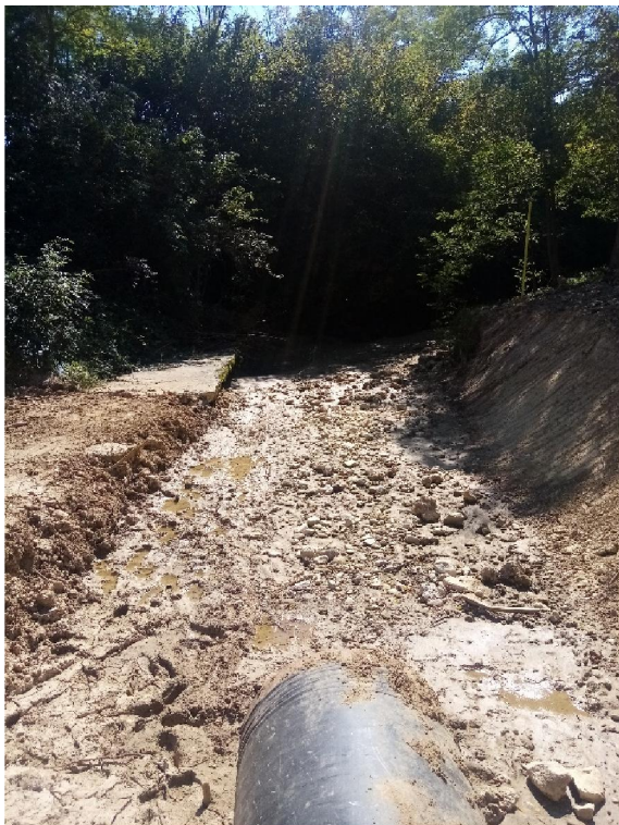
Torrente Lierza a valle dell'attraversamento

Allego documentazione fotografica corredata da didascalie: