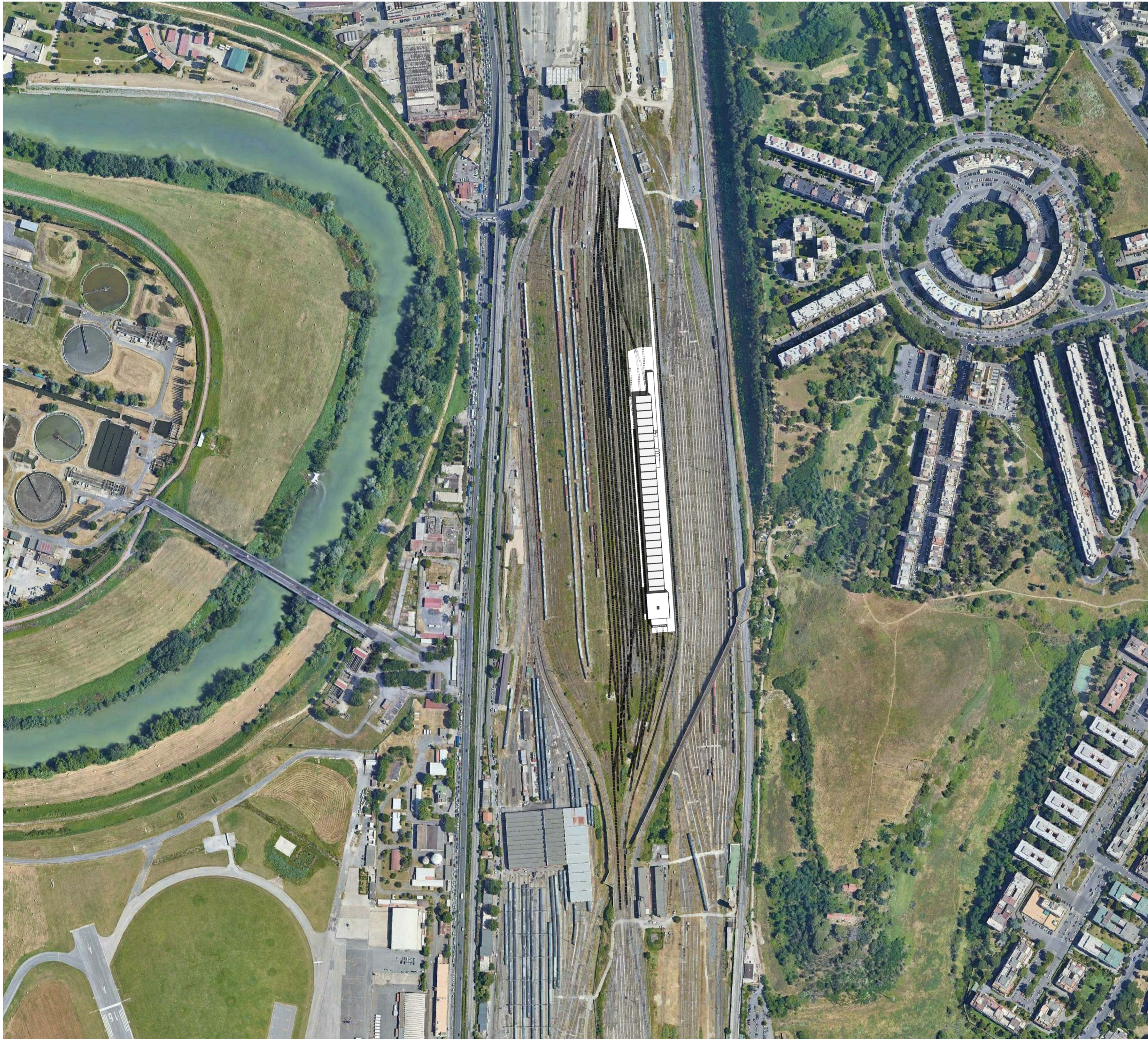
1 Planimetria di inquadramento urbano 1 : 2500