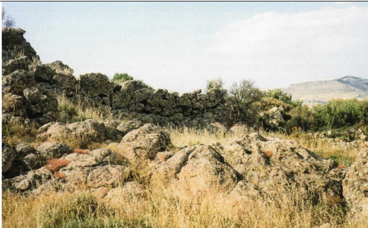
Muraglia di S'Ammuradu