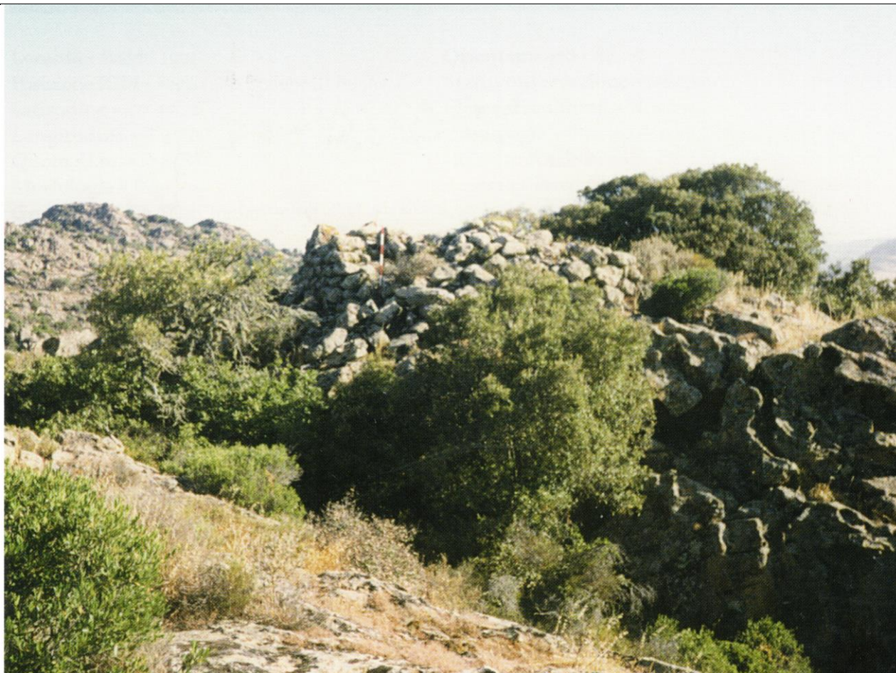
Nuraghe Sa Rocca Luisi (lato sud)