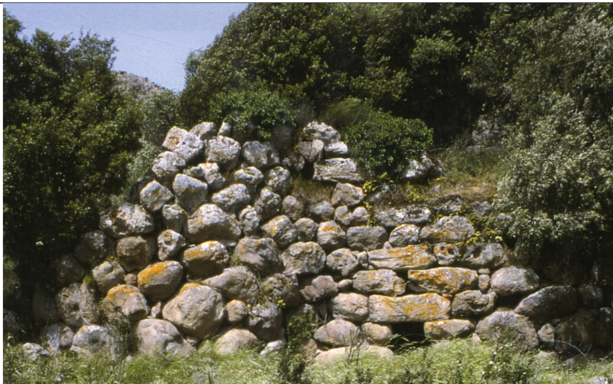
Nuraghe Idda (ingresso al bastione)