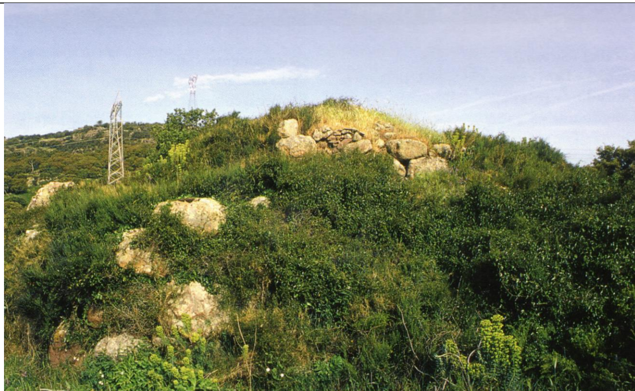
Nuraghe Su Runcu (o Sa Pedra Ruggiu)