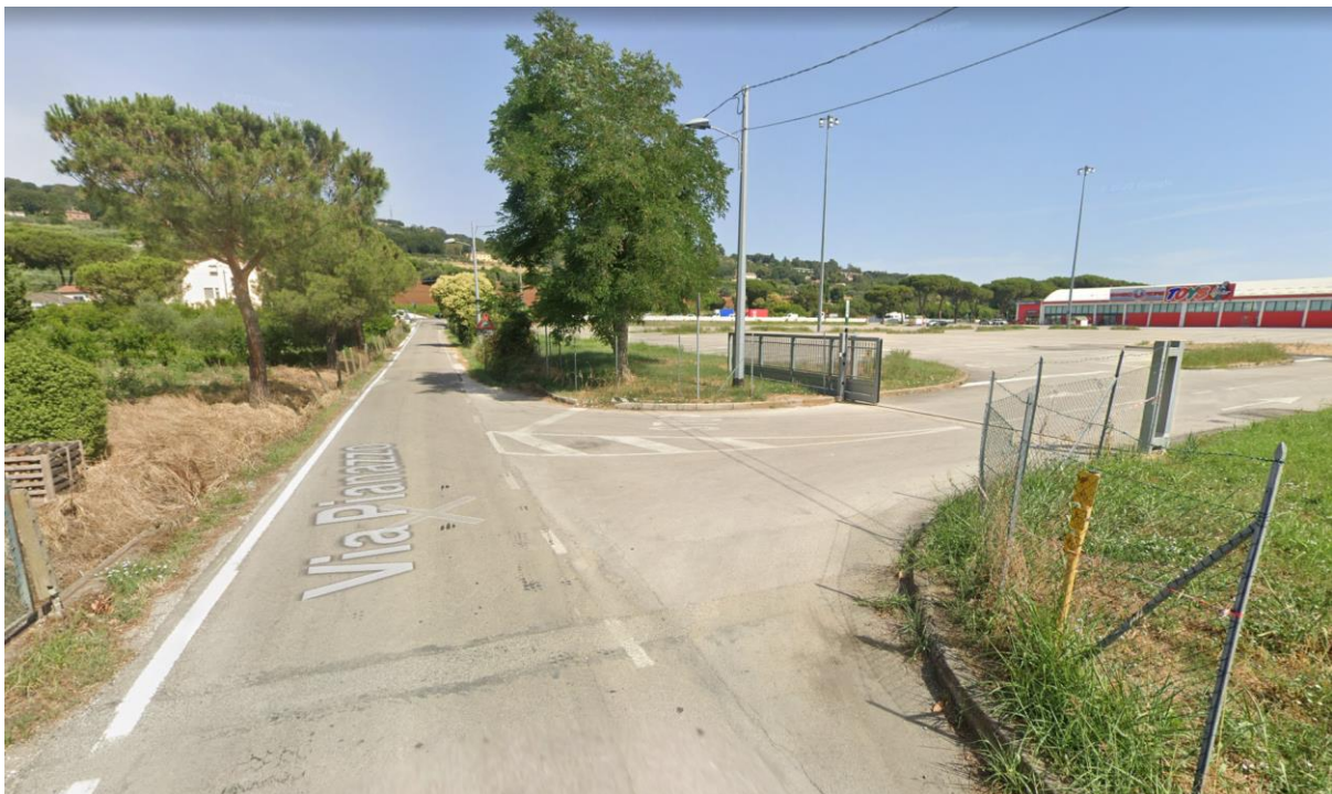
Figura 51 – Intervento 14 Rotatoria su via Pianazzo