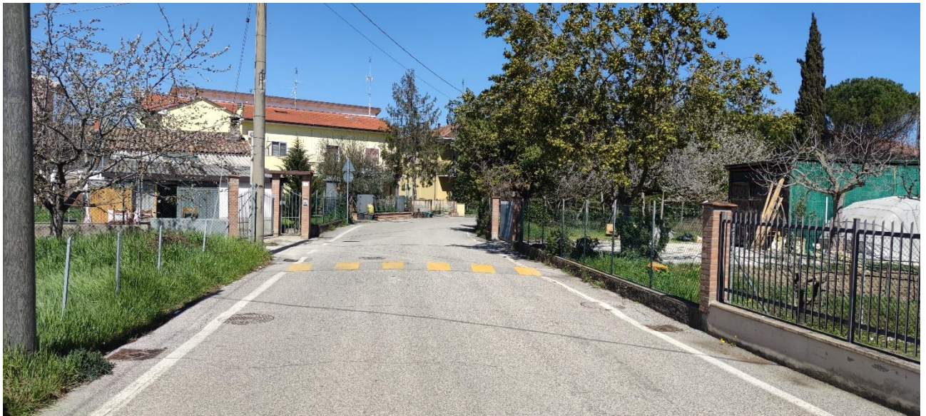
Figura 1 – Intervento 0 Cul de Sac via Pomposa