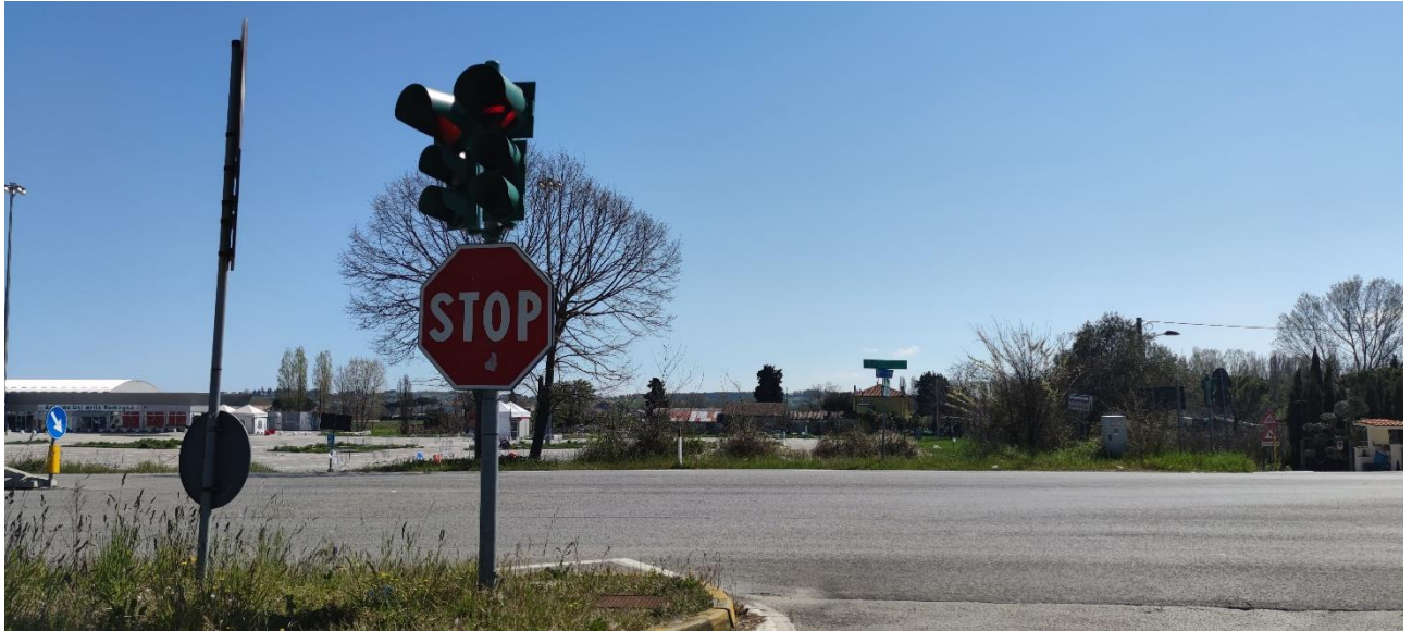
Figura 18 – Intervento 6 Innesso via della Grotta Rossa