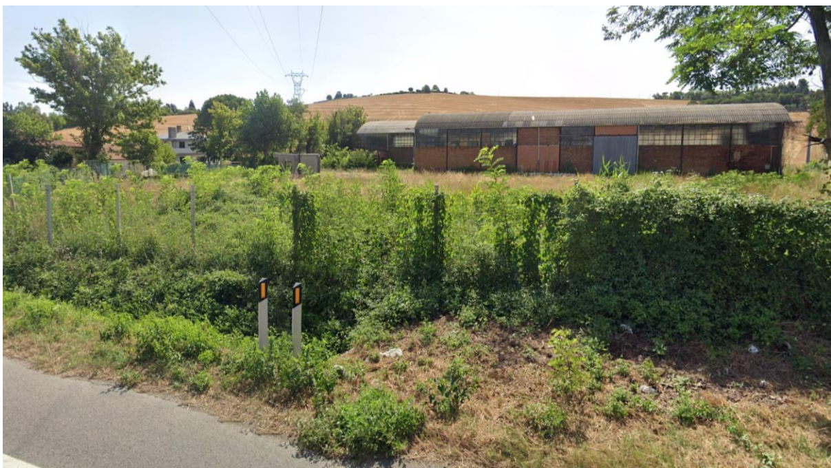
Figura 54 – Intervento 16 Collegamento Sud Fornace Marchesini