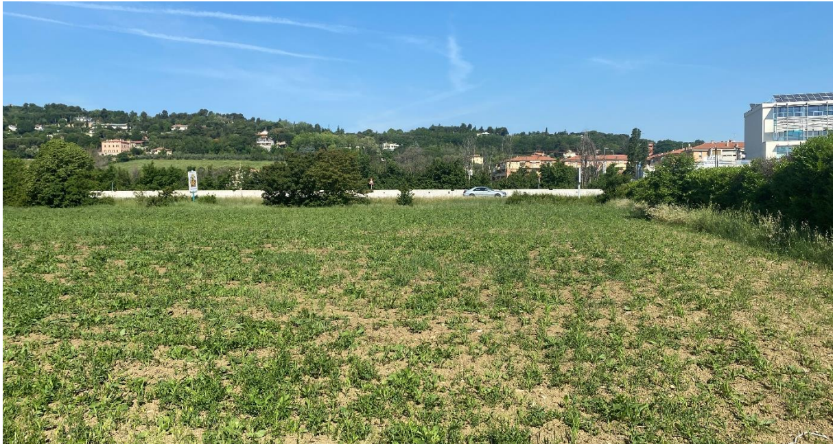
Figura 14 – Intervento 5 Allargamento di via Barattona