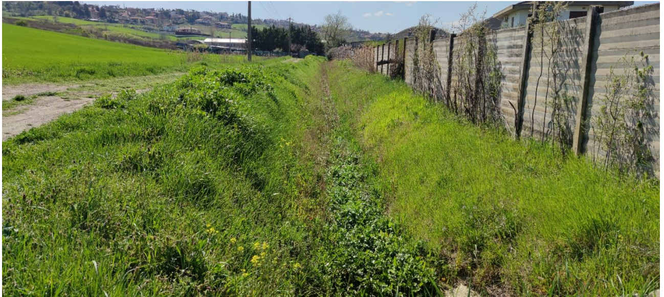
Figura 28 – Intervento 8 Prolungamento Via Pascoli