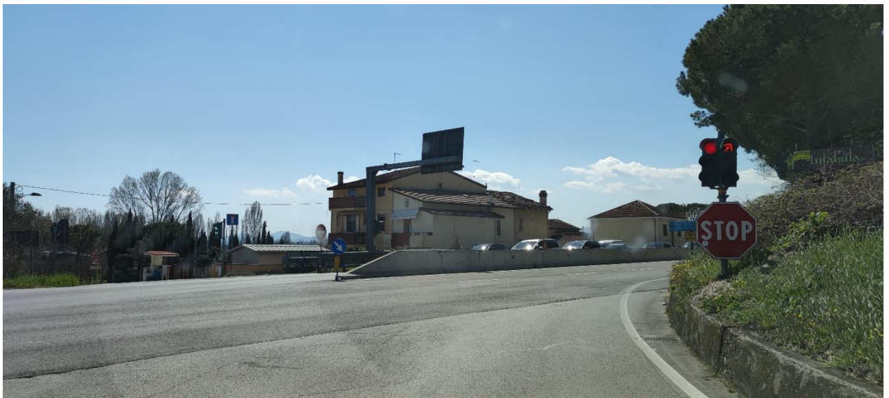
Figura 19 – Intervento 6 Innesso via della Grotta Rossa