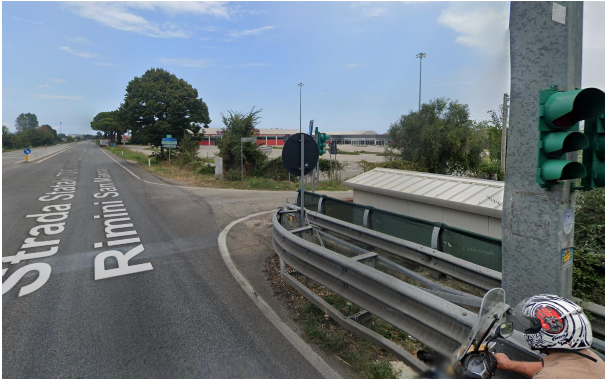
Figura 50 – Intervento 14 Rotatoria su via Pianazzo