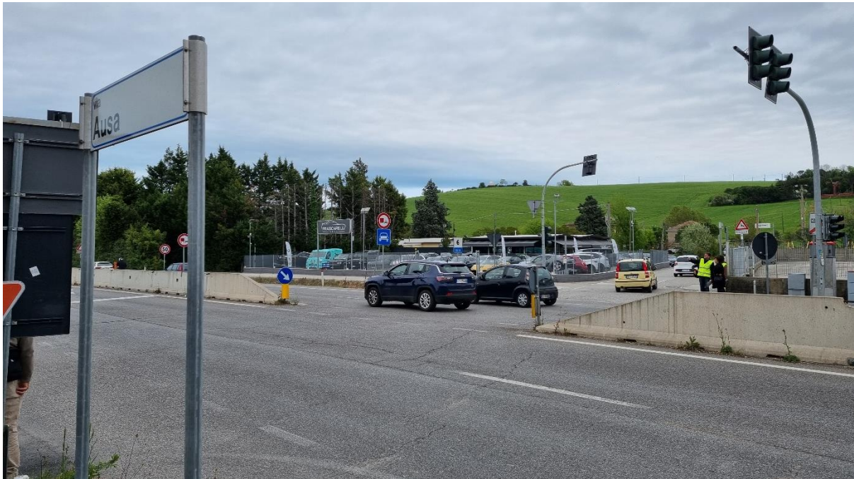
Figura 59 – Intervento 17 Rotatoria su via del Poggio