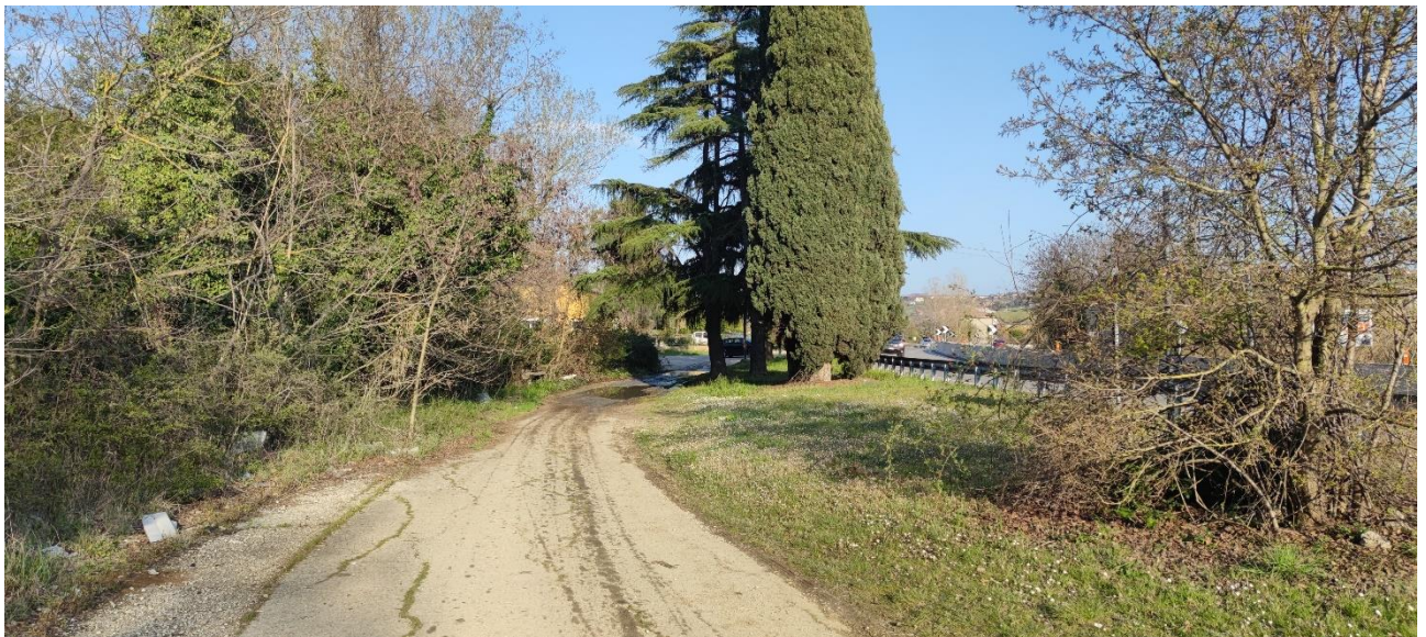
Figura 37 – Intervento 11 Innesto via S. Aquilina