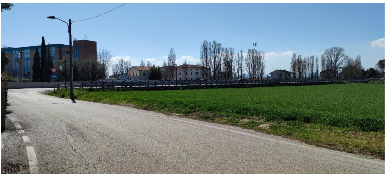
Figura 2 – Intervento 0 Cul de Sac via Pomposa