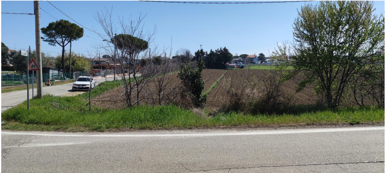
Figura 11 – Intervento 4 Rotatoria su via della Grotta Rossa