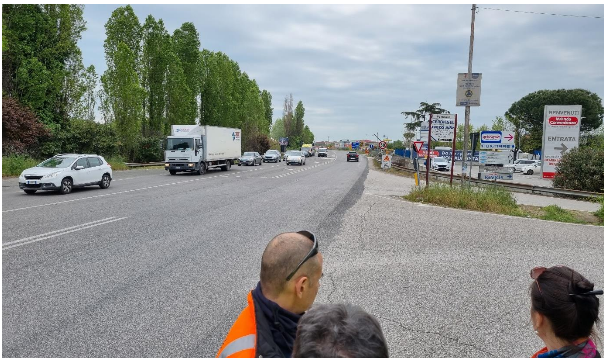
Figura 47 – Intervento 13 Innesto su via Pomposa