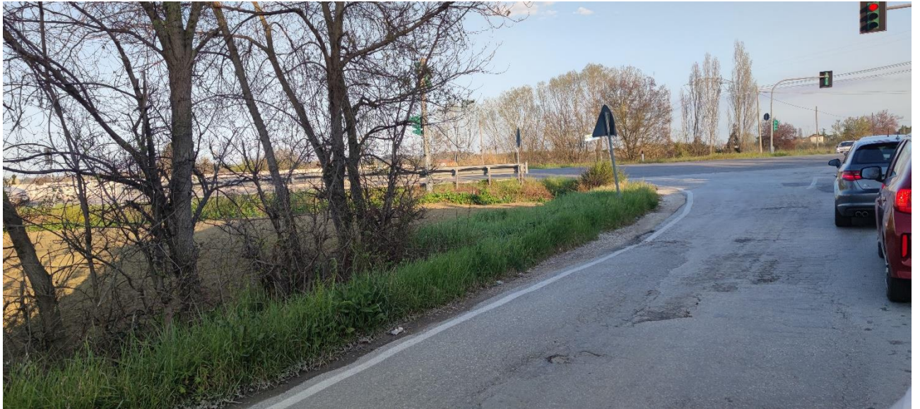
Figura 22 – Intervento 7 Rotatoria Via amola