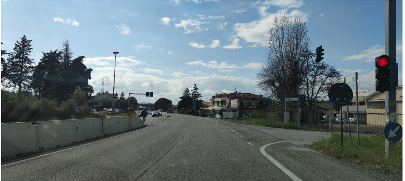
Figura 33 – Intervento 10 Rotatoria Via Pavese