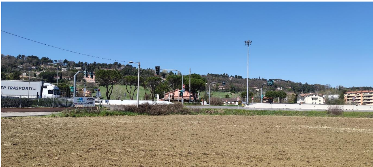
Figura 5 – Intervento 2 Rotatoria via del Gatto