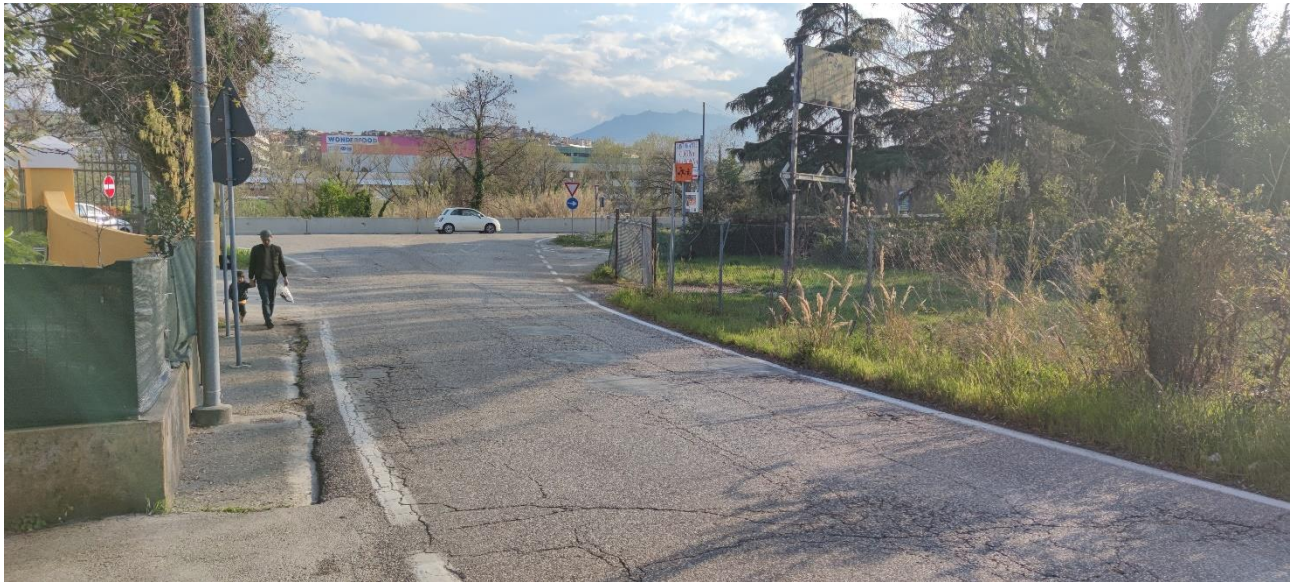
Figura 34 – Intervento 11 Innesto via S. Aquilina