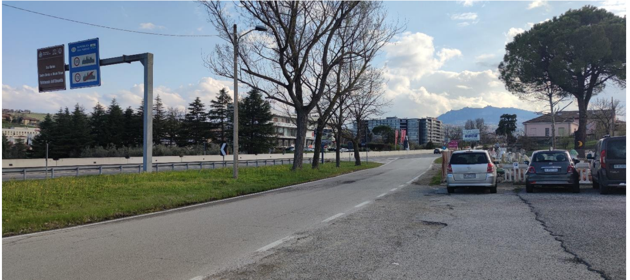
Figura 40 – Intervento 12 Rotatoria San Marino