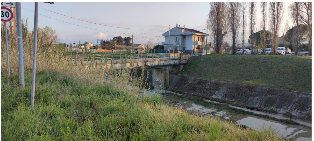
Figura 17 – Intervento 5 Allargamento di via Barattona