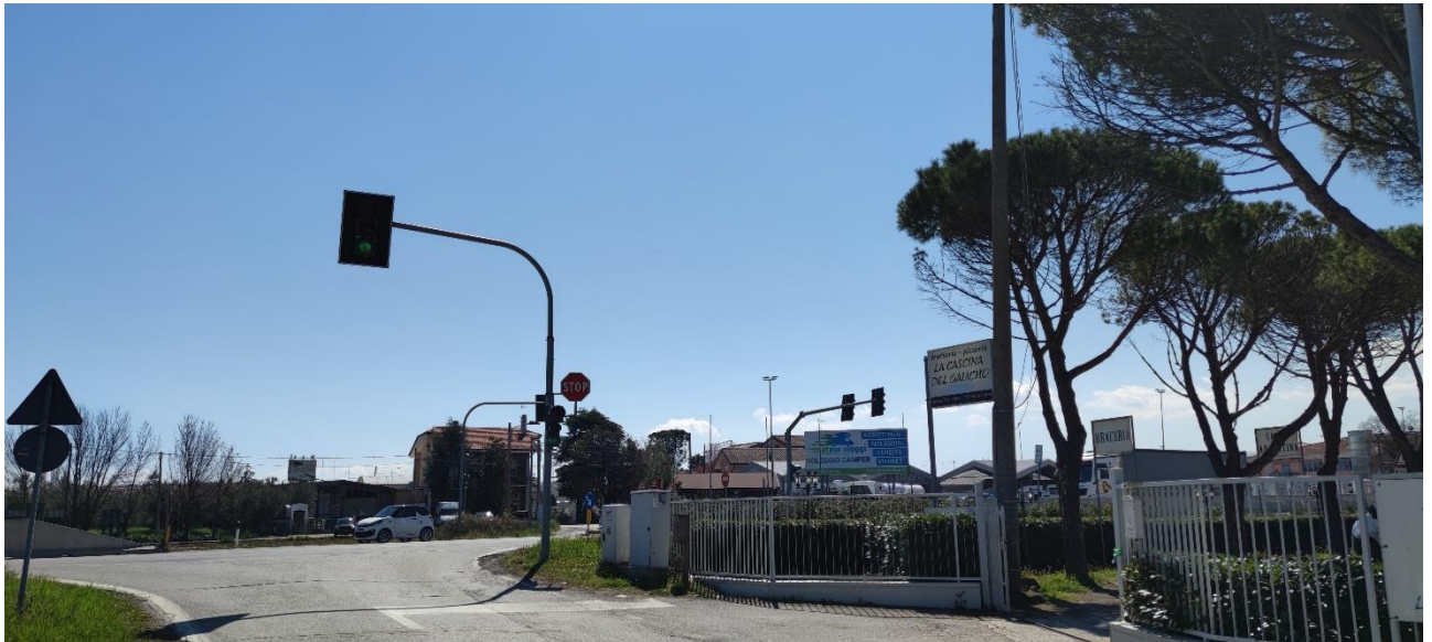
Figura 4 – Intervento 2 Rotatoria via del Gatto