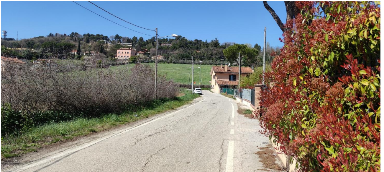
Figura 6 – Intervento 3 Allargamento e rettifica via del Gatto