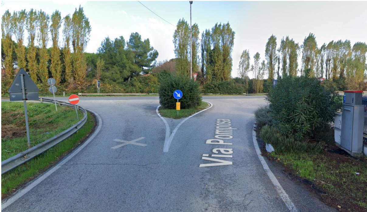
Figura 46 – Intervento 13 Innesto su via Pomposa