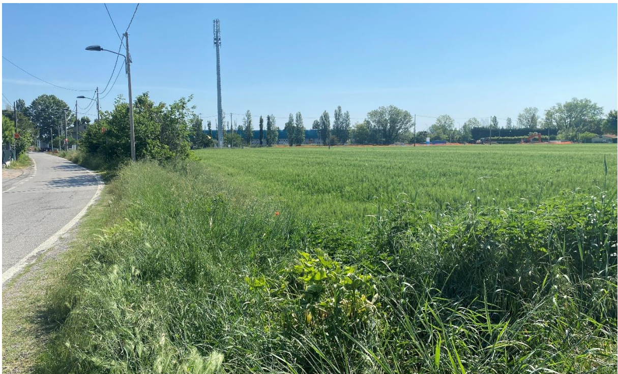
Figura 13 – Intervento 5 Allargamento di via Barattona