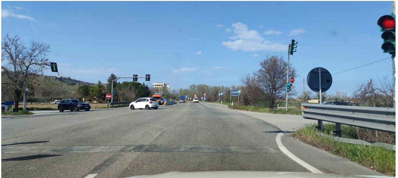
Figura 20 – Intervento 7 Rotatoria Via amola