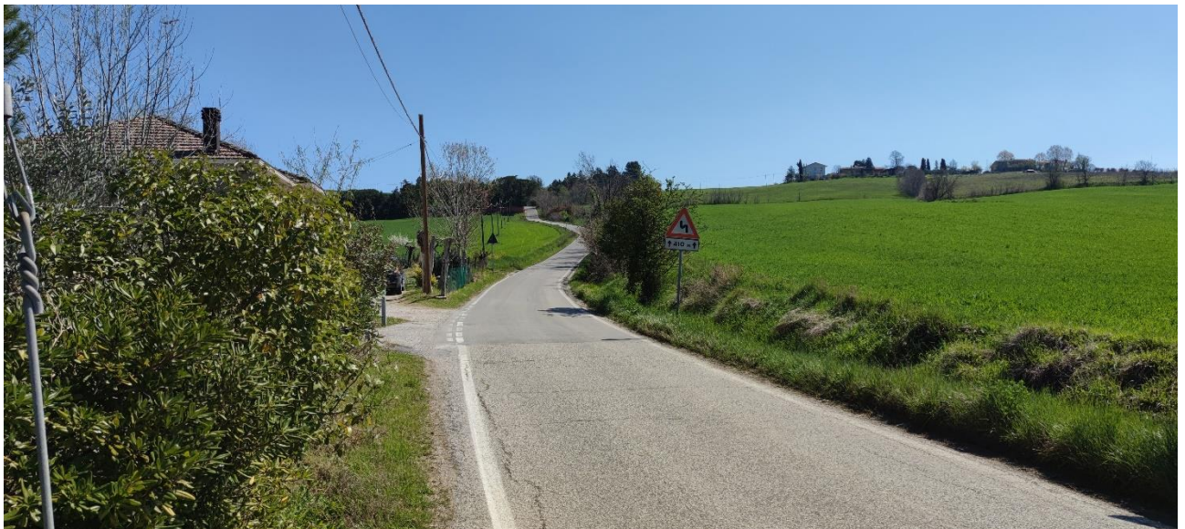
Figura 29 – Intervento 8 Prolungamento Via Pascoli