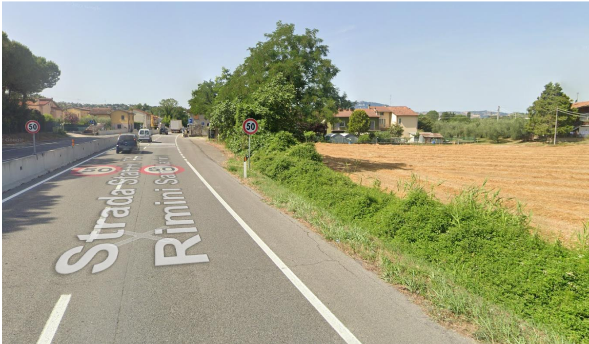
Figura 52 – Intervento 15 Innesto Nord Fornace Marchesini