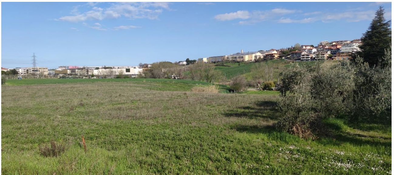
Figura 41 – Intervento 12 Rotatoria San Marino