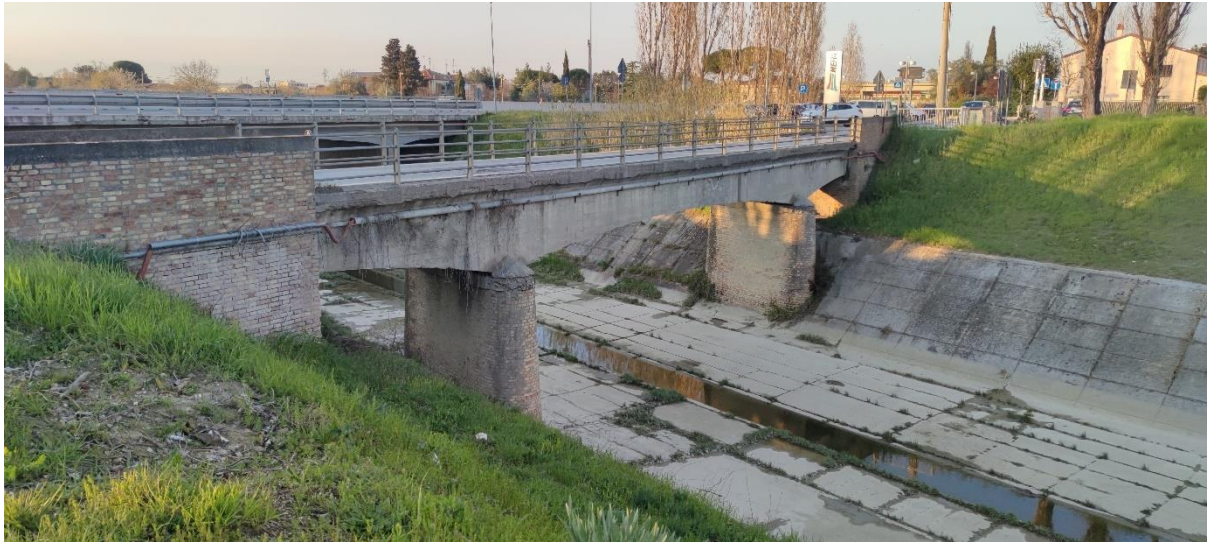
Figura 16 – Intervento 5 Allargamento di via Barattona