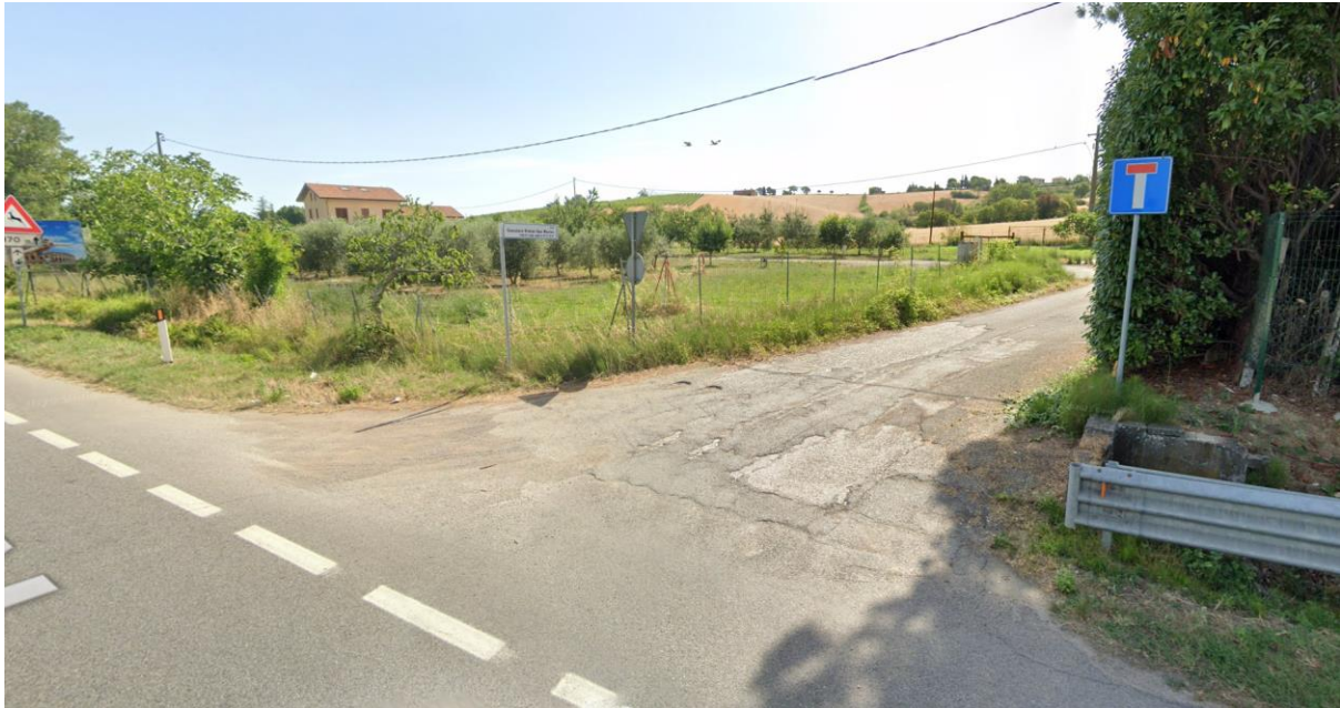
Figura 57 – Intervento 16 Collegamento Sud Fornace Marchesini