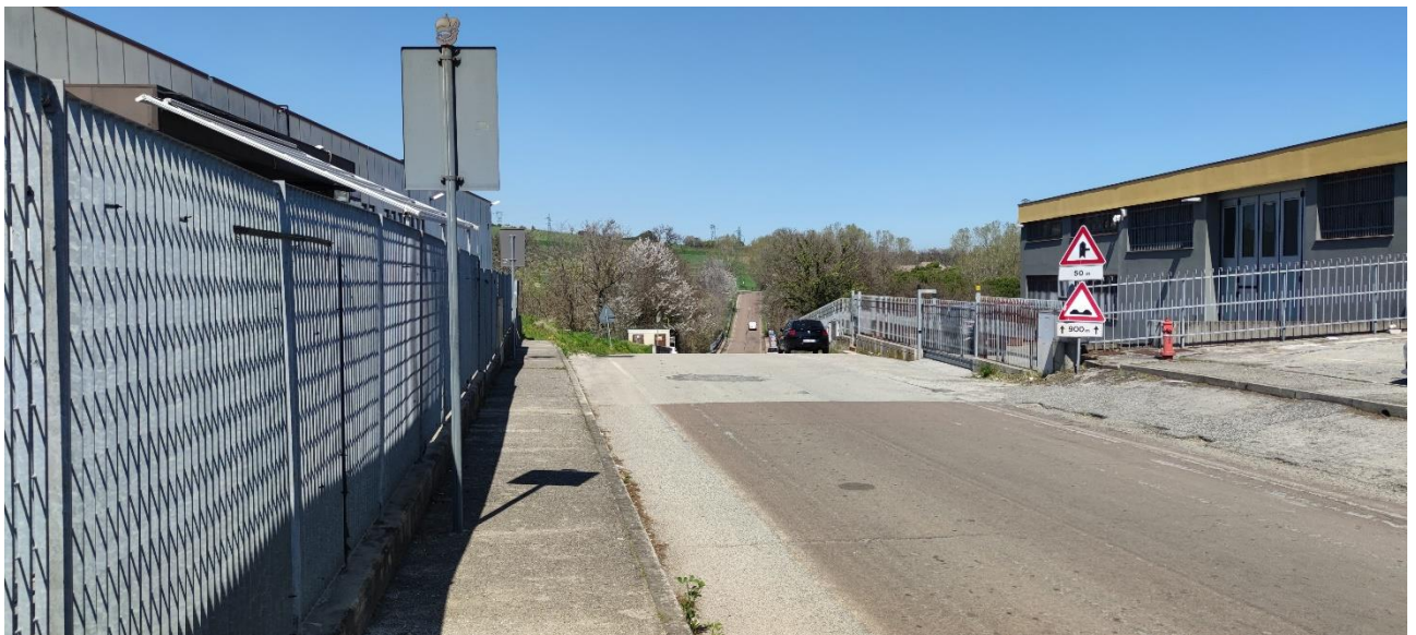
Figura 31 – Intervento 9 Rotatoria S.P. 49