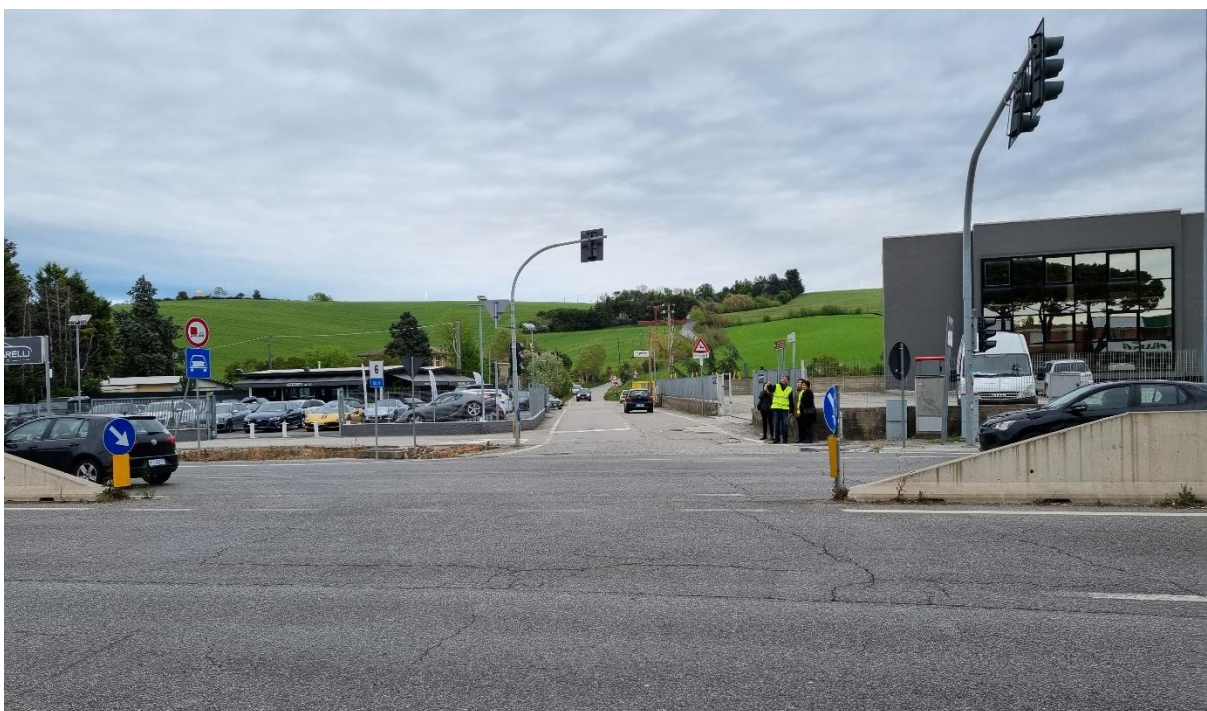
Figura 60 – Intervento 17 Rotatoria su via del Poggio