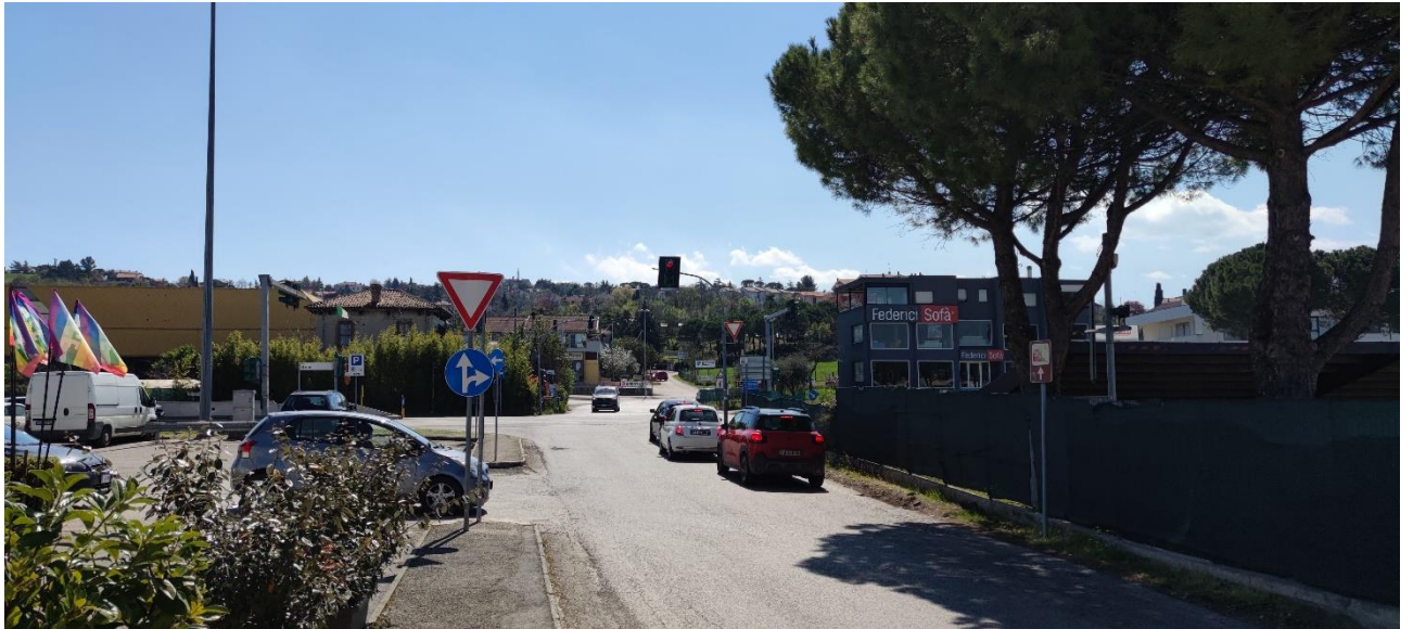
Figura 32 – Intervento 9 Rotatoria S.P. 49