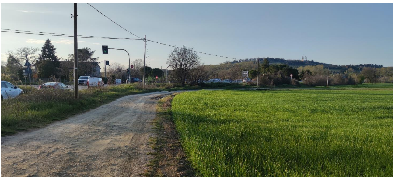
Figura 25 – Intervento 7 Rotatoria Via amola