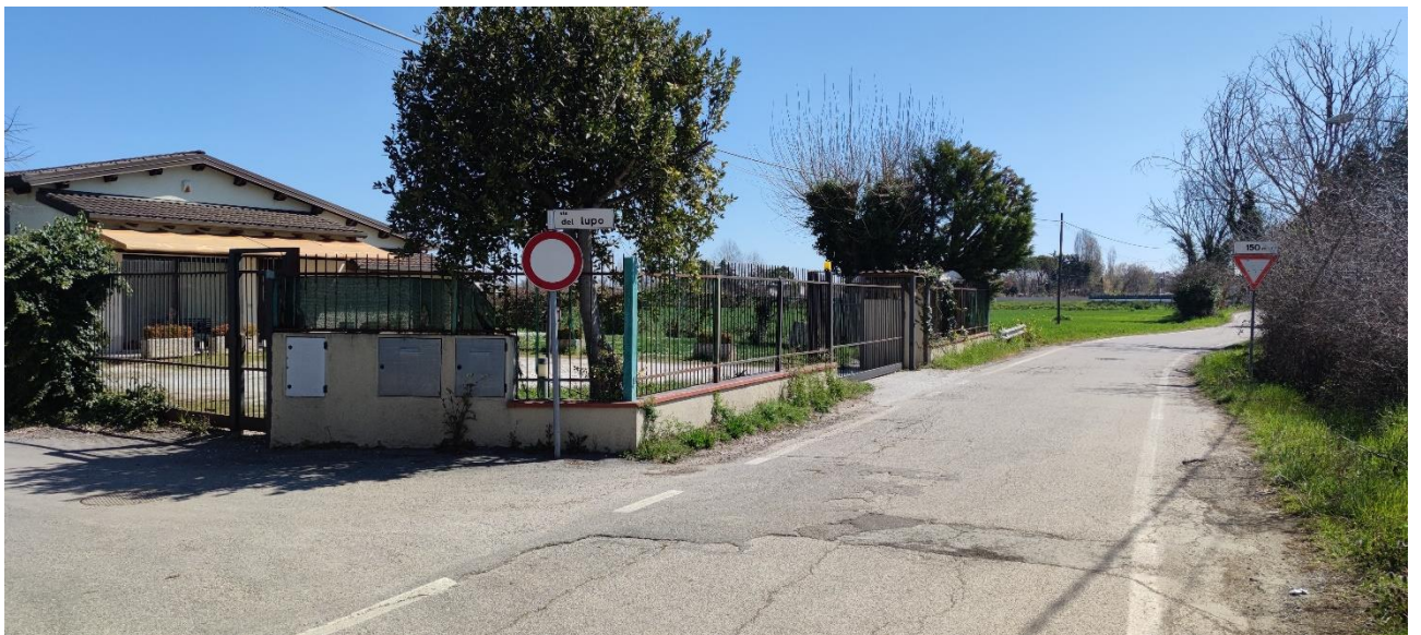
Figura 7 – Intervento 3 Allargamento e rettifica via del Gatto