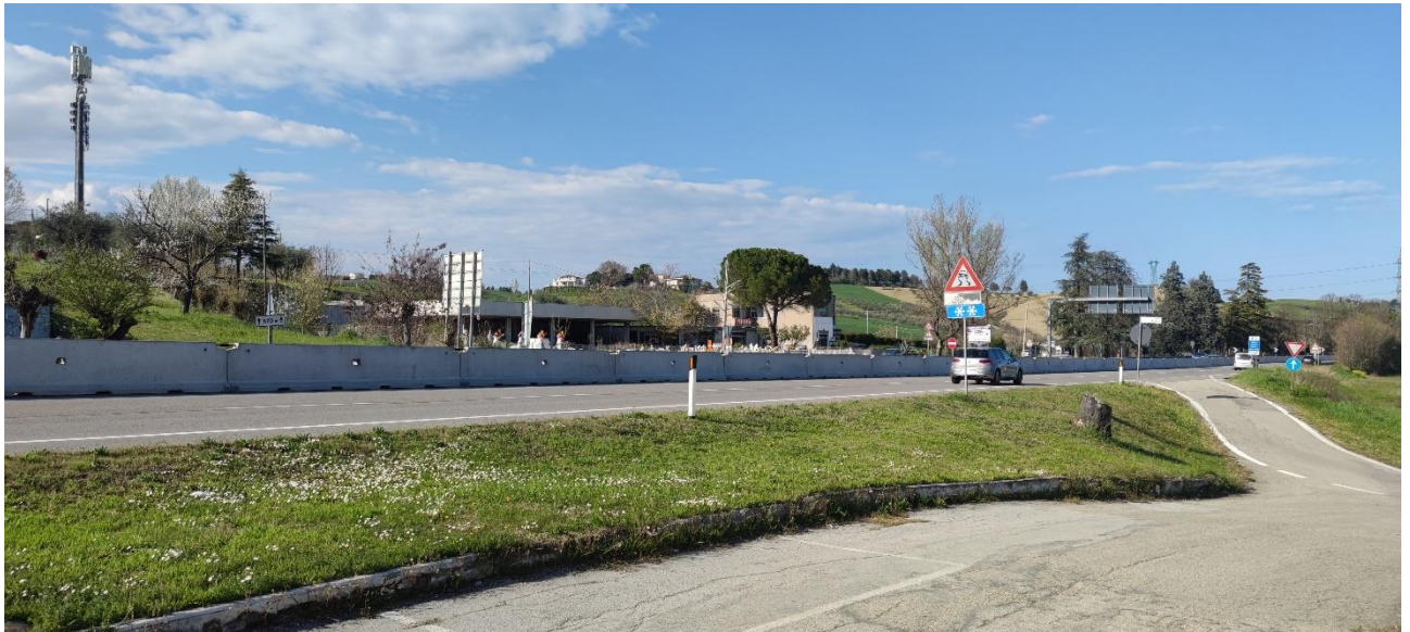
Figura 38 – Intervento 12 Rotatoria San Marino