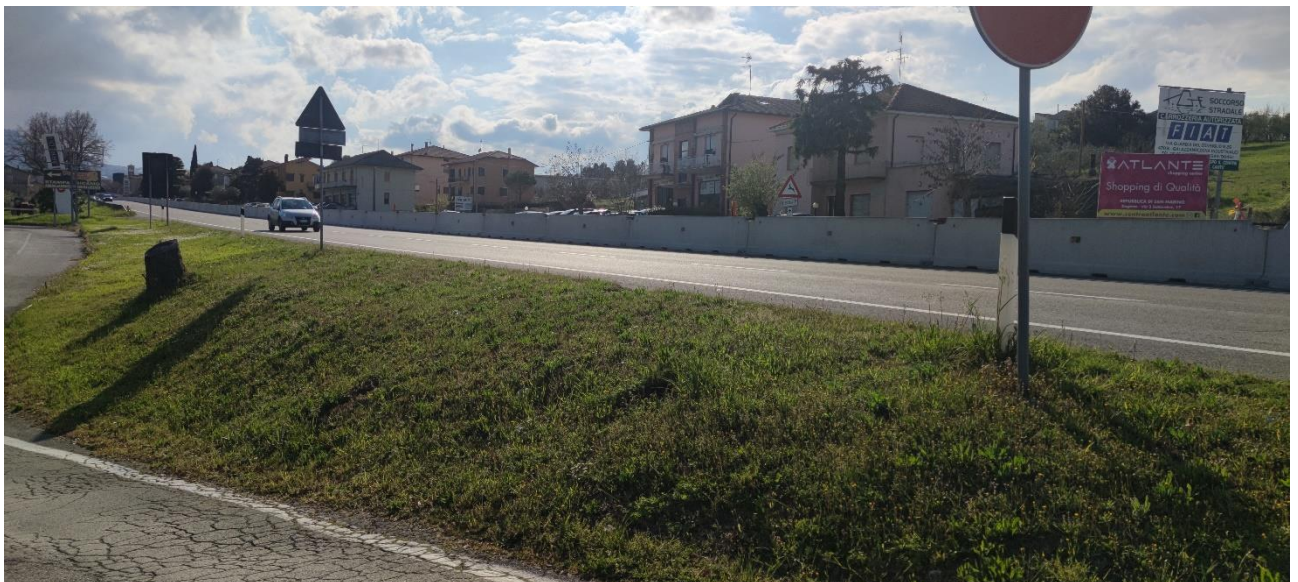
Figura 39 – Intervento 12 Rotatoria San Marino