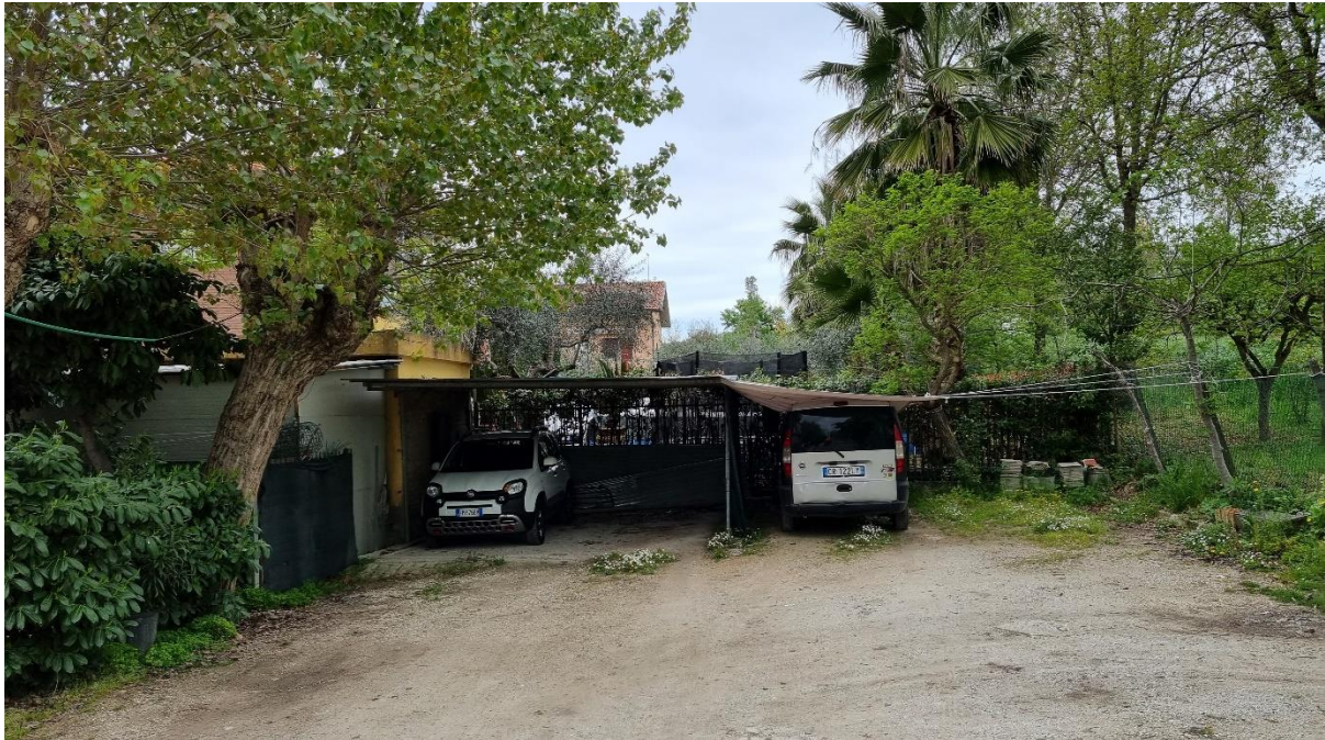
Figura 55 – Intervento 16 Collegamento Sud Fornace Marchesini