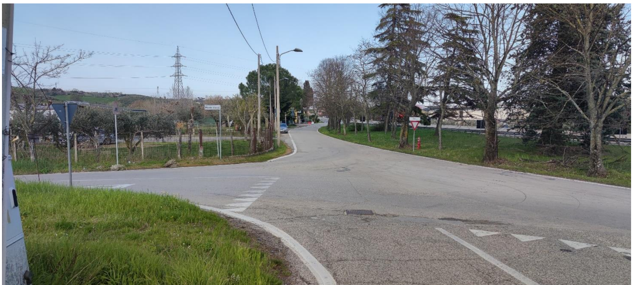
Figura 43 – Intervento 12 Rotatoria San Marino