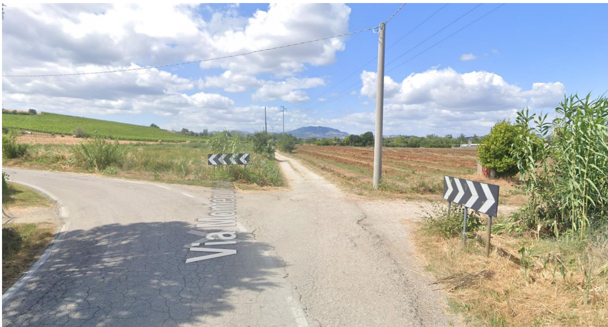
Figura 58 – Intervento 16 Collegamento Sud Fornace Marchesini