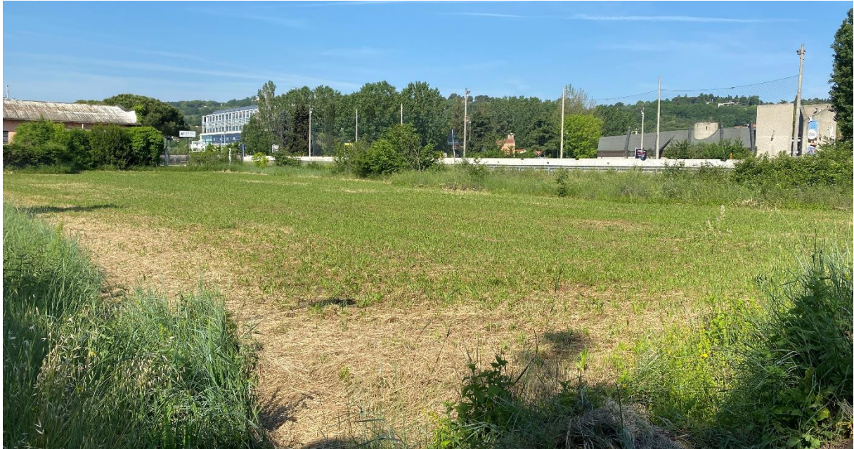
Figura 12 – Intervento 5 Allargamento di via Barattona