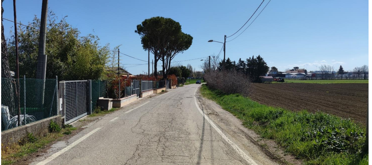
Figura 8 – Intervento 3 Allargamento e rettifica via del Gatto