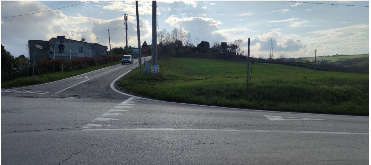
Figura 42 – Intervento 12 Rotatoria San Marino