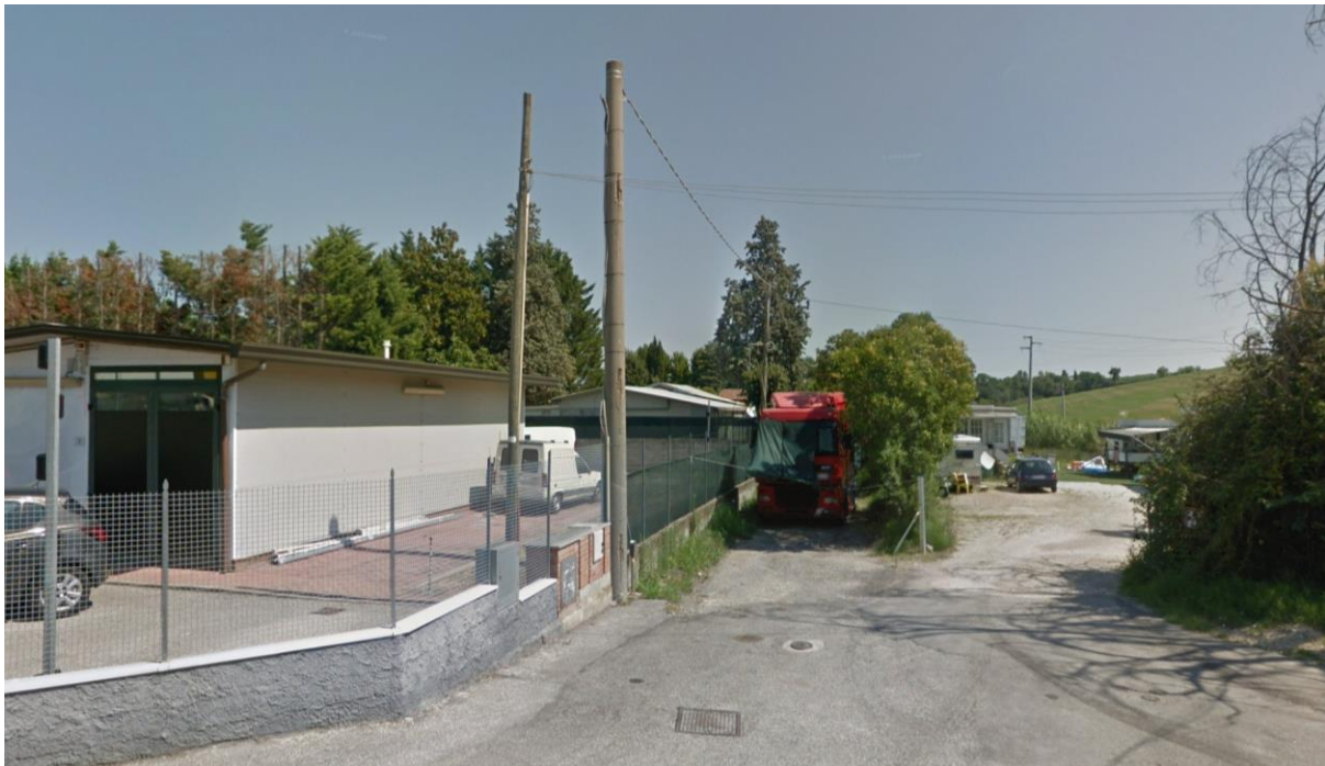
Figura 53 – Intervento 16 Collegamento Sud Fornace Marchesini