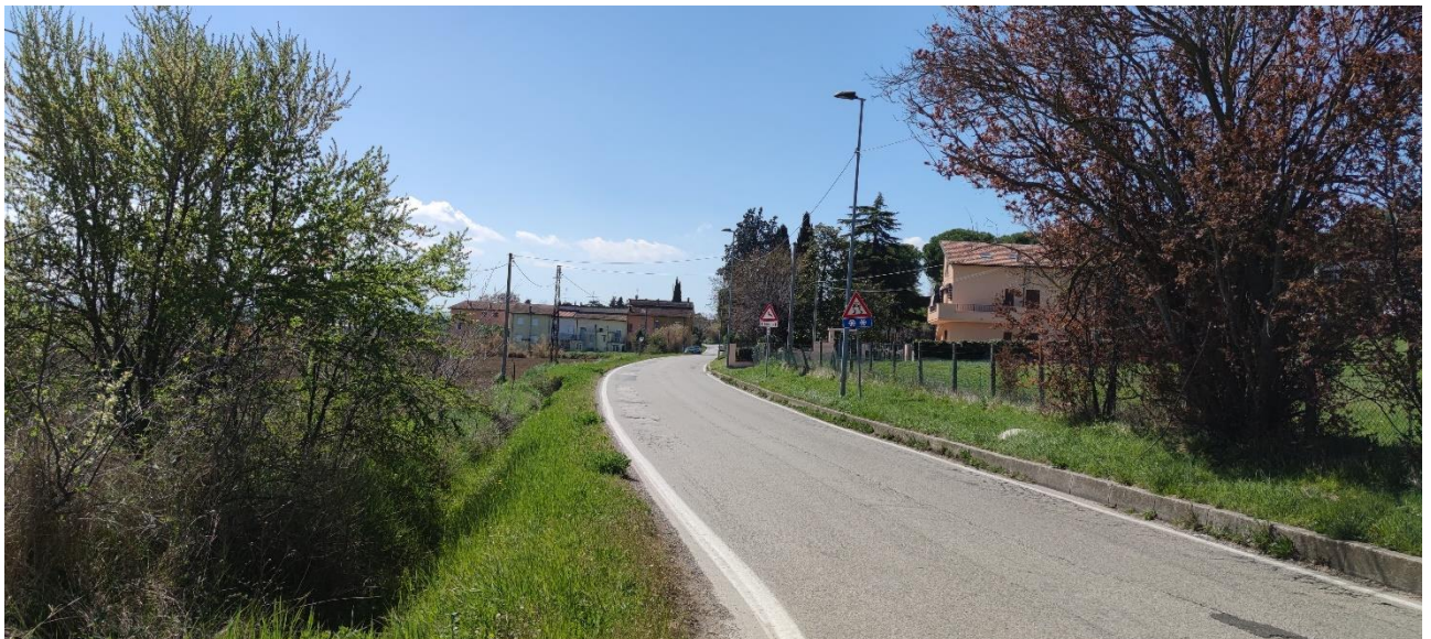
Figura 10 – Intervento 4 Rotatoria su via della Grotta Rossa