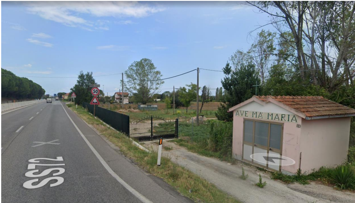
Figura 48 – Intervento 14 Rotatoria su via Pianazzo