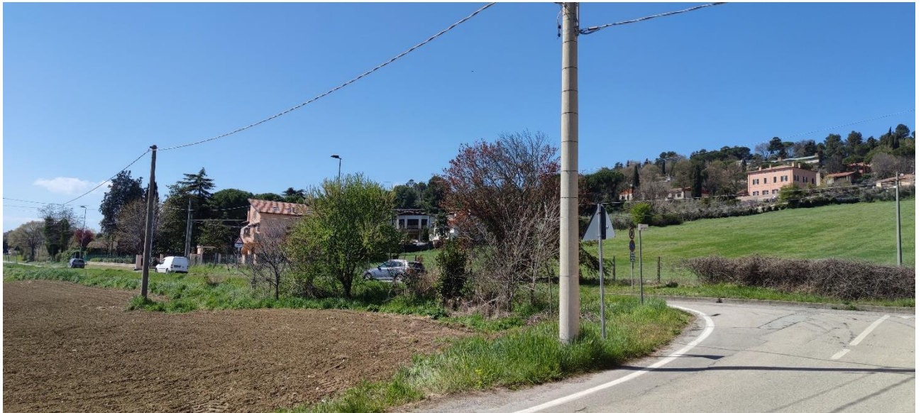
Figura 9 – Intervento 4 Rotatoria su via della Grotta Rossa