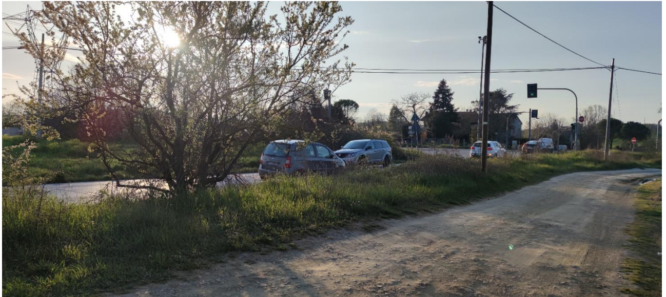
Figura 24 – Intervento 7 Rotatoria Via amola