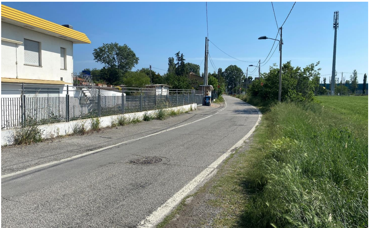
Figura 15 – Intervento 5 Allargamento di via Barattona