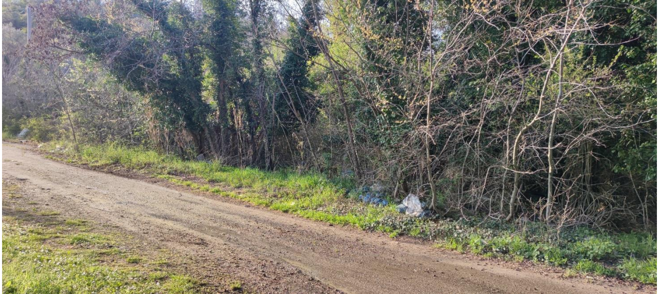
Figura 36 – Intervento 11 Innesto via S. Aquilina