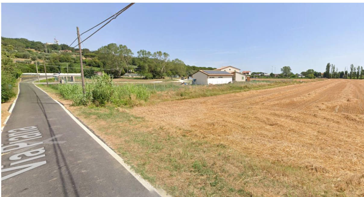
Figura 49 – Intervento 14 Rotatoria su via Pianazzo