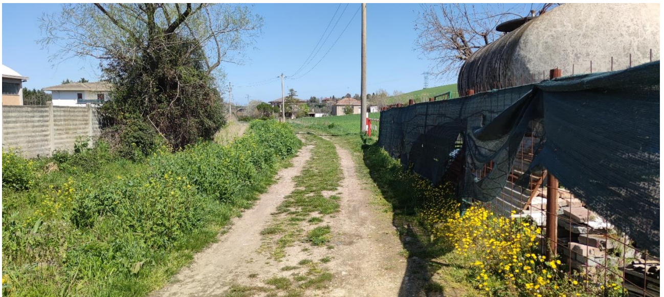
Figura 27 – Intervento 8 Prolungamento Via Pascoli