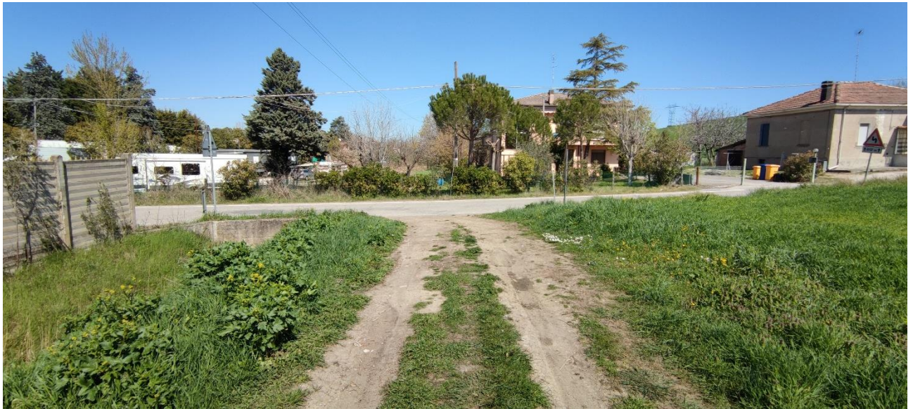
Figura 26 – Intervento 8 Prolungamento Via Pascoli