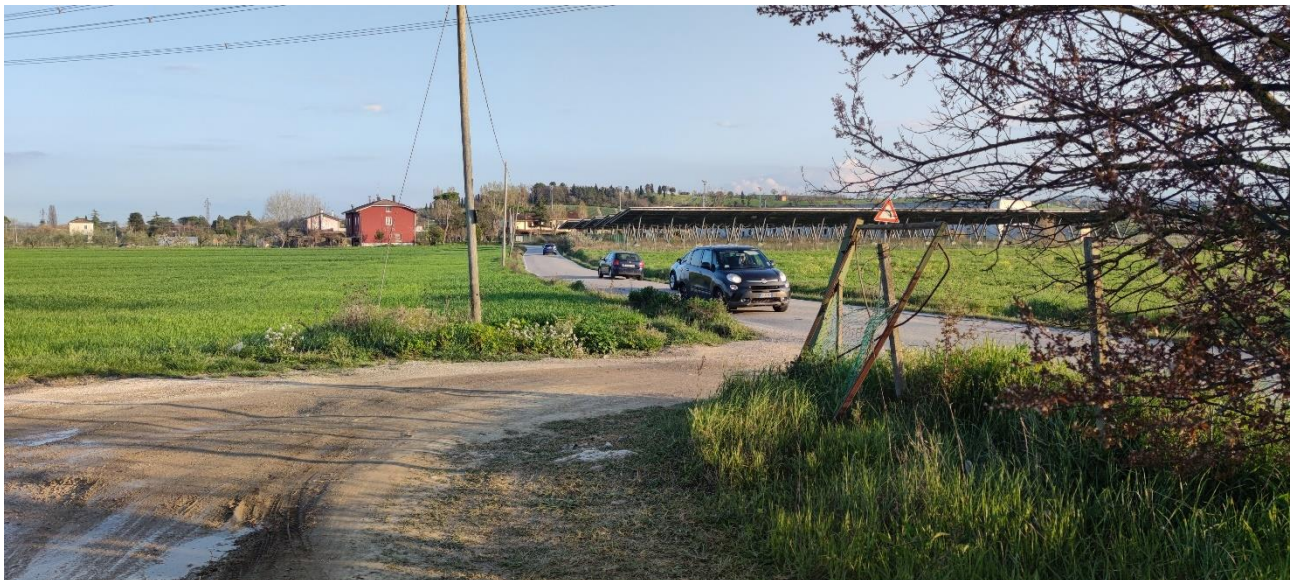
Figura 23 – Intervento 7 Rotatoria Via amola