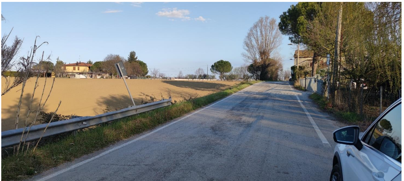
Figura 21 – Intervento 7 Rotatoria Via amola