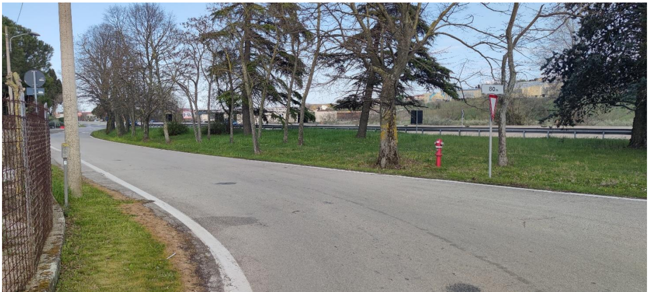
Figura 45 – Intervento 12 Rotatoria San Marino