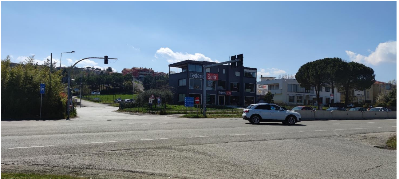
Figura 30 – Intervento 9 Rotatoria S.P. 49