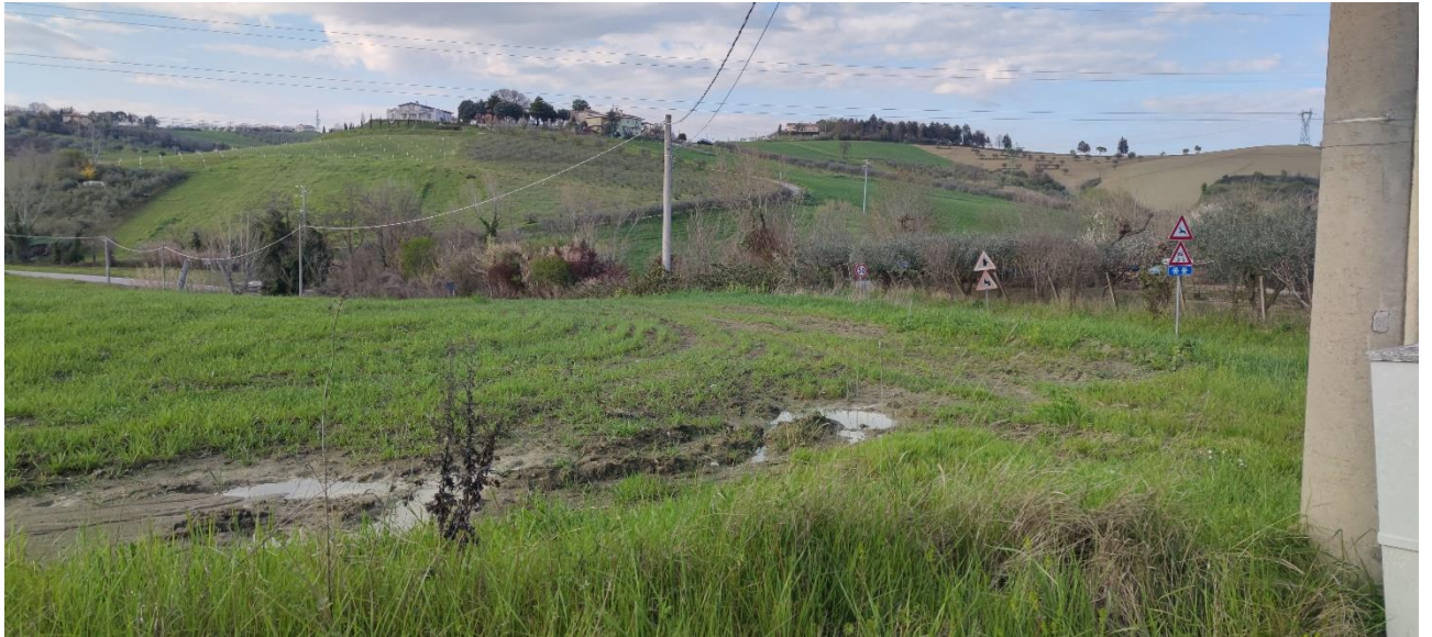
Figura 44 – Intervento 12 Rotatoria San Marino