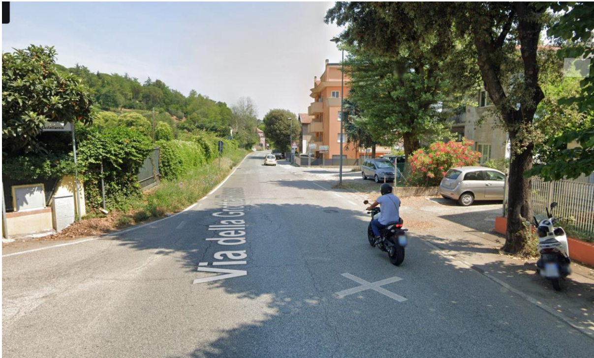
Figura 3 – Intervento 1a Rotatoria su via della Gazzella