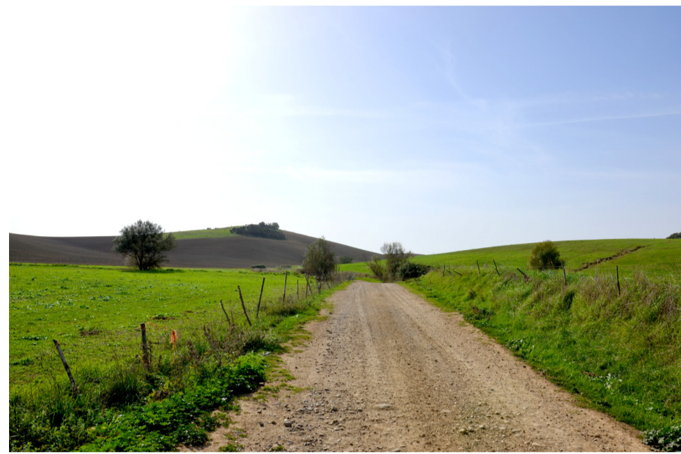
07- STATO DI FATTO