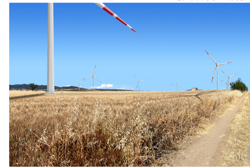
20- STATO DI PROGETTO