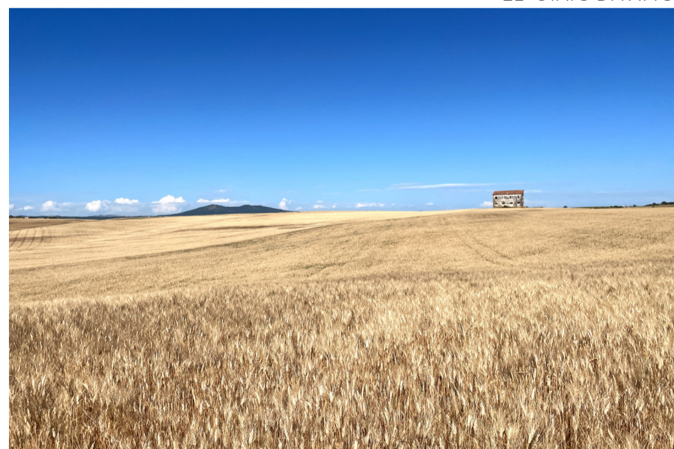
21- STATO DI FATTO