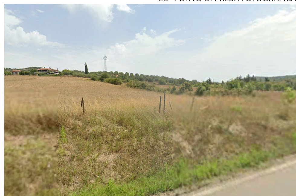
23- PUNTO DI PRESA FOTOGRAFICA