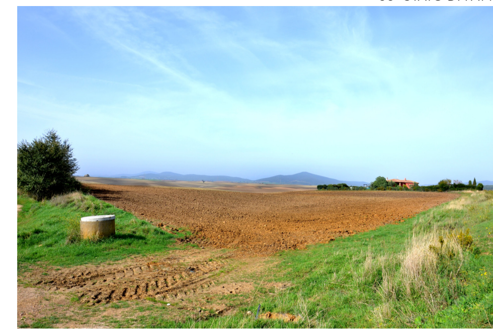
06- STATO DI FATTO