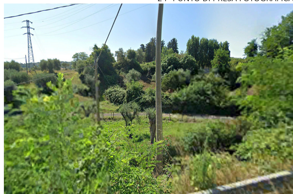
24- PUNTO DI PRESA FOTOGRAFICA