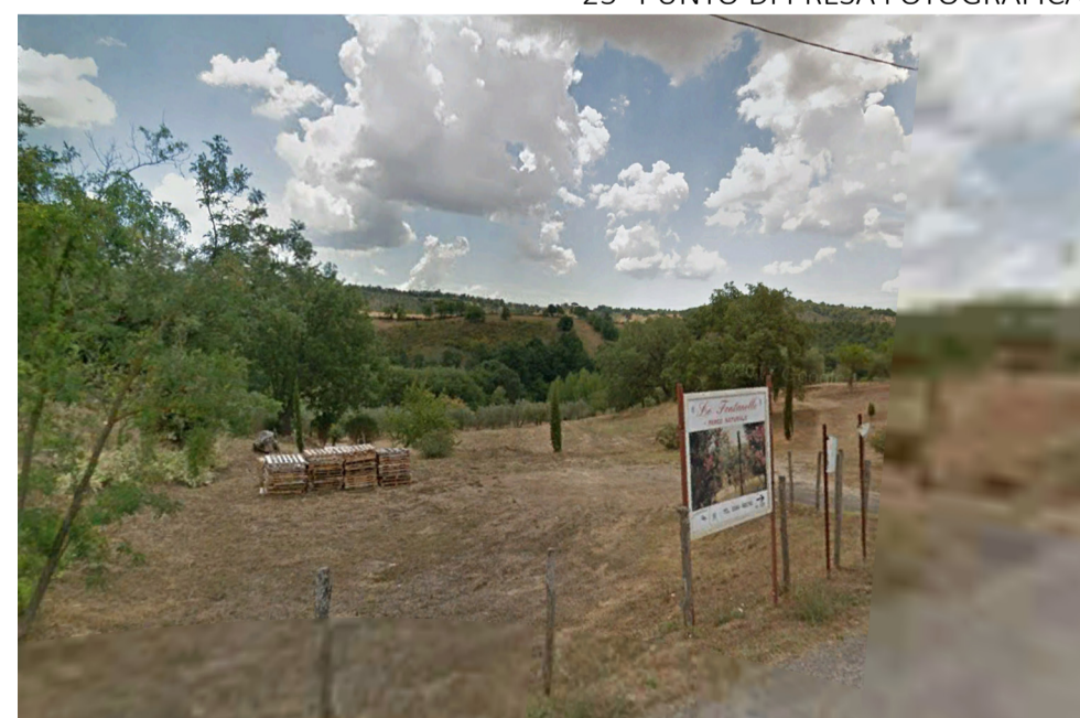
25- PUNTO DI PRESA FOTOGRAFICA