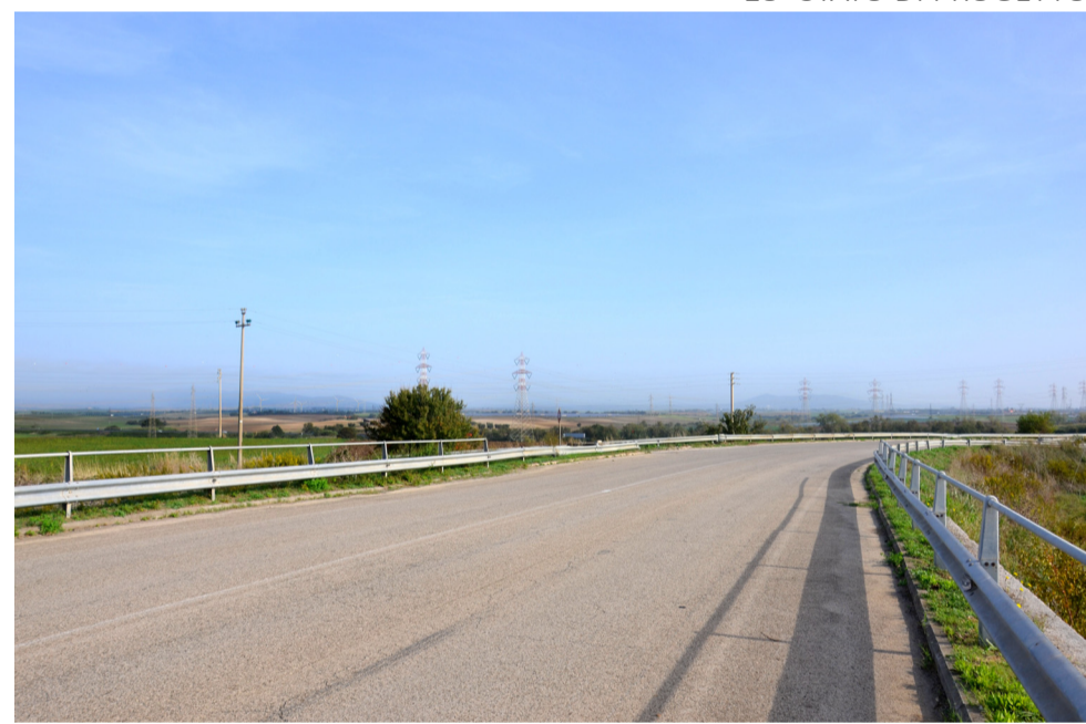
18- STATO DI PROGETTO