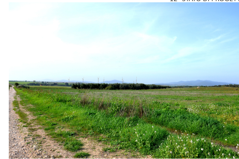
12- STATO DI PROGETTO