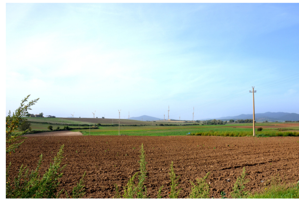
11b- STATO DI PROGETTO