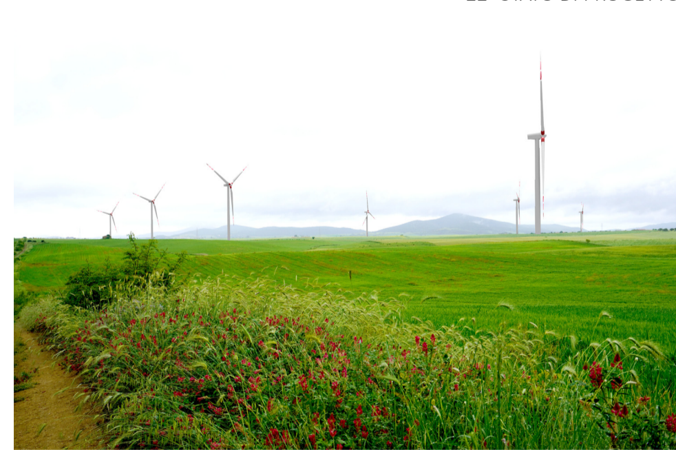
22- STATO DI PROGETTO