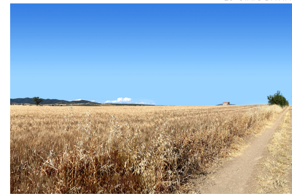
20- STATO DI FATTO