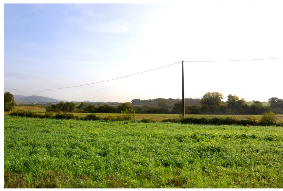
01- STATO DI FATTO