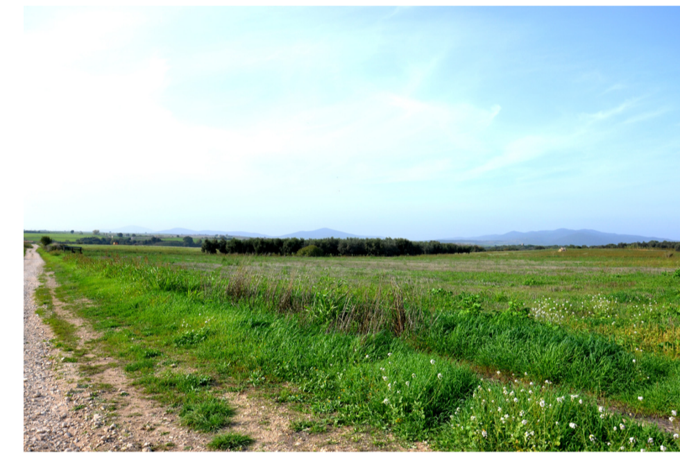
12- STATO DI FATTO