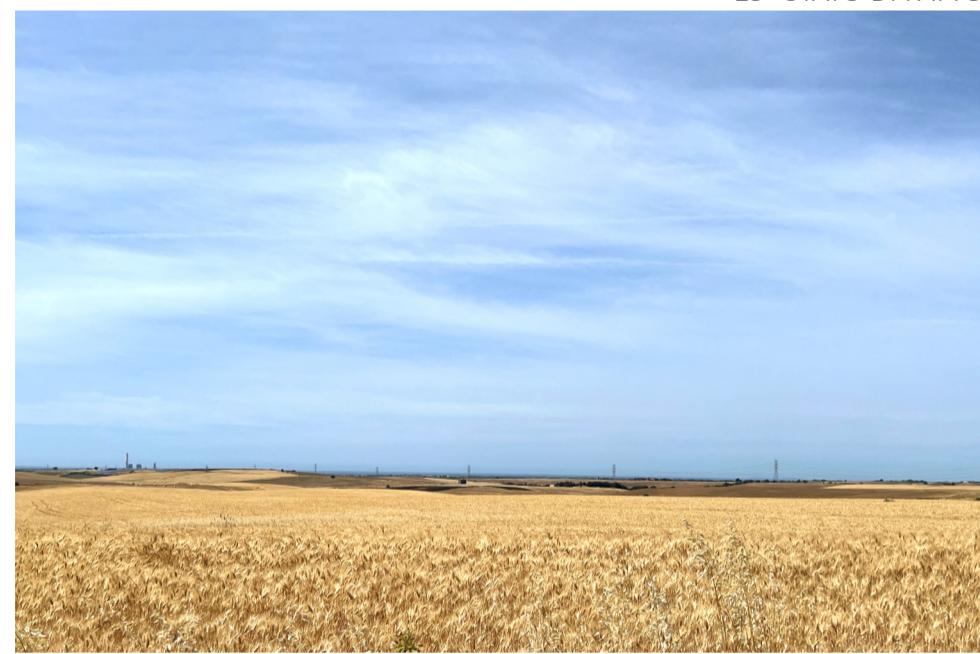
19- STATO DI FATTO