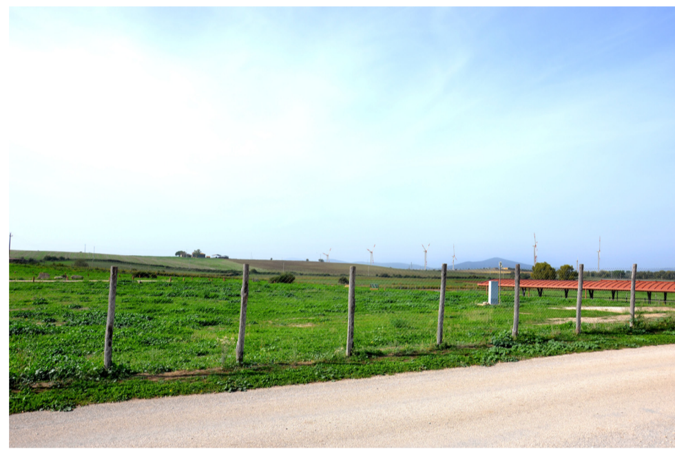
11a- STATO DI PROGETTO