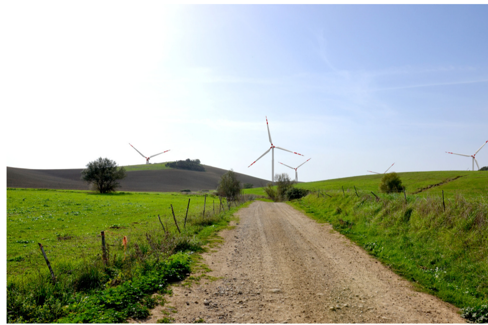
07- STATO DI PROGETTO