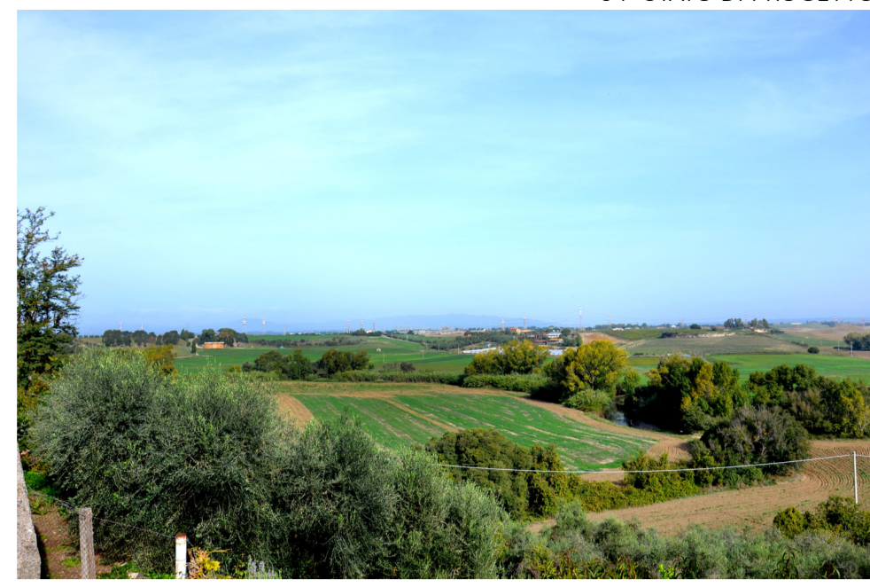
04- STATO DI PROGETTO