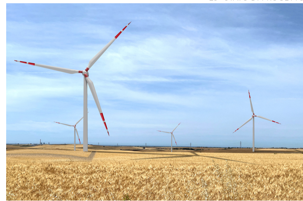
19- STATO DI PROGETTO