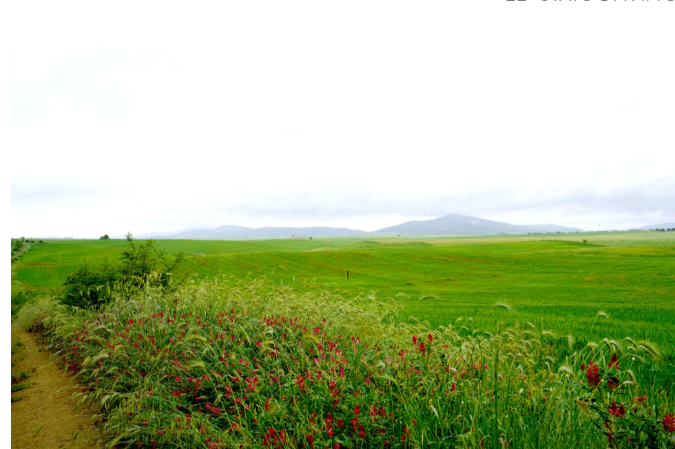
22- STATO DI FATTO