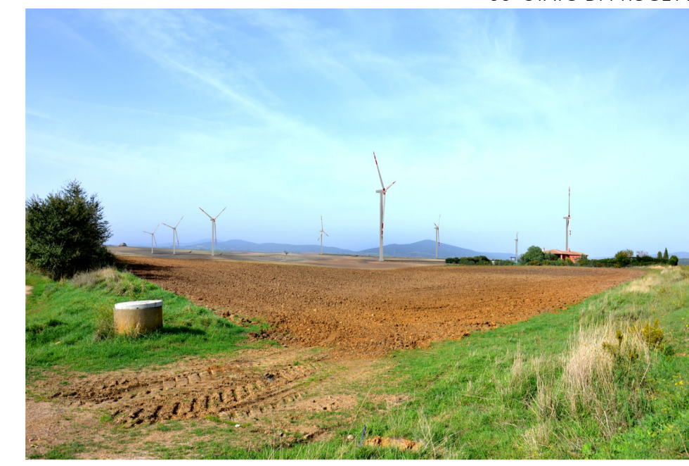
06- STATO DI PROGETTO