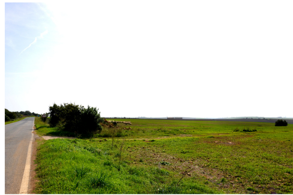
08- STATO DI FATTO