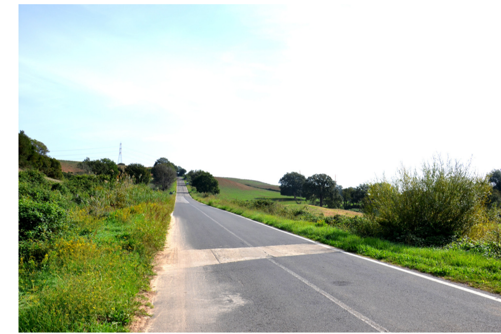
09- STATO DI PROGETTO