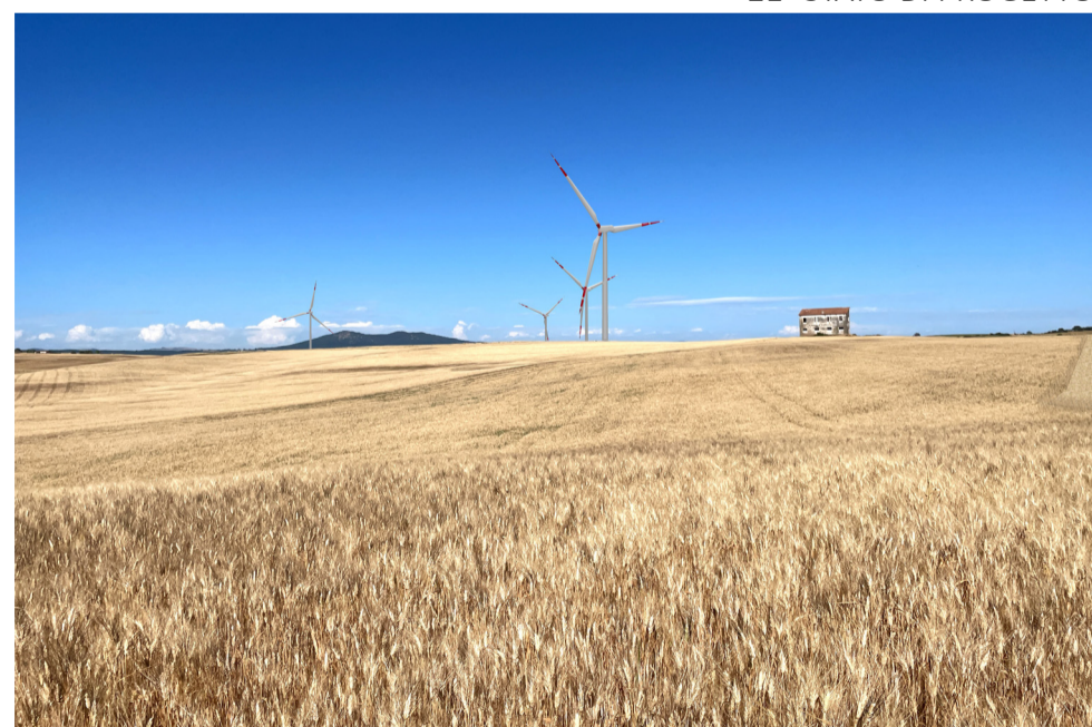
21- STATO DI PROGETTO