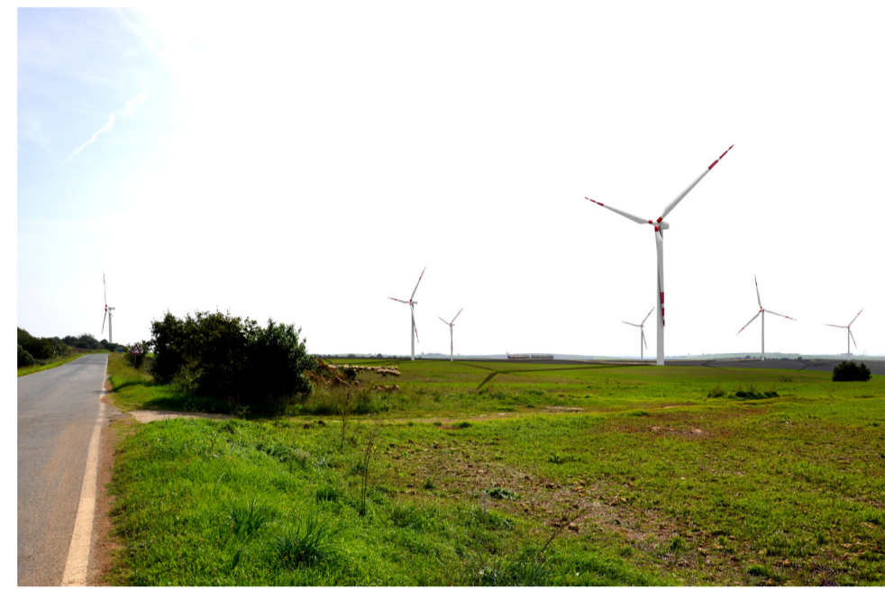
08- STATO DI PROGETTO