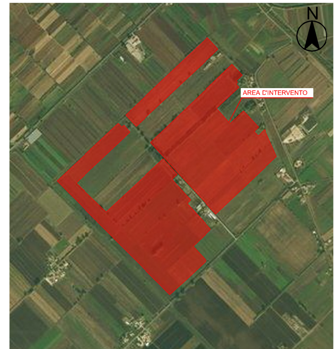
Localizzazione su ortofoto Scala 1:25.000

Le coordinate geografiche sono riferite all'ellissoide internazionale con orientamento medio europeo (E.D. 1950). Le coordinate piane sono nel sistema Gauss-Boaga.