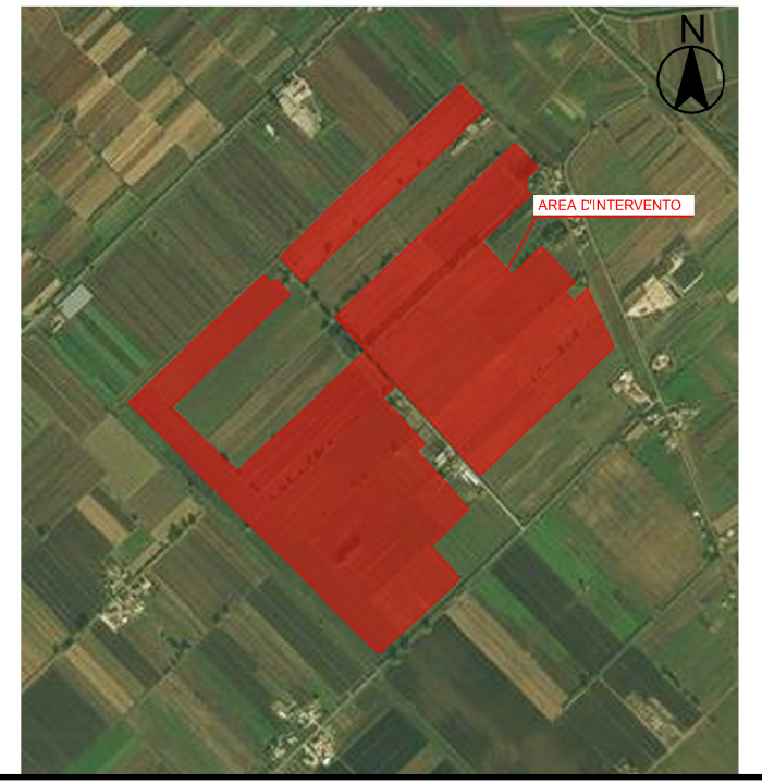
Localizzazione su ortofoto Scala 1:25.000

Le coordinate geografiche sono riferite all'ellissoide internazionale con orientamento medio europeo (E.D. 1950). Le coordinate piane sono nel sistema Gauss-Boaga.