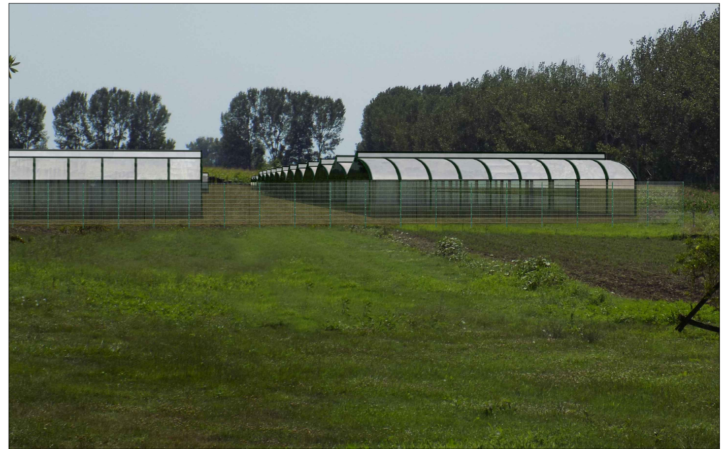
4_ "Vista dalla visibilità secondaria"_ 41.453024, 13.099388; 41°27'10.9"N, 13°05'57.8"E (Visibilità di progetto di nuova realizzazione interna al lotto) Fotoinserimento del solo intervento progettuale