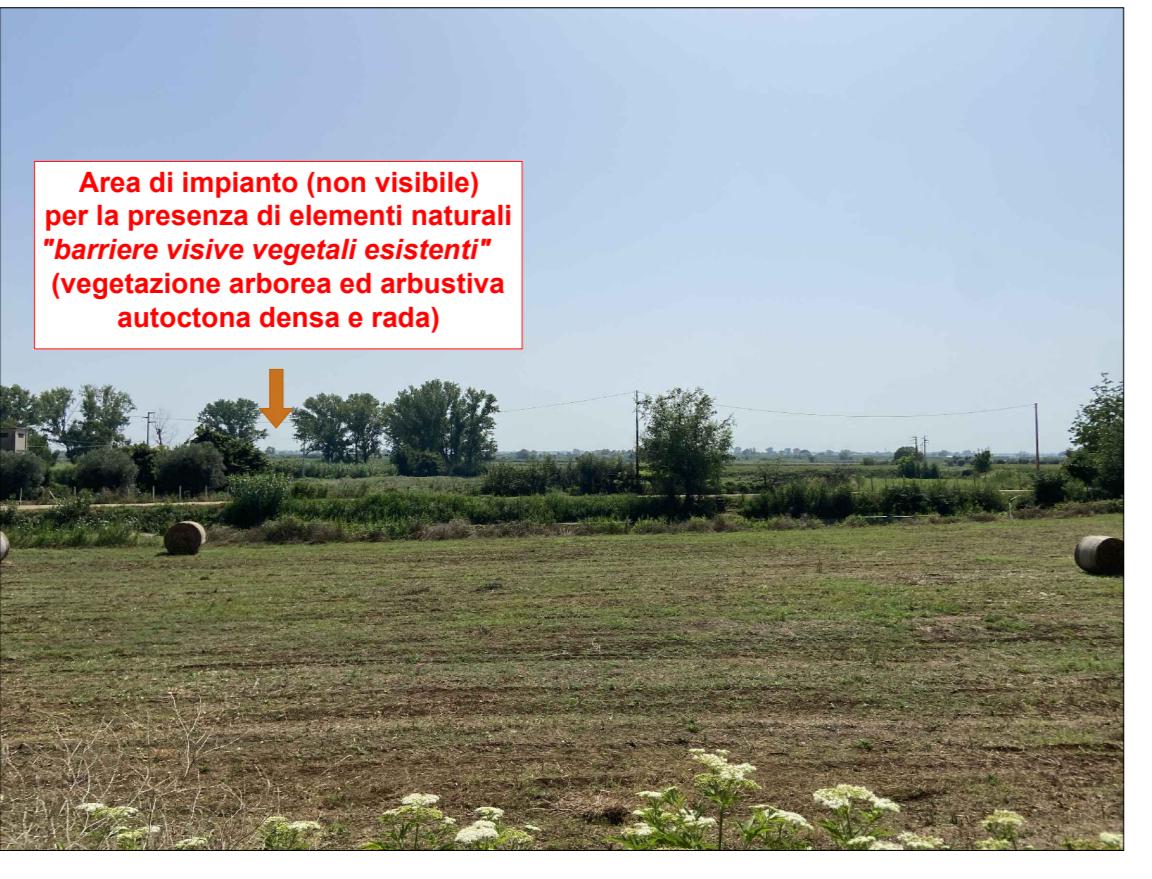
13_ "Strada dei Gricilli"_ 41.460033, 13.120245; 41°27'36.1"N, 13°07'19.9"E L'area di impianto dista 1,74 km circa dalla "Strada dei Gricilli" non risultando visibile per la presenza di elementi naturali (vegetazione arbustiva autoctona densa e rada)