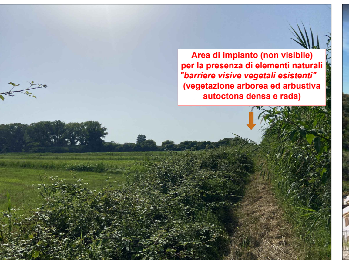
10_ "Lago Mazzocchio"_ 41.444638, 13.131660; 41°27'14.4"N, 13°07'54.0"E L'area di impianto dista 2,28 km circa dal "Lago Mazzocchio" (Beni ricognitivi di legge_ TAV_ B PTPR_ art.134 co.1 lett. b e art. 142 co.1 D.Lgs. 42/2004) non risultando visibile per la presenza di elementi naturali (vegetazione arbustiva autoctona densa e rada)