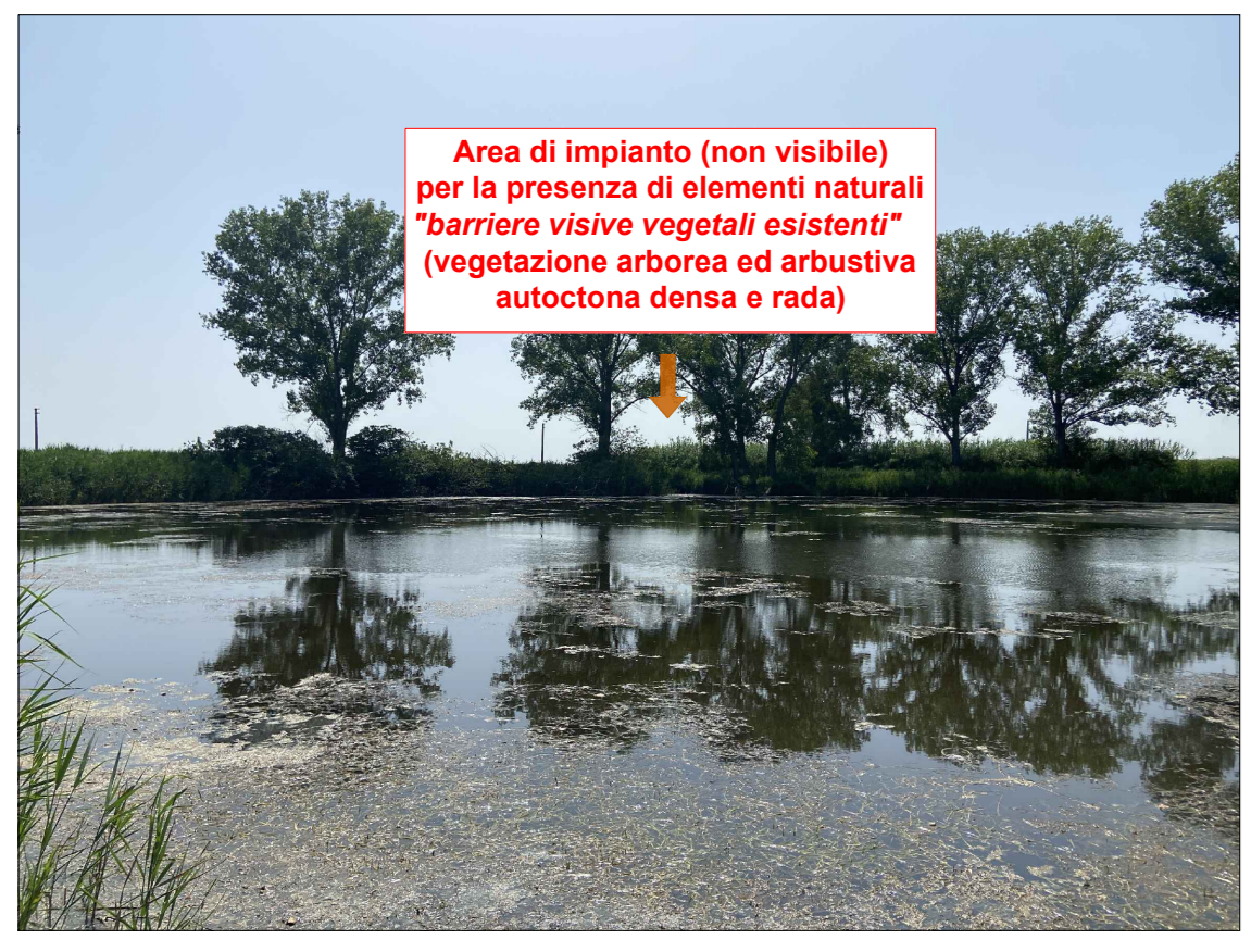
7_ "Lago di San Carlo"_ 41.458081, 13.118405; 41°27'29.1"N, 13°07'06.3"E L'area di impianto dista 1,49 km circa dal "Lago di San Carlo" (Beni ricognitivi di legge_ TAV_ B PTPR_ art.134 co.1 lett. b e art. 142 co.1 D.Lgs. 42/2004) non risultando visibile per la presenza di elementi naturali (vegetazione arbustiva autoctona densa e rada )