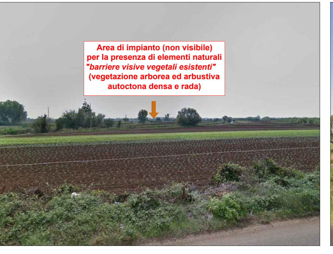
14_ "Ferrovia"_ 41.459661, 13.120813; 41°27'34.8"N, 13°07'14.9"E L'area di impianto dista 1,75 km circa dalla Ferrovia non risultando visibile per la presenza di elementi naturali (vegetazione arbustiva autoctona densa e rada)