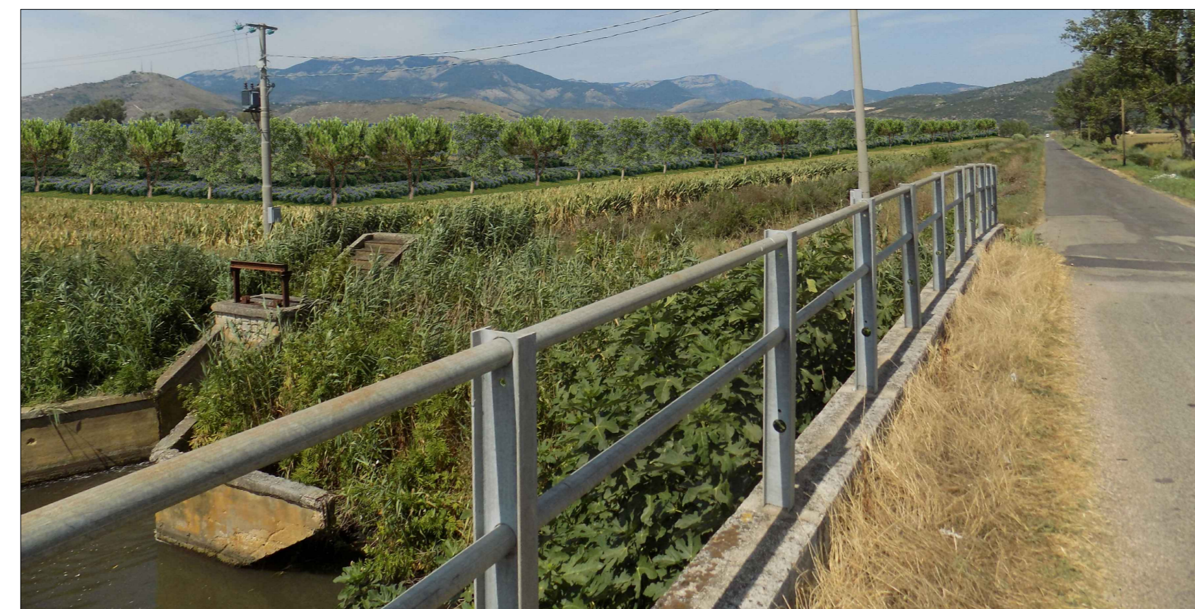
2_ "Via Migliara 48 sx"_ 41.441590, 13.095003; 41°26'29.7"N, 13°05'42.0"E Fotoinserimento dell' intervento progettuale con le opere di mitigazione