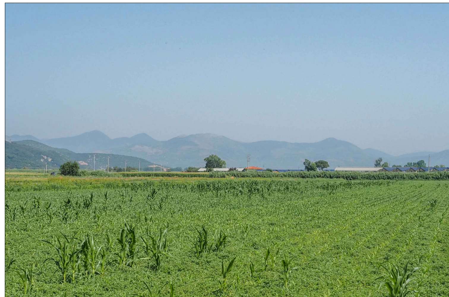
5_ "Vista da via Migliara 47"_ 41.458950, 13.093771; 41°27'32.2"N, 13°05'37.6"E Fotoinserimento del solo intervento progettuale