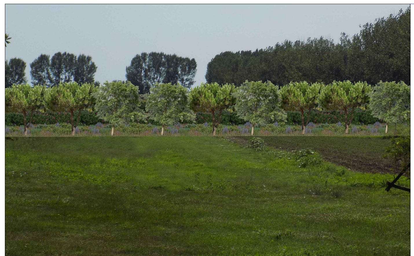
4_ "Vista dalla visibilità secondaria"_ 41.453024, 13.099388; 41°27'10.9"N, 13°05'57.8"E (Visibilità di progetto di nuova realizzazione interna al lotto) Fotoinserimento dell' intervento progettuale con le opere di mitigazione