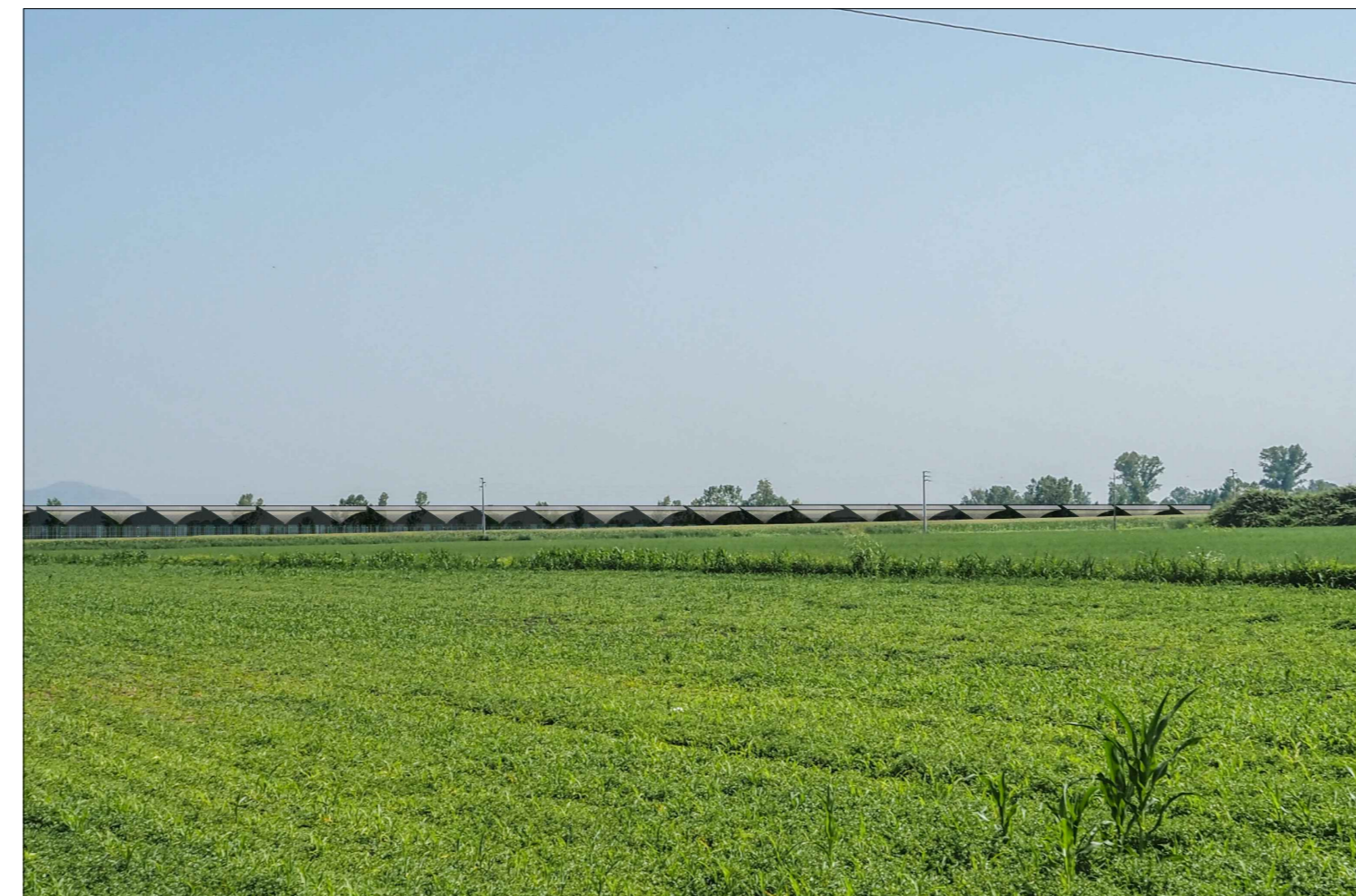
5a_ "Vista da via Migliara 47"_ 41.457949, 13.092564; 41°27'28.6"N, 13°05'33.2"E Fotoinserimento del solo intervento progettuale