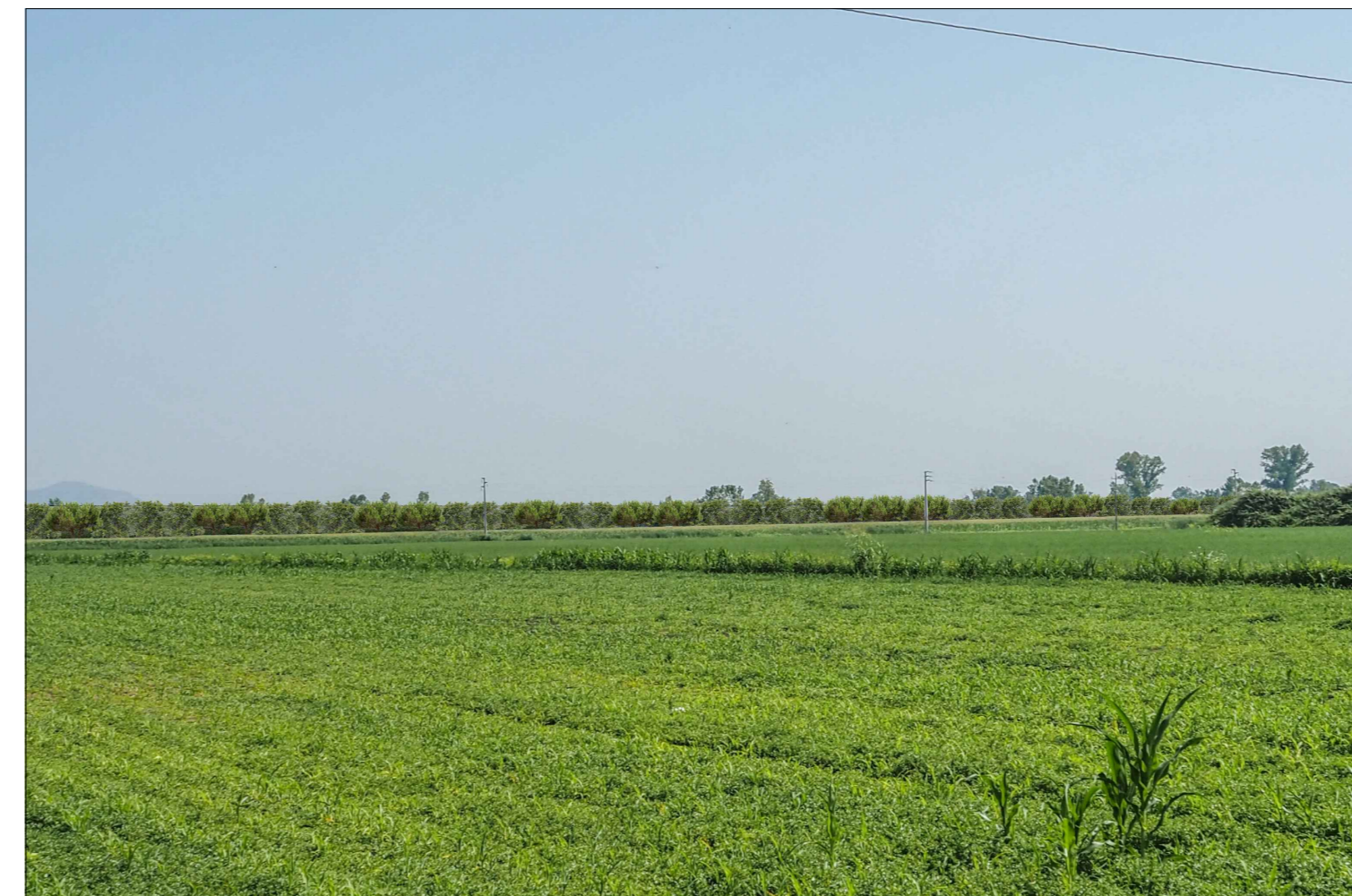
5a_ "Vista da via Migliara 47"_ 41.457949, 13.092564; 41°27'28.6"N, 13°05'33.2"E Fotoinserimento dell' intervento progettuale con le opere di mitigazione