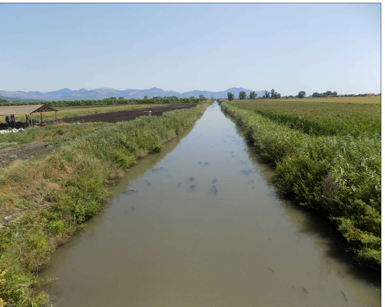
6_ "Canale della Selcella" (incrocio con via Migliara 47)_ 41.450862, 13.082630; 41°27'03.1"N, 13°04'57.5"E (Canale delle Bonifiche agrarie_ TAV_ B PTPR_ art.134 co.1 lett. c D.Lgs. 42/2004) Fotoinserimento dell' intervento progettuale con le opere di mitigazione