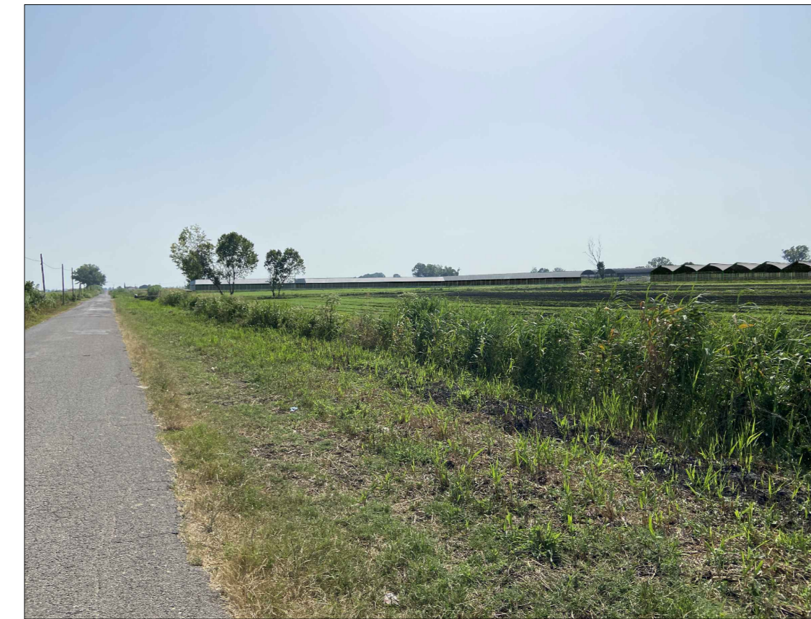
3_ "Via Migliara 48 sx"_ 41.447318, 13.102864; 41°26'50.3"N, 13°06'10.3"E Fotoinserimento del solo intervento progettuale