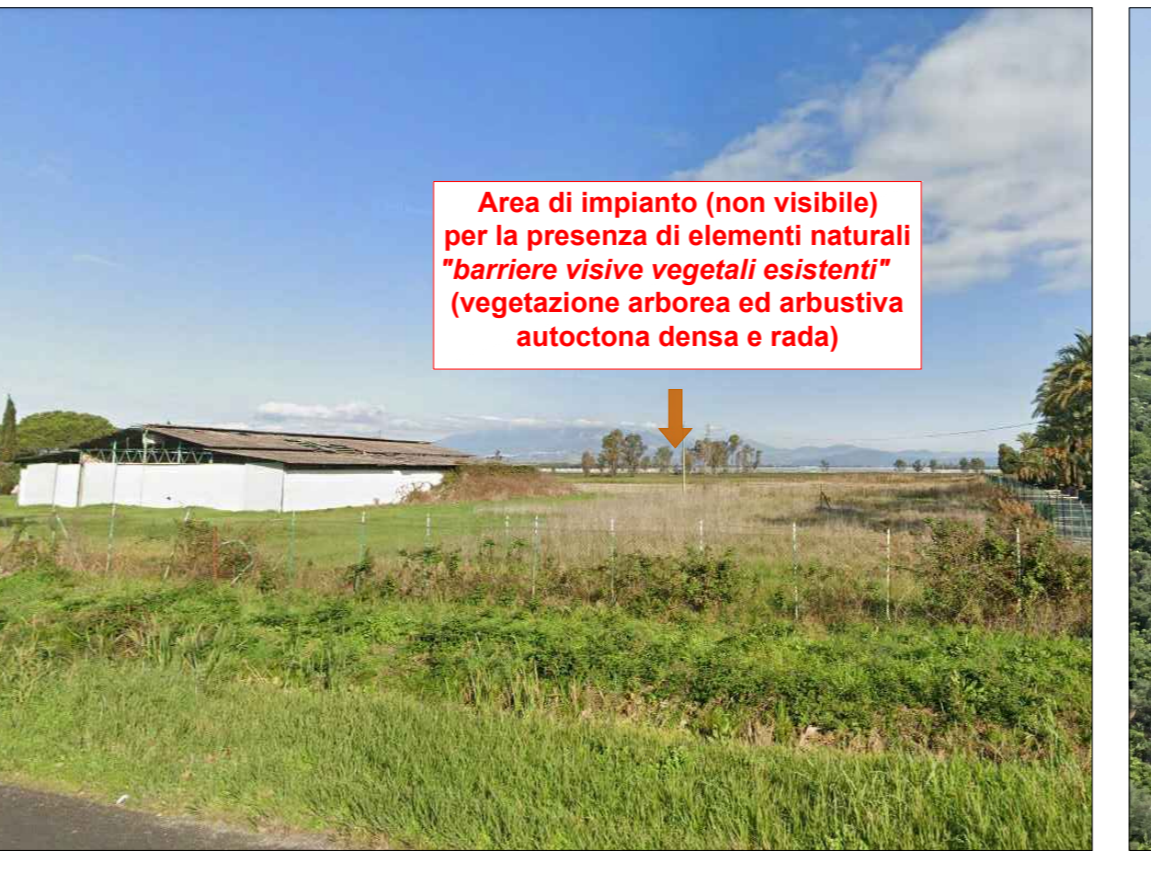
15_ "Riserva Statale Lestra della Coscia" (comune di Sabaudia (LT))_ 41.372187, 13.034055; 41°22'19.9"N, 13°02'02.6"E L'area di impianto dista 9,3 km circa dalla Riserva Statale_ "Lestra della Coscia" non risultando visibile per la presenza di elementi naturali (vegetazione arbustiva autoctona densa e rada)