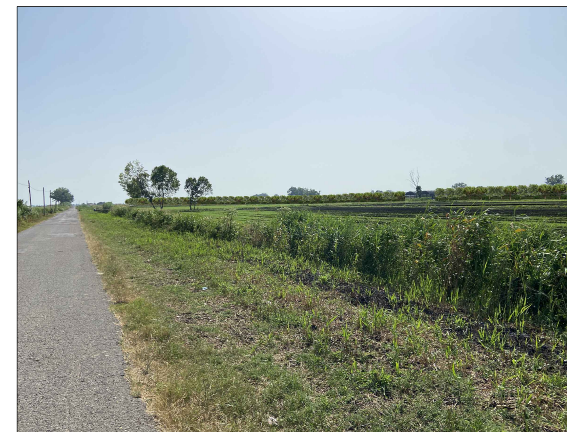
3_ "Via Migliara 48 sx"_ 41.447318, 13.102864; 41°26'50.3"N, 13°06'10.3"E Fotoinserimento dell' intervento progettuale con le opere di mitigazione