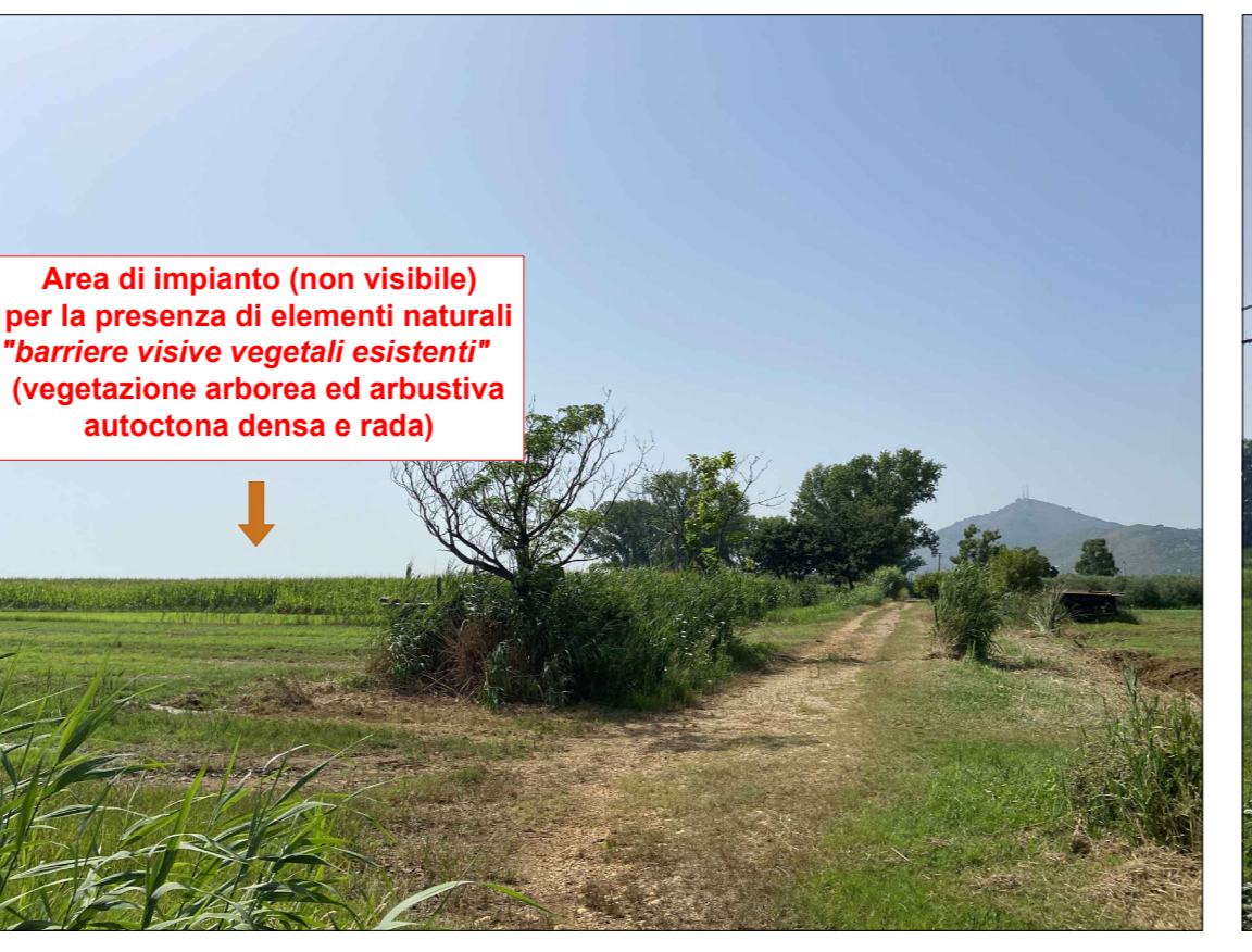
9_ "Lago Bianco"_ 41.454507, 13.123093; 41°27'16.2"N, 13°07'23.1"E L'area di impianto dista 1,65 km circa dal "Lago di San Carlo" (Beni ricognitivi di legge_ TAV_ B PTPR_ art.134 co.1 lett. b e art. 142 co.1 D.Lgs. 42/2004) non risultando visibile per la presenza di elementi naturali (vegetazione arbustiva autoctona densa e rada)