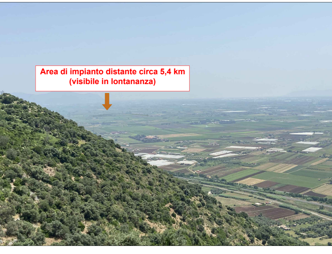
16_ "Sezze (LT)_ "Zone circostanti l'abitato del comune di Sezze (LT)"_ 41.496902, 13.059217; 41°29'48.9"N, 13°03'33.2"E L'area di impianto dista 5,4 km circa dalle "Zone circostanti l'abitato del comune di Sezze (LT)"_ Beni di insieme, vaste località con valore estetico tradizionale, bellezze panoramiche (art.8 PTPR) Fotoinserimento del solo intervento progettuale