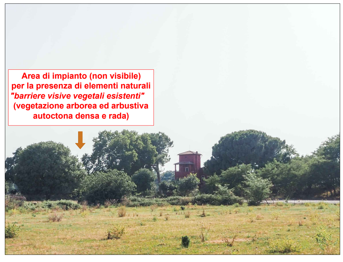
12_ "Ville romane"_ 41.436330, 13.166370; 41°26'07.2", 13°09'58.9"E L'area di impianto dista 5,4 km circa dalle ville romane (Beni ricognitivi di piano_ Beni puntuali testimonianza dei caratteri archeologici e storici_ TAV_ B PTPR_ art.134 co.1 lett. c D.Lgs. 42/2004) non risultando visibile per la presenza di elementi naturali (vegetazione arbustiva autoctona densa e rada)