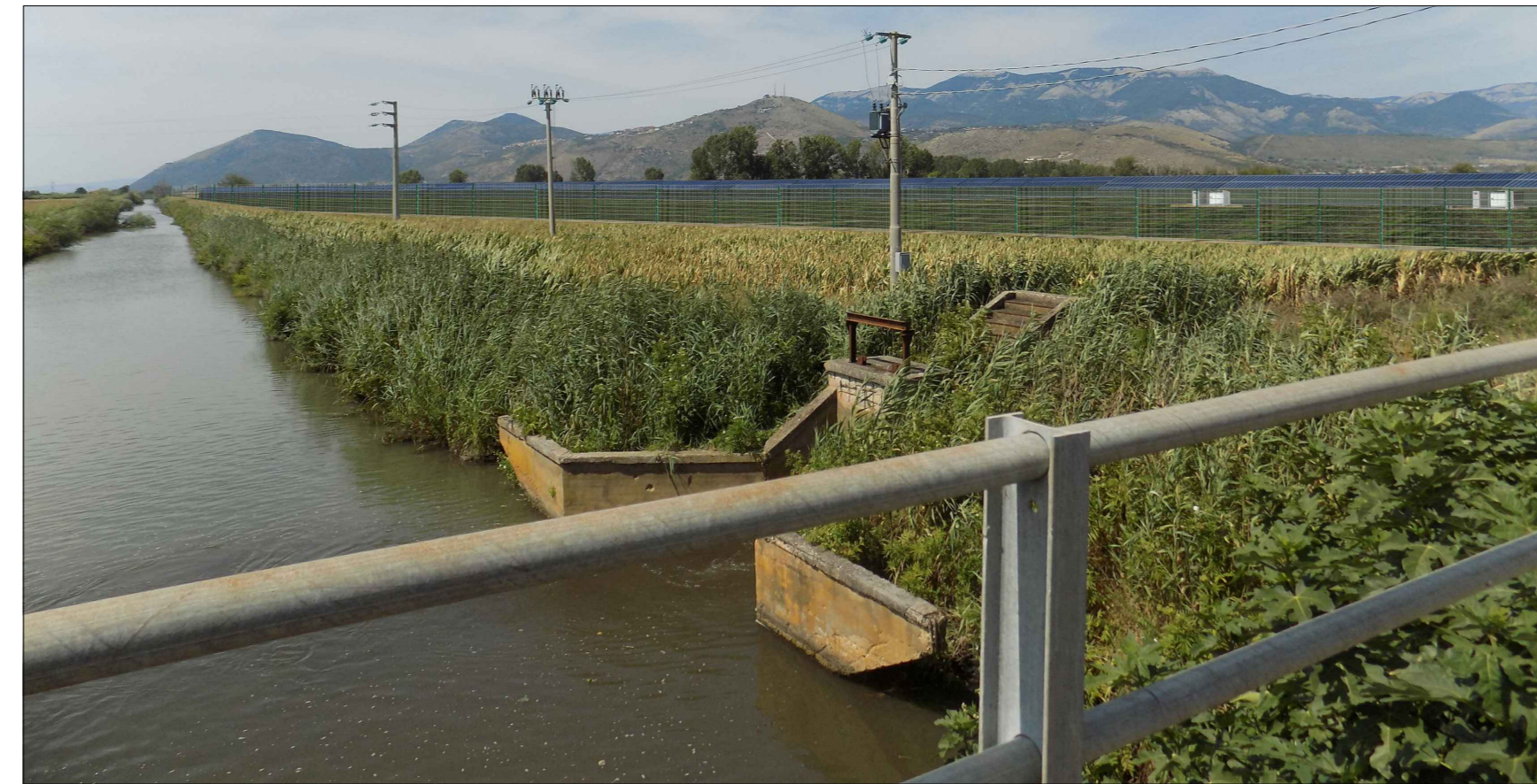
1_ "Canale della Selcella" (incrocio con via Migliara 48 sx)_ 41.441511, 13.094882; 41°26'29.4"N, 13°05'41.6"E (Canale delle Bonifiche agrarie_ TAV_ B PTPR_ art.134 co.1 lett. c D.Lgs. 42/2004) Fotoinserimento del solo intervento progettuale