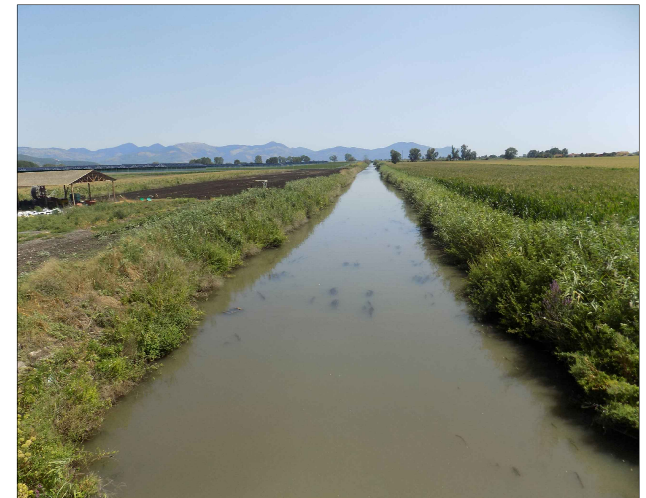
6_ "Canale della Selcella" (incrocio con via Migliara 47)_ 41.450862, 13.082630; 41°27'03.1"N, 13°04'57.5"E (Canale delle Bonifiche agrarie_ TAV_ B PTPR_ art.134 co.1 lett. c D.Lgs. 42/2004) Fotoinserimento del solo intervento progettuale