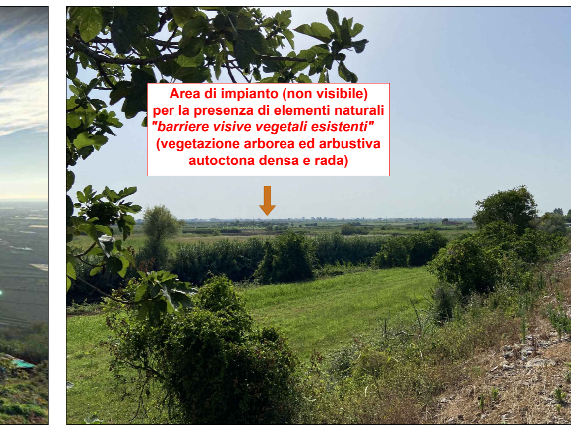
11_ "Dolina di crollo lungo la SP. Forestola"_ 41.451550, 13.130100; 41°27'05.6"N, 13°07'48.4"E L'area di impianto dista 2,2 km circa dalla struttura romana (Beni ricognitivi di piano_ Beni puntuali testimonianza dei caratteri archeologici e storici_ TAV_ B PTPR_ art.134 co.1 lett. c D.Lgs. 42/2004) non risultando visibile per la presenza di elementi naturali (vegetazione arbustiva autoctona densa e rada)