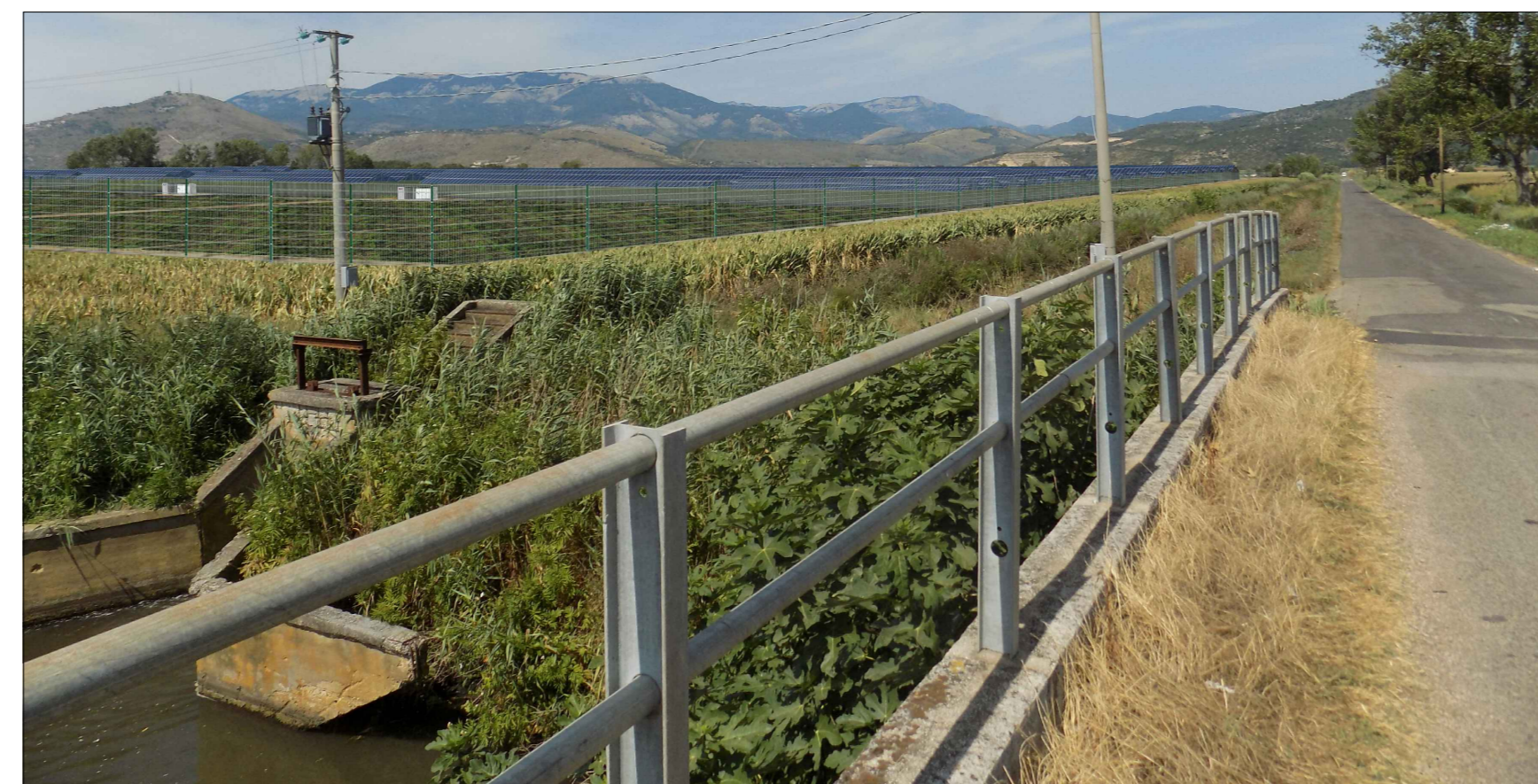
2_ "Via Migliara 48 sx"_ 41.441590, 13.095003; 41°26'29.7"N, 13°05'42.0"E Fotoinserimento del solo intervento progettuale