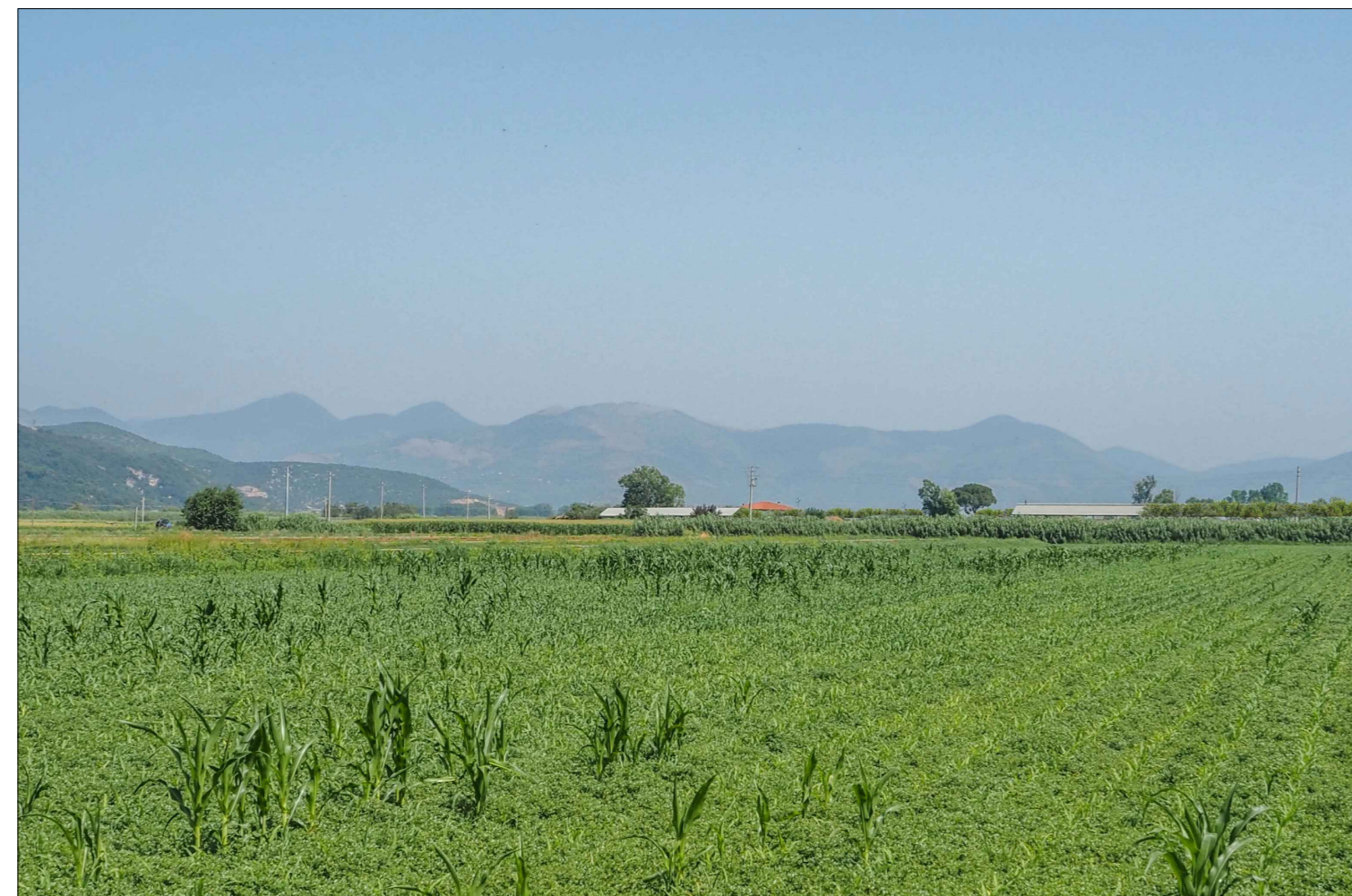
5_ "Vista da via Migliara 47"_ 41.458950, 13.093771; 41°27'32.2"N, 13°05'37.6"E Fotoinserimento dell' intervento progettuale con le opere di mitigazione