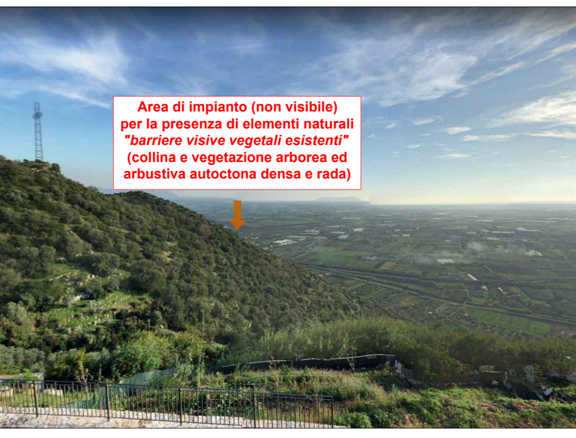
10_ "Strada panoramica"_ 41.444638, 13.131660; 41°27'14.4"N, 13°07'54.0"E L'area di impianto dista 2,28 km circa dal "Lago Mazzocchio" (Beni ricognitivi di legge_ TAV_ B PTPR_ art.134 co.1 lett. b e art. 142 co.1 D.Lgs. 42/2004) non risultando visibile per la presenza di elementi naturali (collina e vegetazione arbustiva autoctona densa e rada)