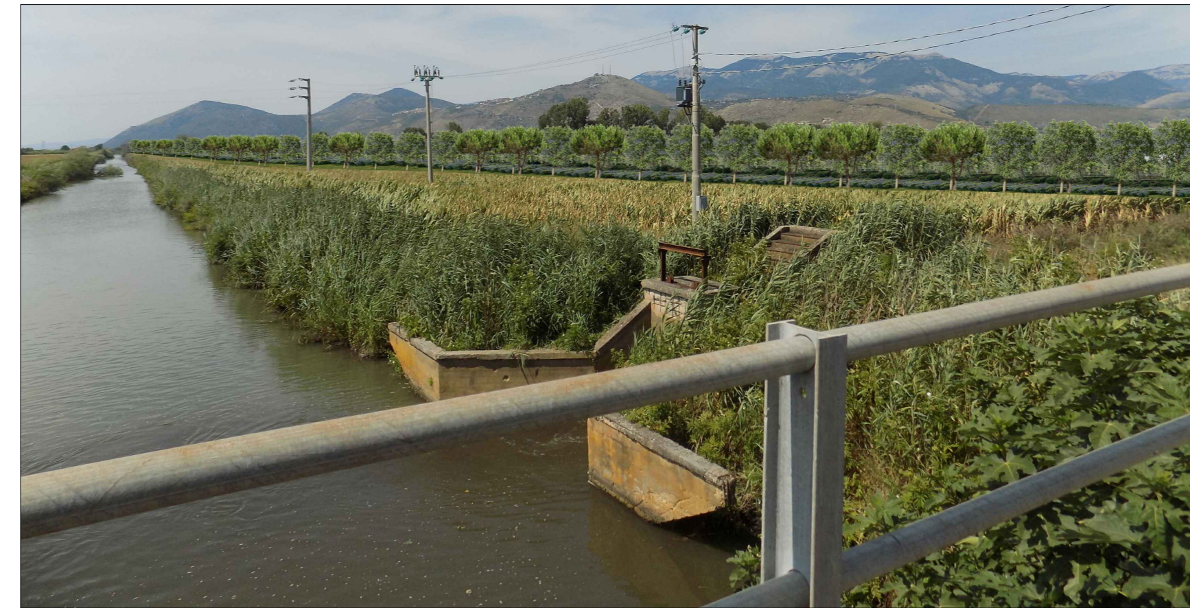
1_ "Canale della Selcella" (incrocio con via Migliara 48 sx)_ 41.441511, 13.094882; 41°26'29.4"N, 13°05'41.6"E (Canale delle Bonifiche agrarie_ TAV_ B PTPR_ art.134 co.1 lett. c D.Lgs. 42/2004) Fotoinserimento dell' intervento progettuale con le opere di mitigazione