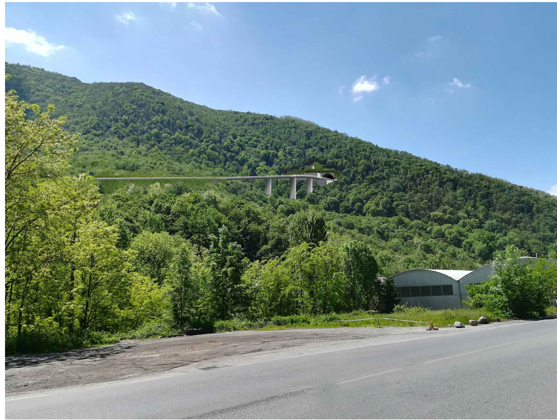
FOTOINSERIMENTO A VIADOTTO