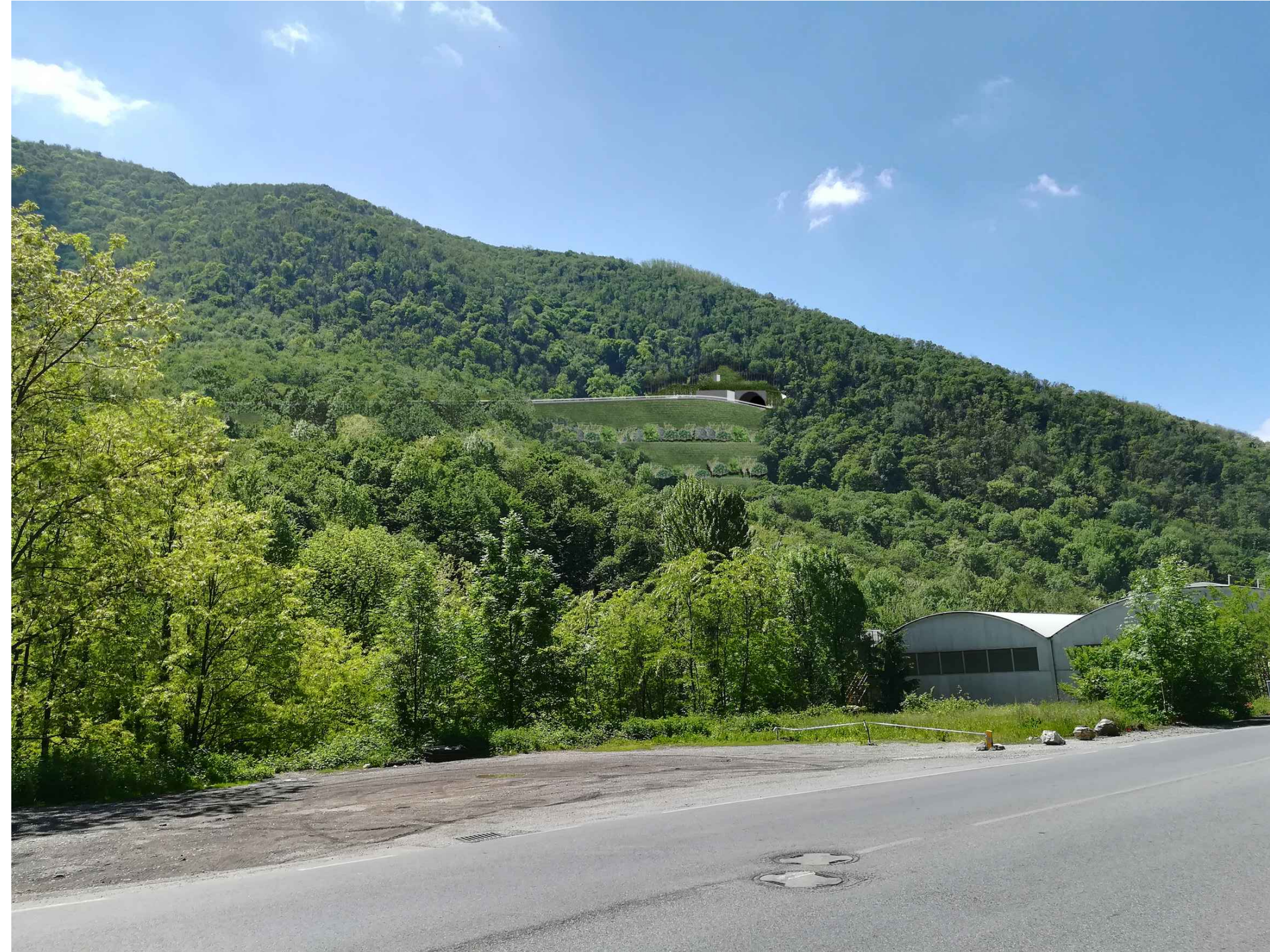
FOTOINSERIMENTO A VARIANTE LUMEZZANE - TERRE RINFORZATE