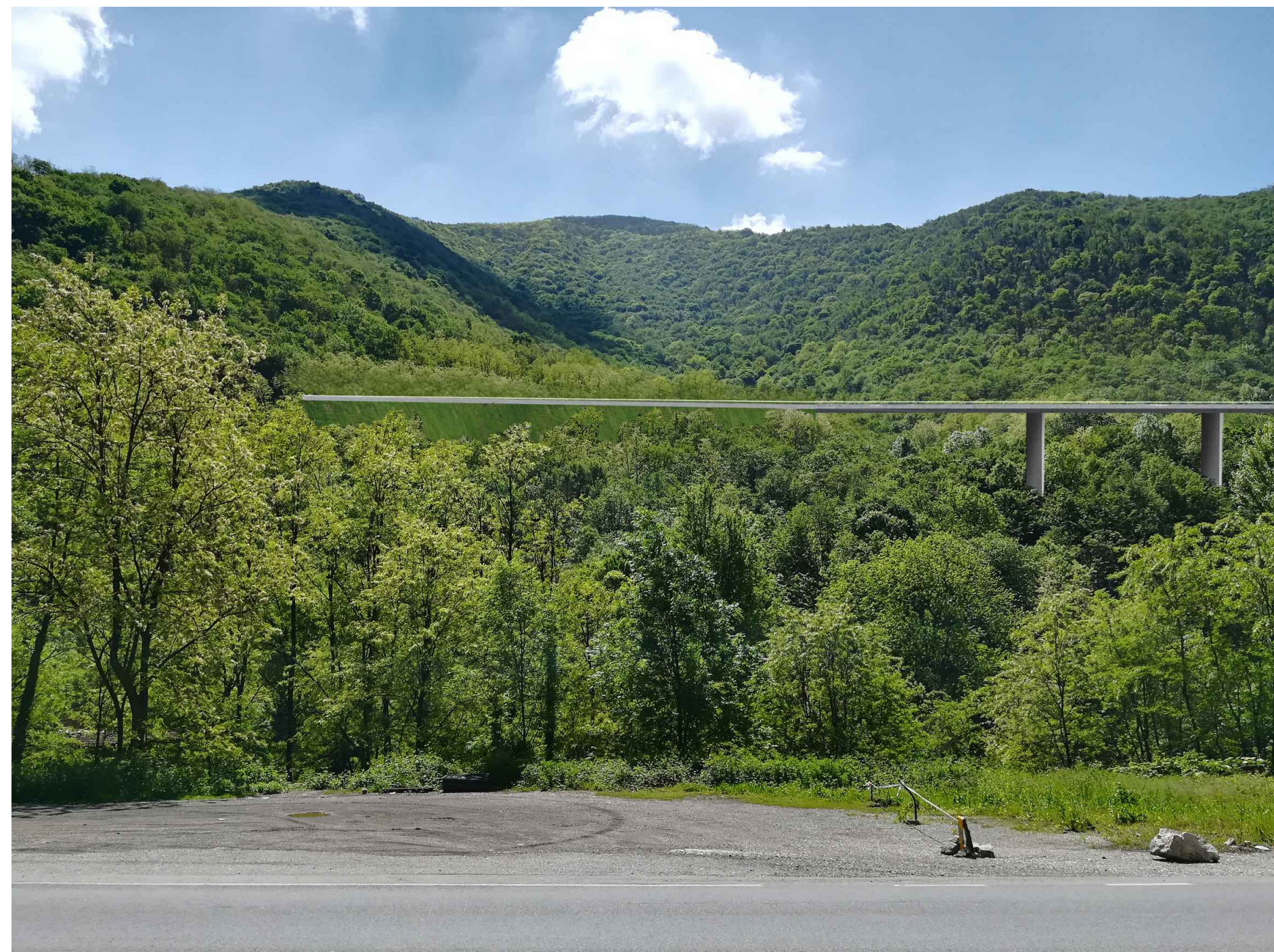
FOTOINSERIMENTO B VIADOTTO