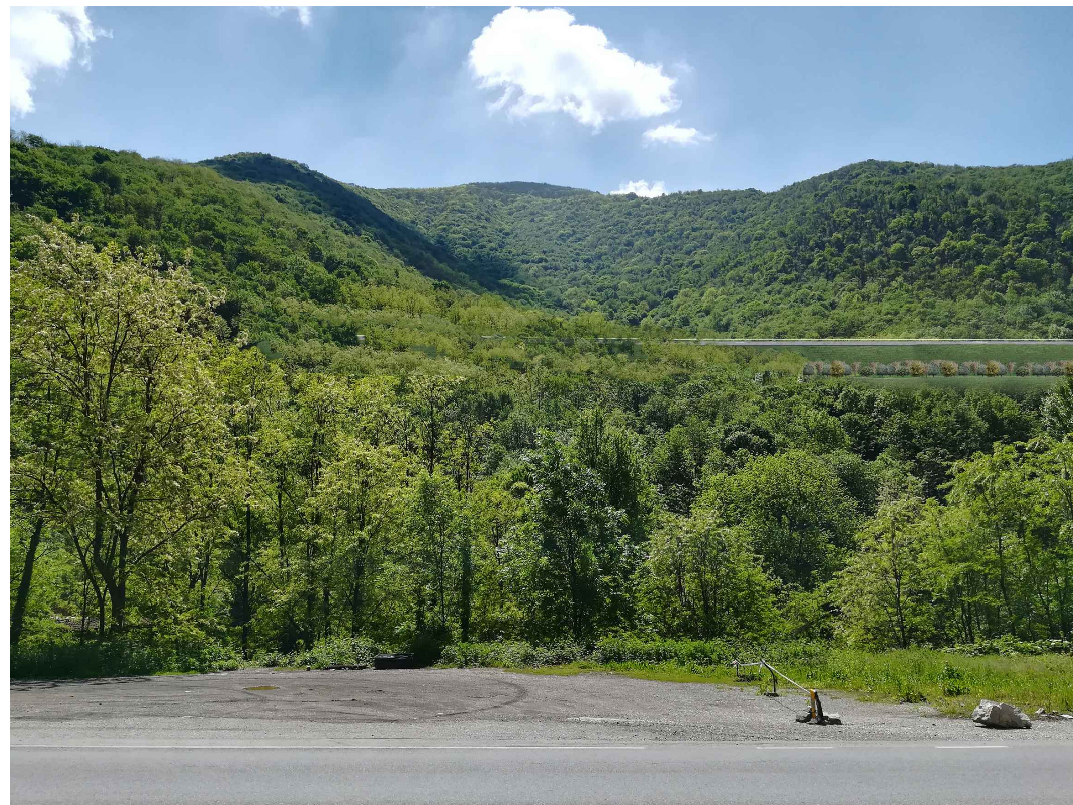
FOTOINSERIMENTO B VARIANTE LUMEZZANE - TERRE RINFORZATE