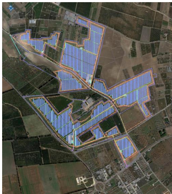
Figura 1. Individuazione dell'impianto agrivoltaico "ARCHI" in territorio di Leverano

Il progetto definitivo delle opere di rete previste per la connessione dell'impianto alla Rete di Trasmissione Nazionale, composto dalla Stazione di trasformazione Terna 380 kV/150kV e dalla Substatione 150 kV/30kV, costituisce parte integrante del progetto definitivo dell'impianto fotovoltaico, è redatto a cura del produttore Nardò Solar Energy S.r.l. ed è integralmente allegato all'istanza di autorizzazione.