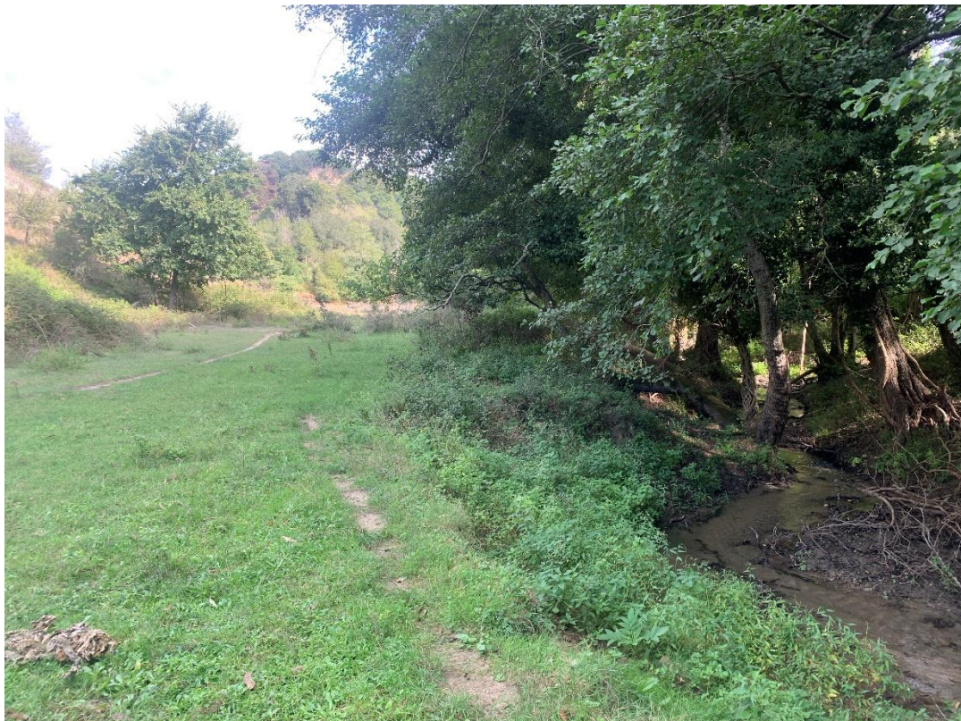
CAVIDOTTO SU VIABILITÀ AREA PARCO