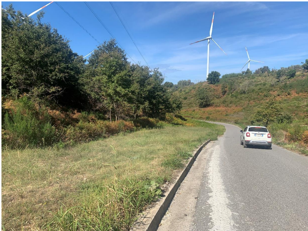
CAVIDOTTO SU VIABILITÀ COMUNALE ESISTENTE