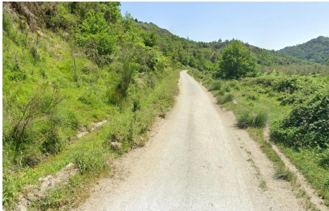
CAVIDOTTO SU VIABILITÀ AREA PARCO