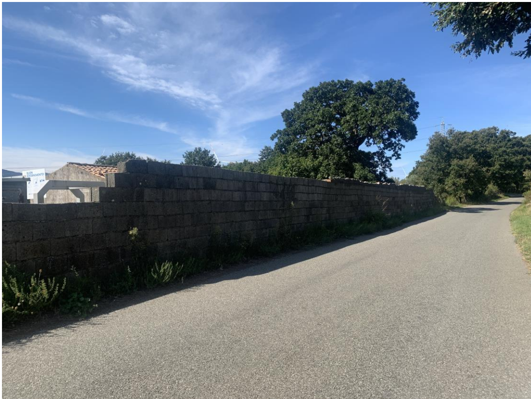
CAVIDOTTO SU VIABILITÀ COMUNALE ESISTENTE