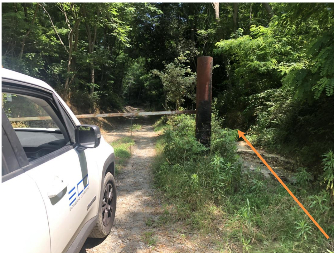
CAVIDOTTO SU VIABILITÀ COMUNALE ESISTENTE