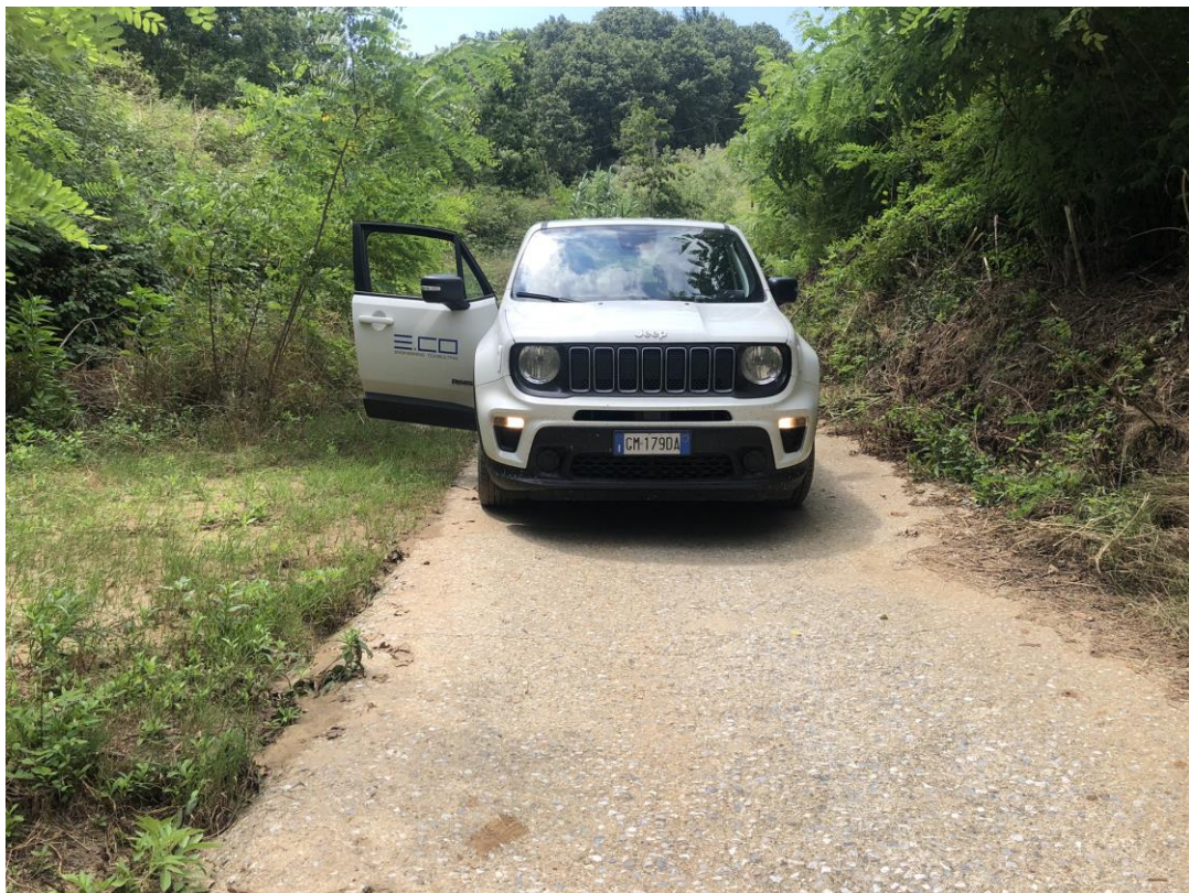
CAVIDOTTO SU VIABILITÀ COMUNALE ESISTENTE