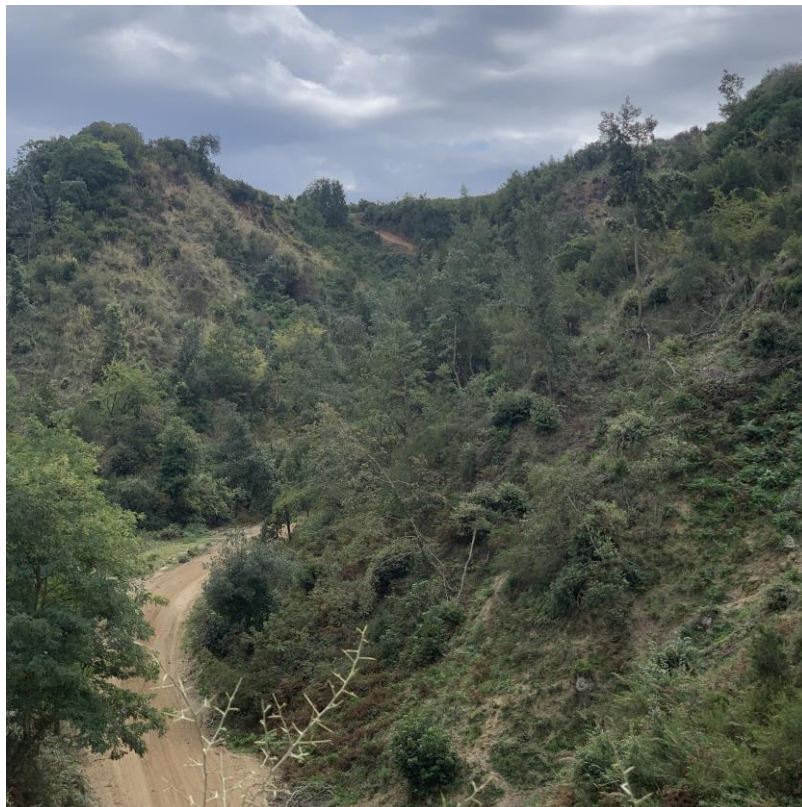
CAVIDOTTO SU VIABILITÀ INTERPODERALE ESISTENTE