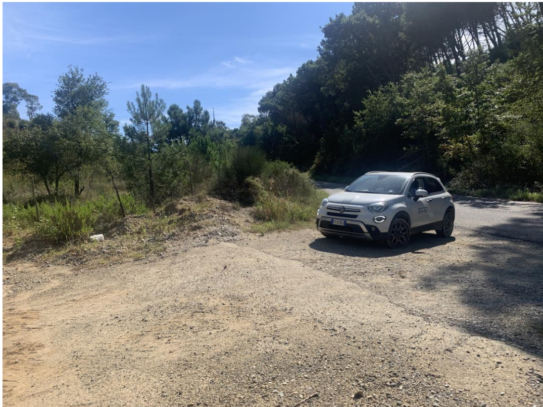
CAVIDOTTO SU VIABILITÀ COMUNALE ESISTENTE