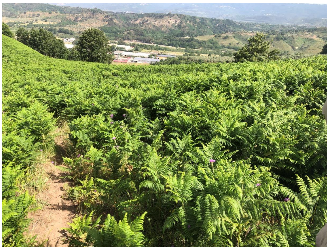
CAVIDOTTO SU VIABILITÀ AREA PARCO