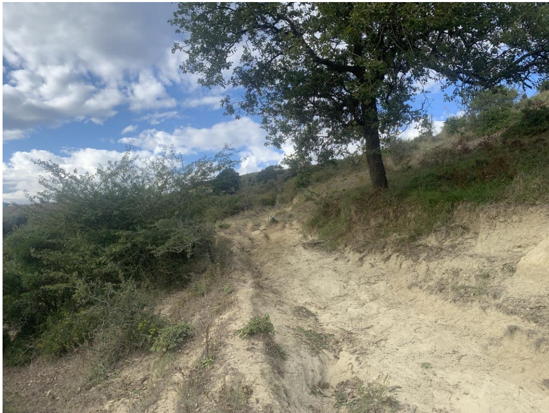
CAVIDOTTO SU VIABILITÀ INTERPODERALE ESISTENTE