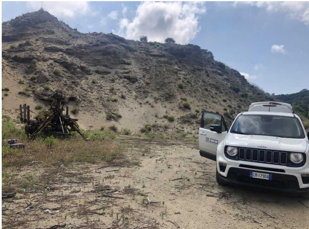
CAVIDOTTO SU VIABILITÀ INTERPODERALE ESISTENTE