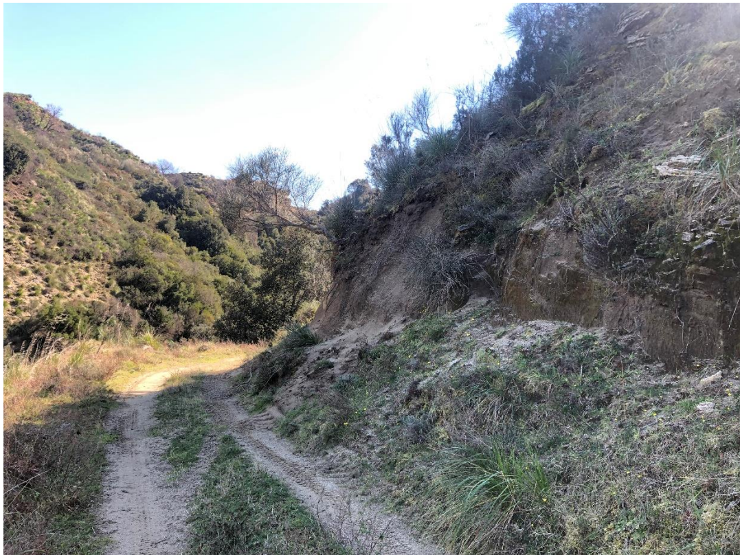
CAVIDOTTO SU VIABILITÀ AREA PARCO