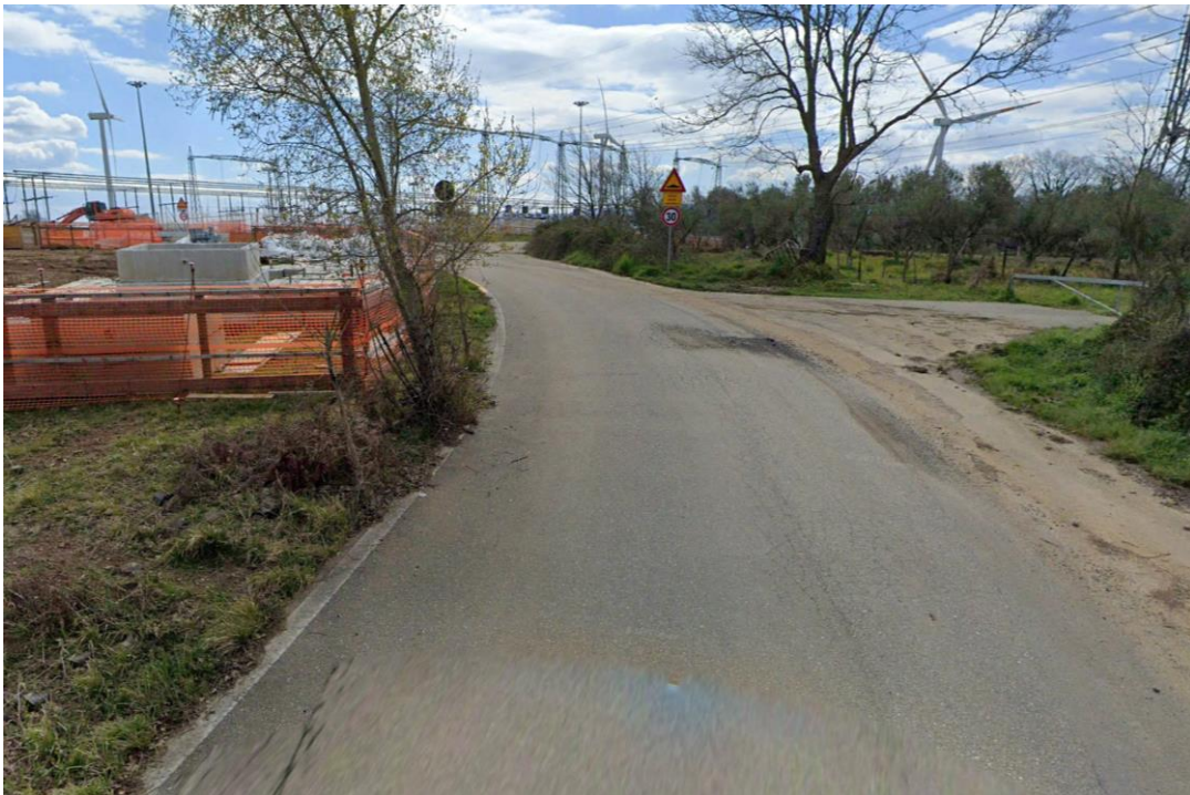
CAVIDOTTO SU VIABILITÀ COMUNALE ESISTENTE