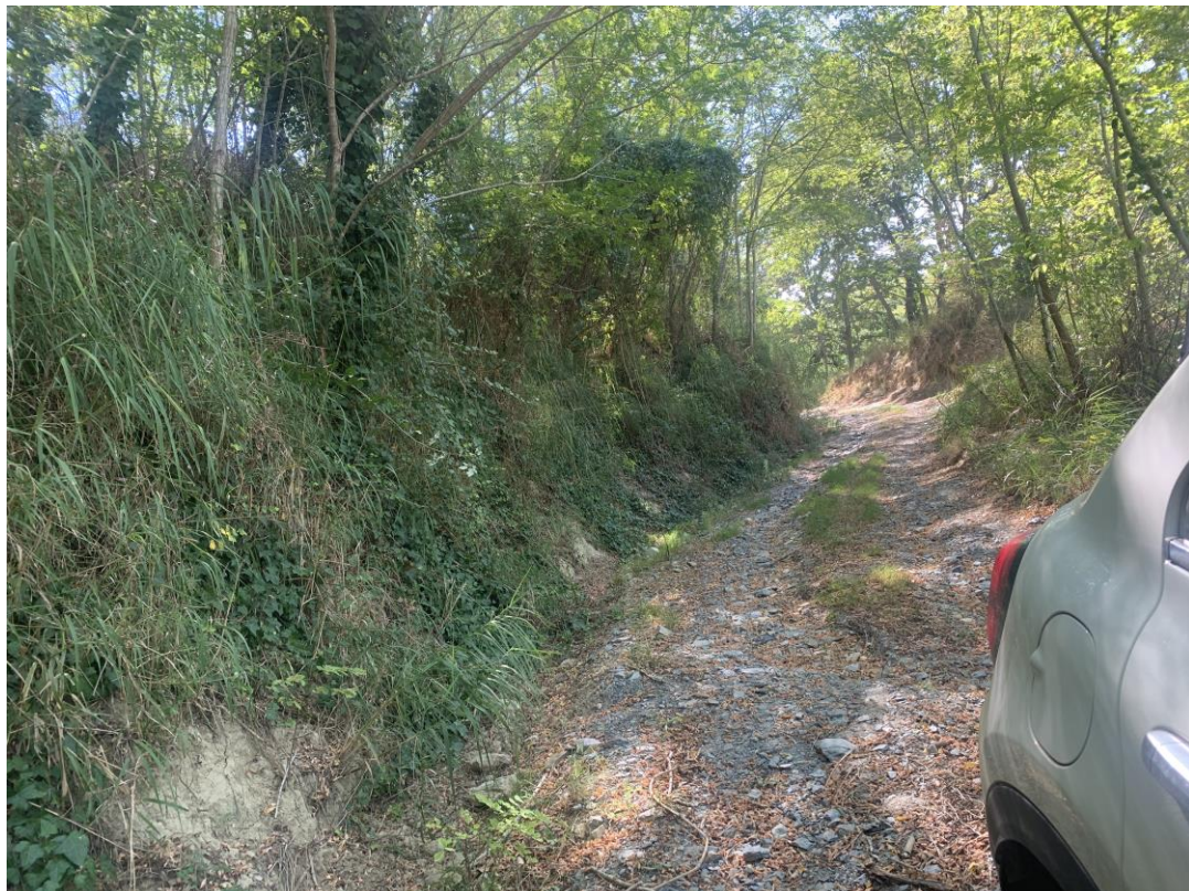
CAVIDOTTO SU VIABILITÀ COMUNALE ESISTENTE