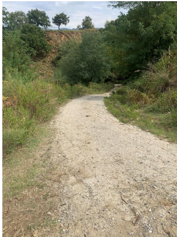
CAVIDOTTO SU VIABILITÀ AREA PARCO