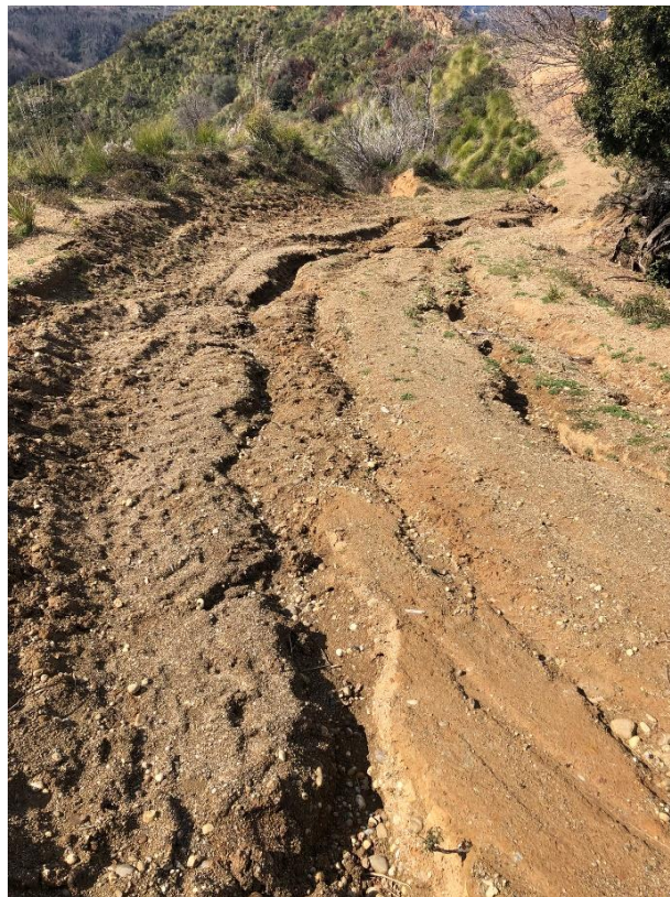
CAVIDOTTO SU VIABILITÀ AREA PARCO