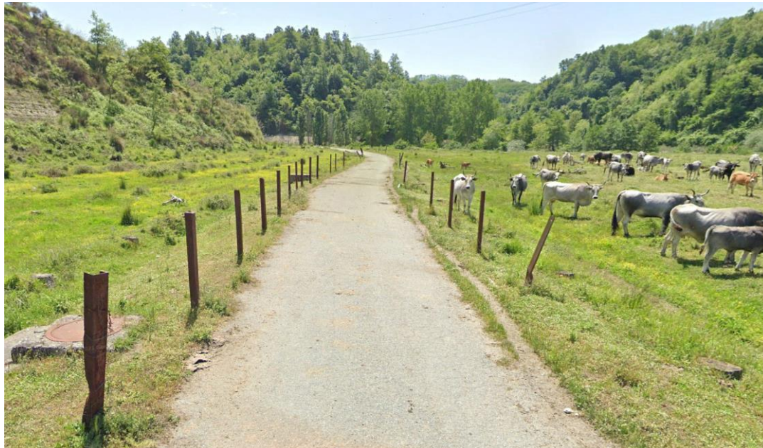
CAVIDOTTO SU VIABILITÀ AREA PARCO