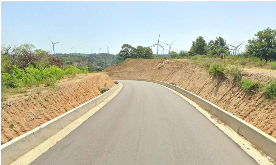
CAVIDOTTO SU VIABILITÀ COMUNALE ESISTENTE