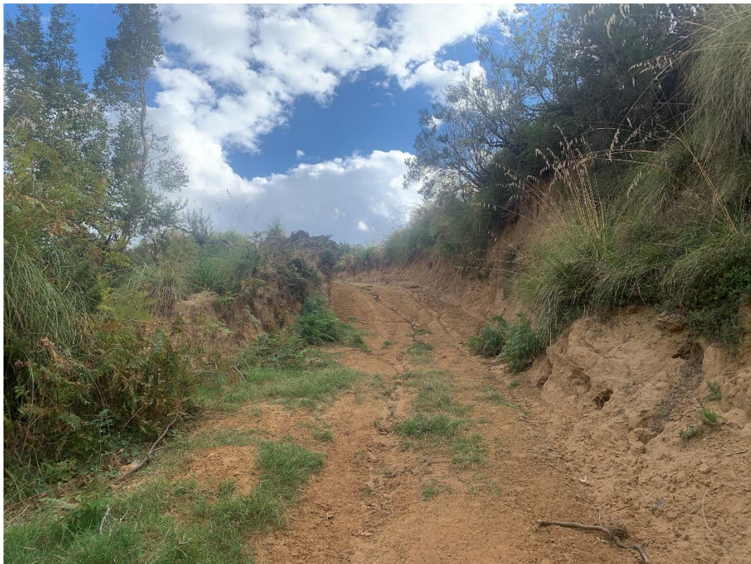
CAVIDOTTO SU VIABILITÀ AREA PARCO