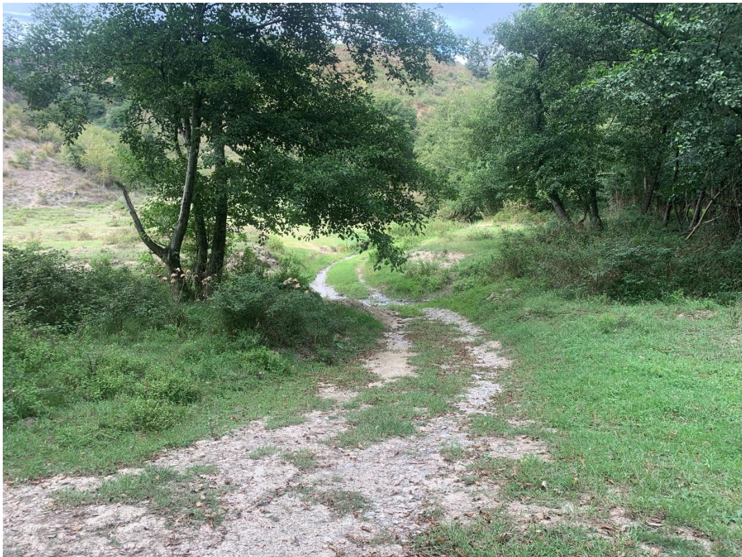
CAVIDOTTO SU VIABILITÀ AREA PARCO