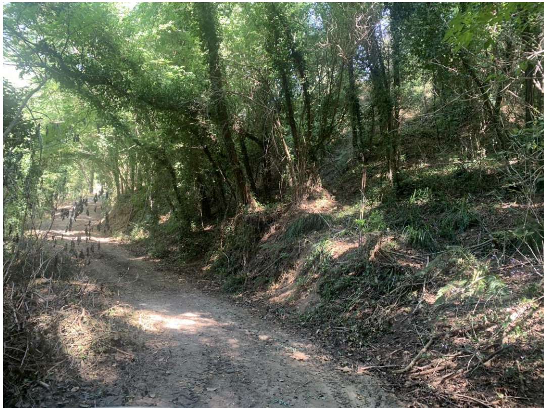
CAVIDOTTO SU VIABILITÀ COMUNALE ESISTENTE