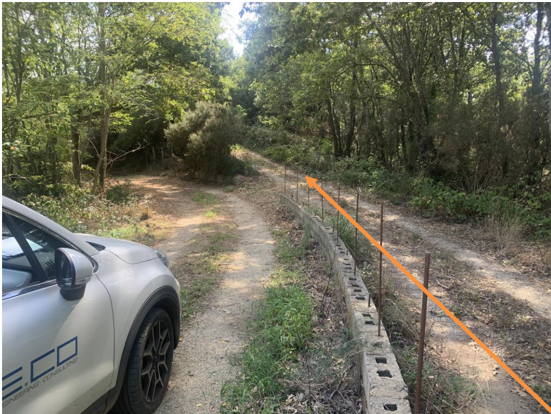
CAVIDOTTO SU VIABILITÀ COMUNALE ESISTENTE