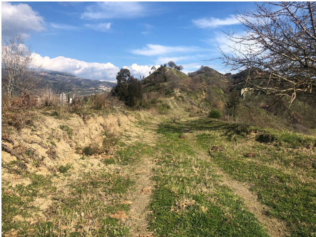
CAVIDOTTO SU VIABILITÀ AREA PARCO