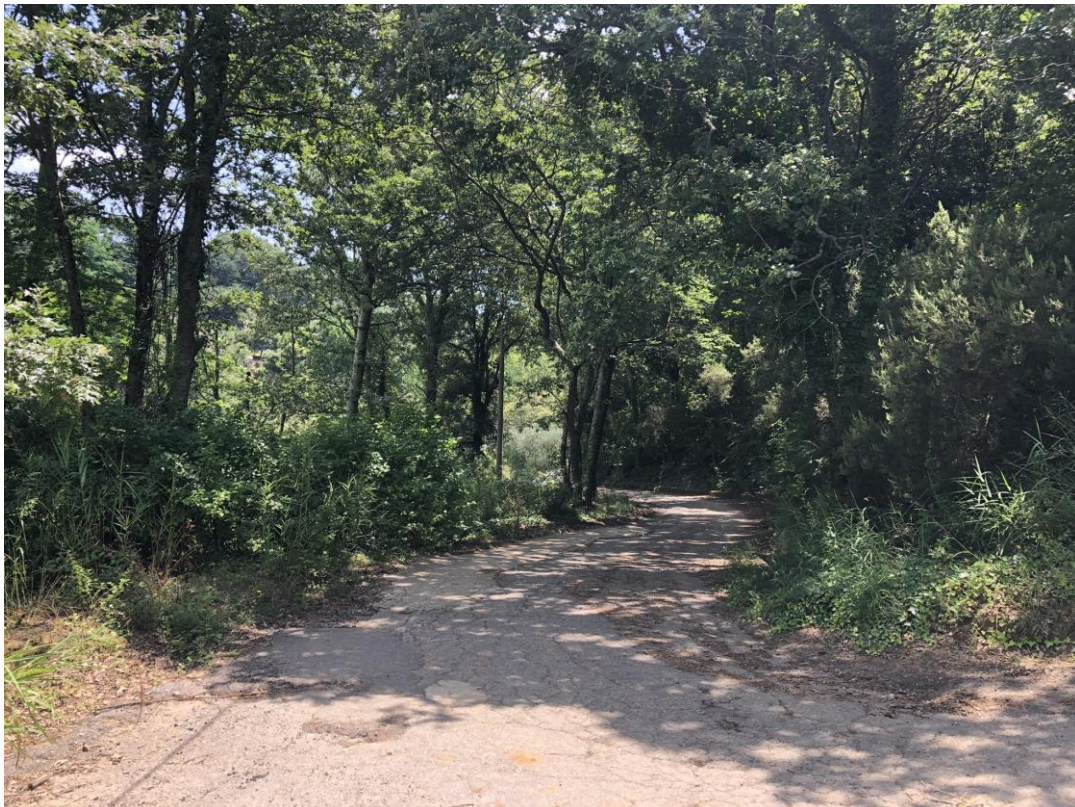
CAVIDOTTO SU VIABILITÀ COMUNALE ESISTENTE