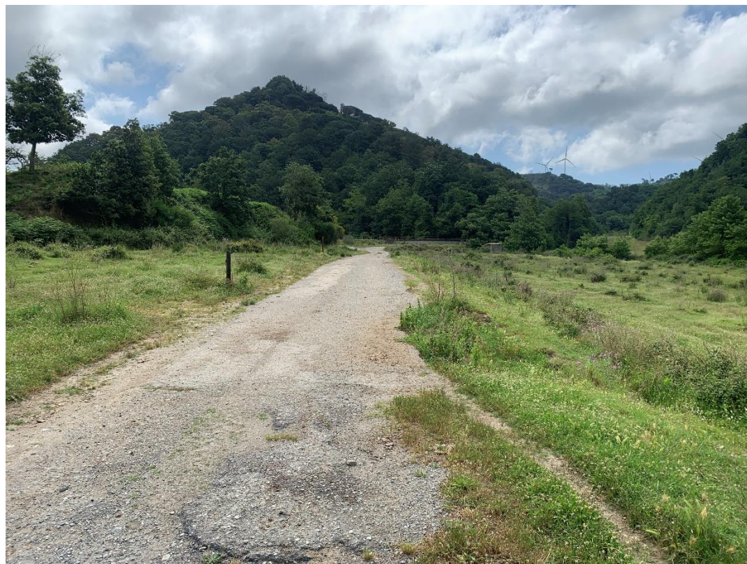
CAVIDOTTO SU VIABILITÀ AREA PARCO