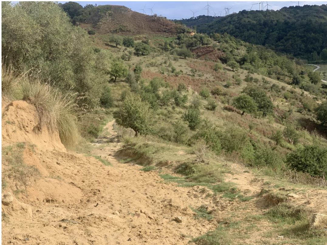
CAVIDOTTO SU VIABILITÀ INTERPODERALE ESISTENTE